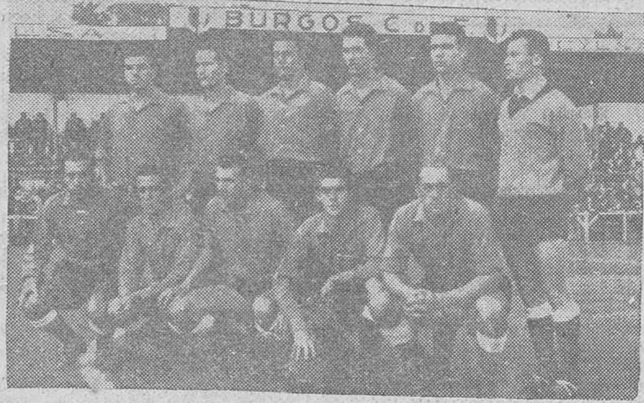
El conjunto de la U. D. Salamanca alineado en Zatorre poco antes de dar comienzo el encuentro.