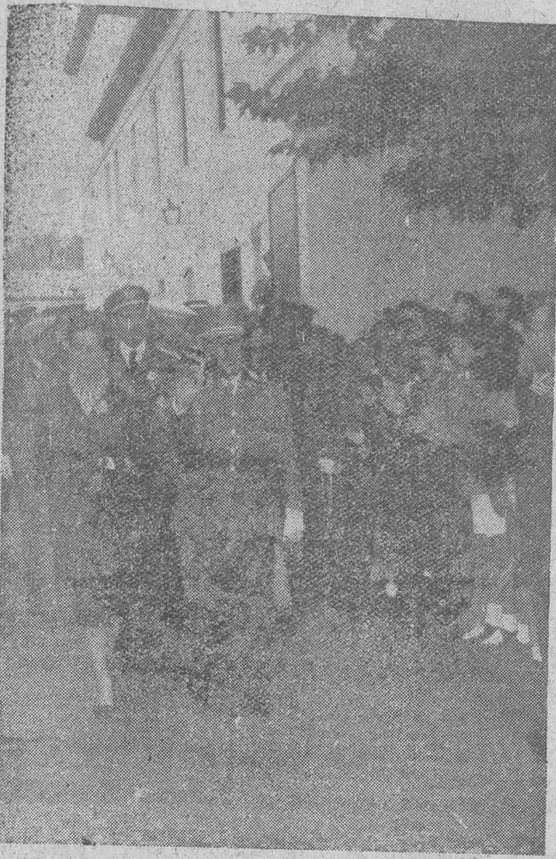
El Pardo. — Terminada la misa celebrada en la capilla del Palacio, con motivo de la fiesta onomástica del Caudillo, S. E. el Jefe del Estado y su esposa se trasladan al Paseo del Pardo entre las calurosas muestras de entusiasmo del público estacionado para verlos.

Presentan sus credenciales al Jefe del Estado los nuevos embajadores de Venezuela, Cuba y Guatemala