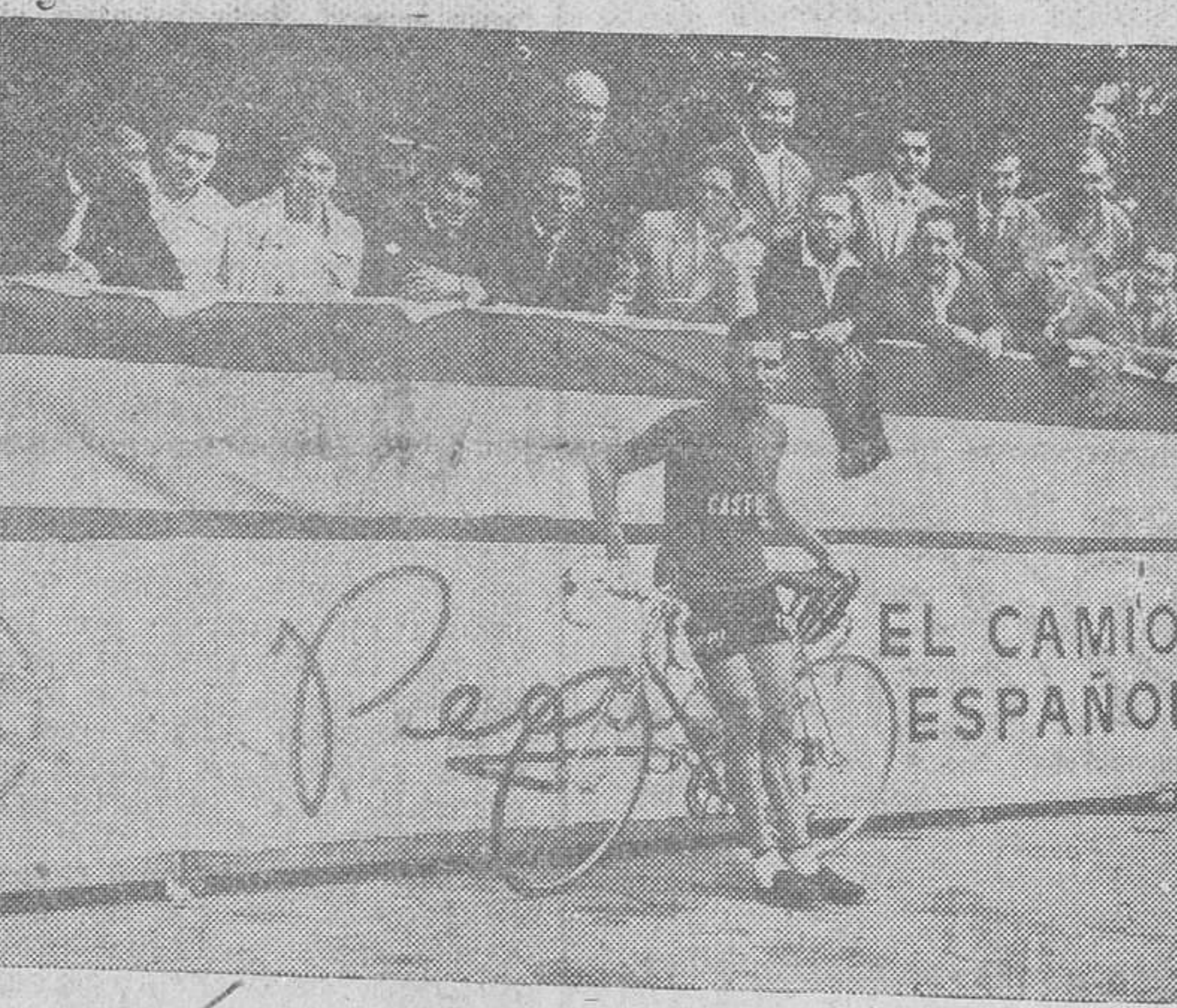
Federico Martín Bahamontes, vencedor de la Vuelta a Francia, campeón de España de Montaña y líder del equipo castellano.

Madrid. — El domingo se disputó el campeonato ciclista de España por regiones para corredores profesionales, sobre un circuito que totalizaba 163 kilómetros.