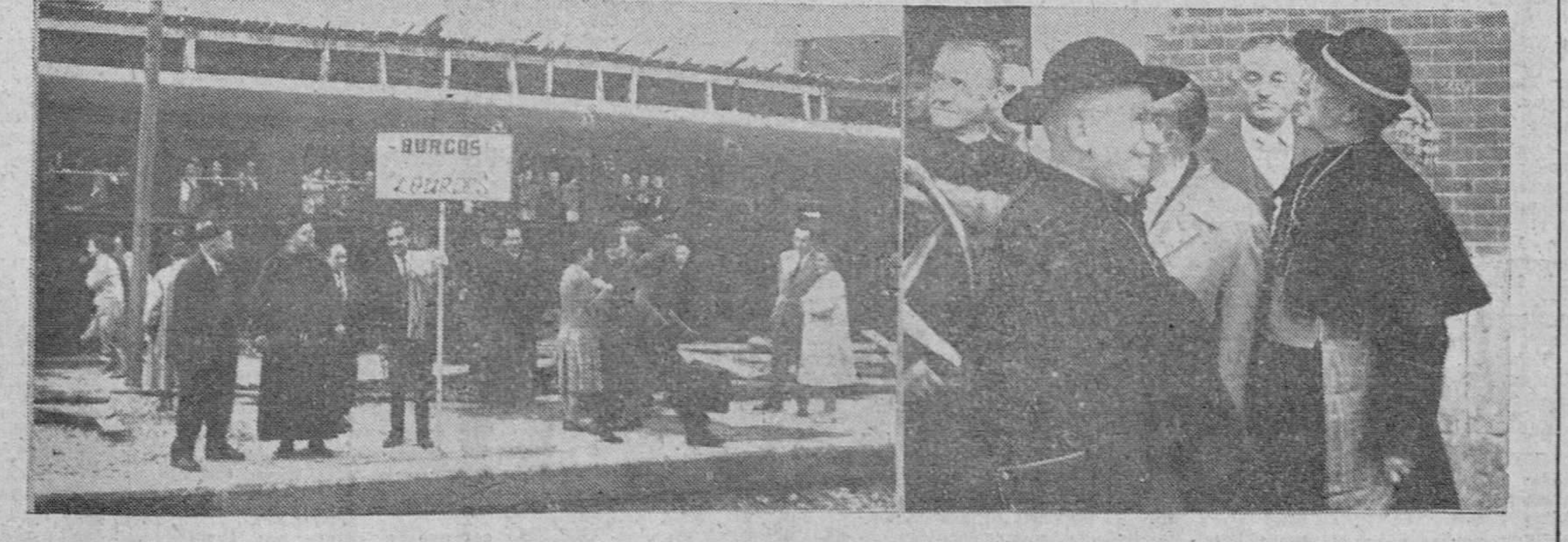
Dos momentos gráficos de la salida de la segunda peregrinación diocesana burgalesa hacia el santuario mariano de Lourdes. A la izquierda, un grupo de peregrinos, antes de partir el tren especial. A la derecha, el Excmo. Sr. Arzobispo de la diócesis —que marcha al frente de la expedición y los miembros de la junta organizadora del viaje.—