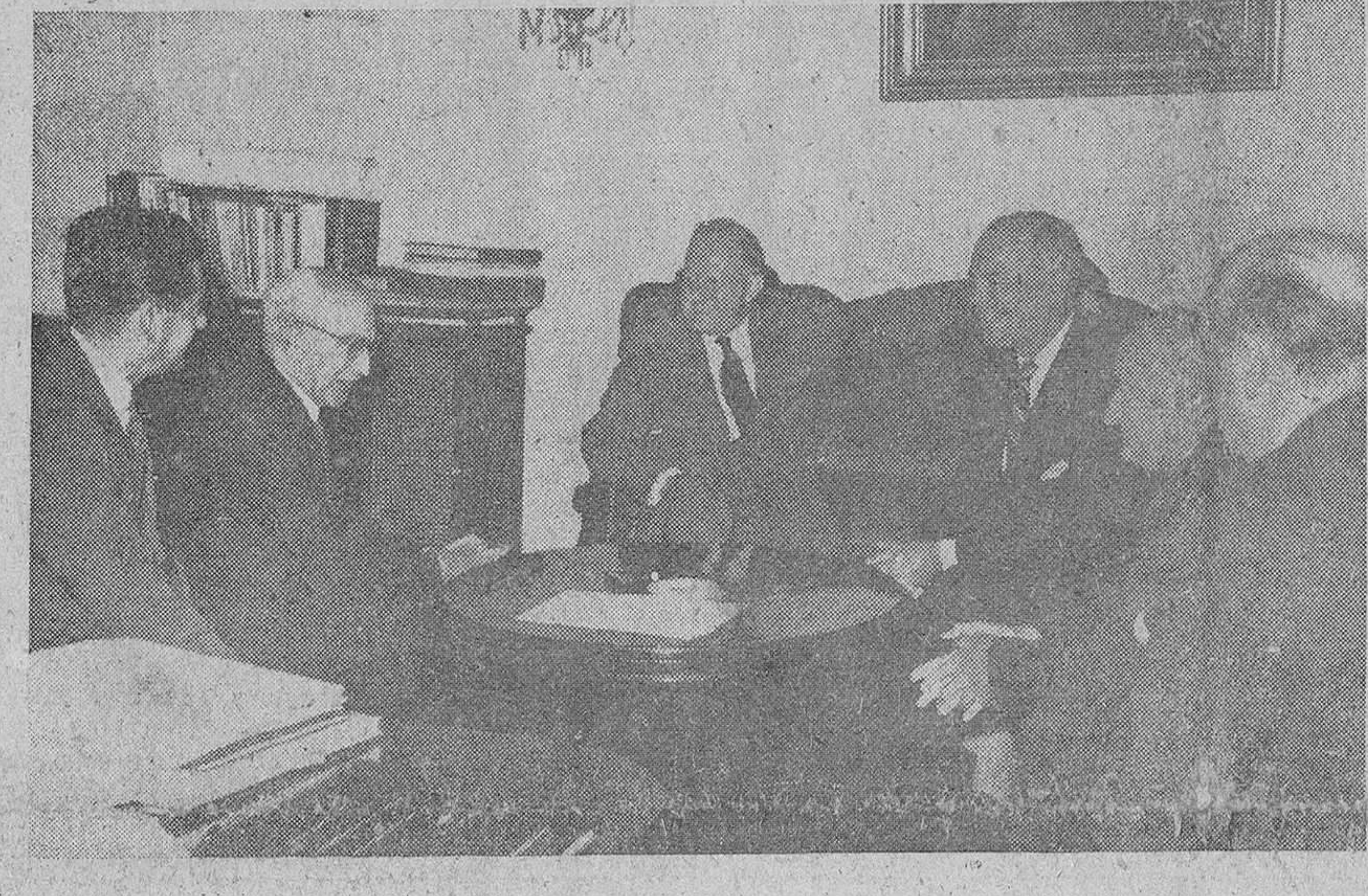
Madrid.— Un momento de la visita efectuada al ministro español de Industria, Sr. Planell por el subsecretario de Estado norteamericano para Asuntos Económicos, Sr. Dillon, acompañado del Administrador del Fondo para el Desarrollo Económico, Mr. Dempster y el embajador de los Estados Unidos en Madrid, Sr. Lodge.