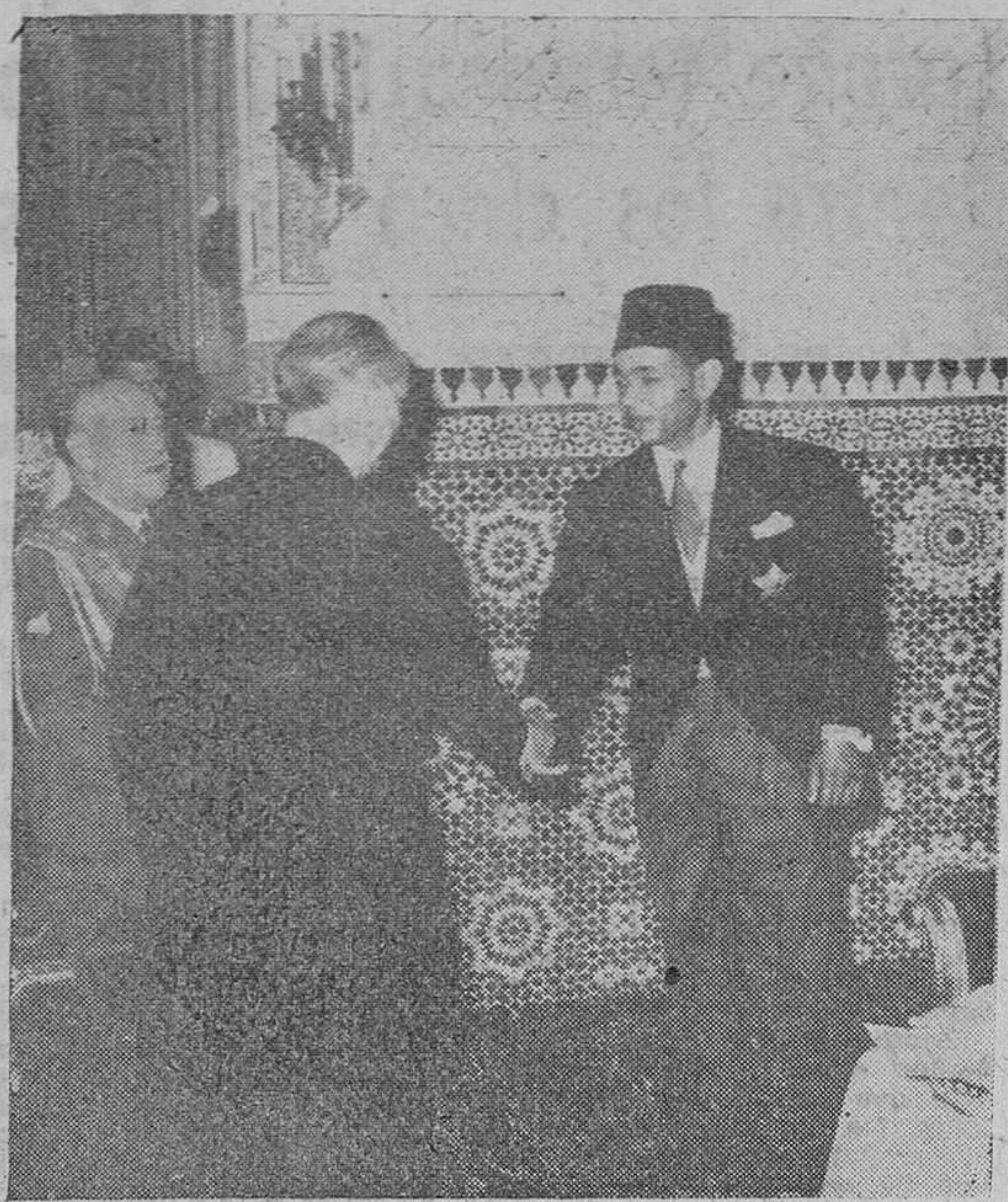
Rabat. — El embajador de España en Marruecos, Sr. Alcover, como decano del Cuerpo Diplomático, felicita al príncipe Muley Hassan con motivo de su proclamación como heredero del Trono de Marruecos. A la izquierda, el teniente general Esteban Infantes, embajador extraordinario de España en los actos de proclamación del Príncipe como heredero del trono marroquí. — (Foto Citra)