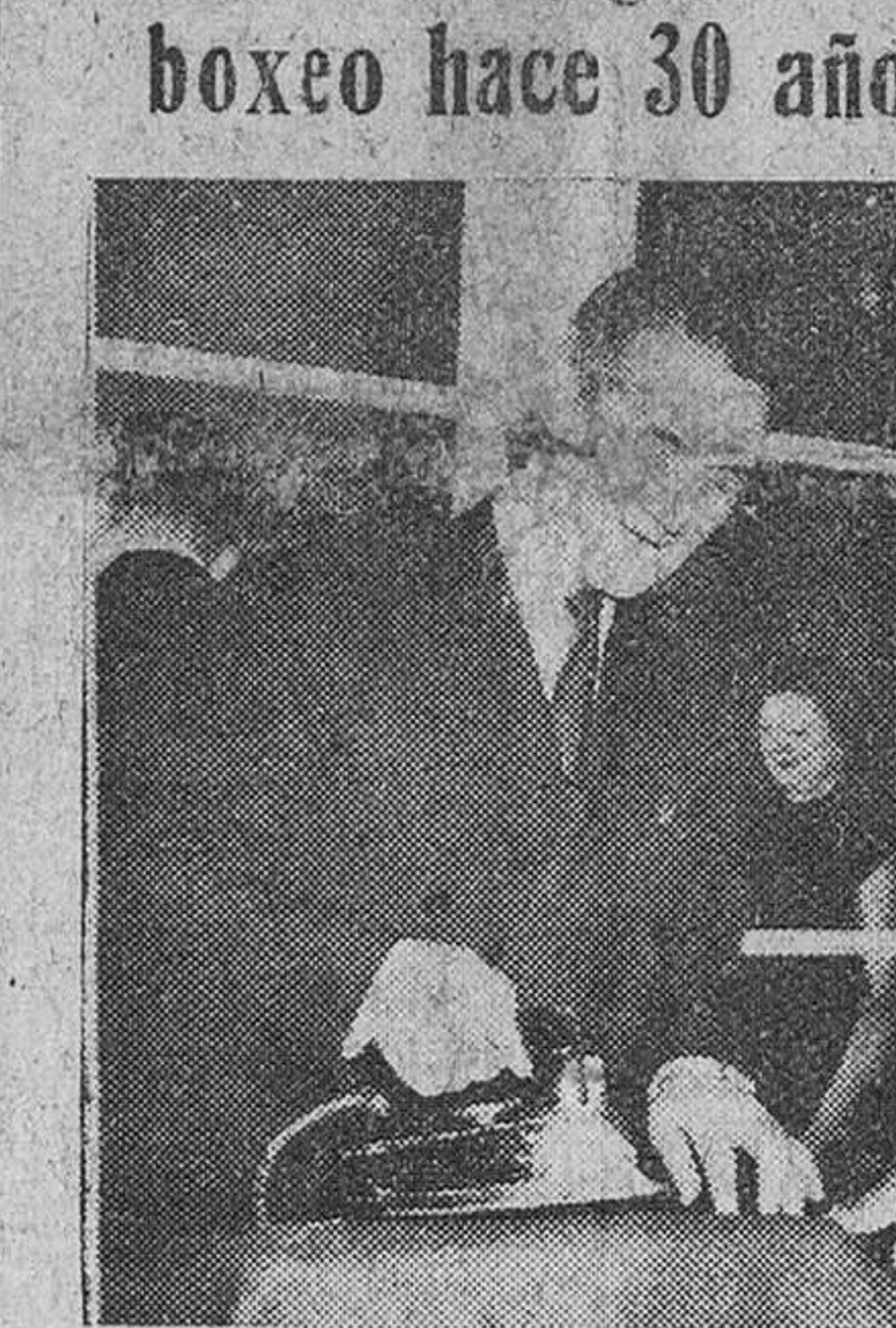
Paris.—George Carpentier, el "bello Jorge" como le llamaban cuando llegó al pínáculo de su carrera boxística, plancha una prenda salida del taller de alta costura que ha abierto en la calle Duphot, en el distrito Madeleine.