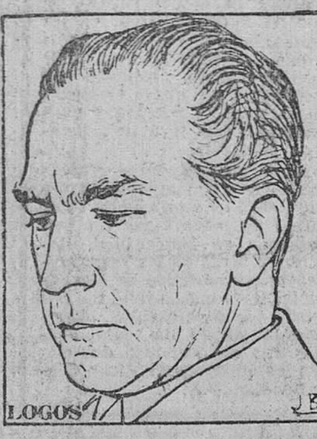
Don Alberto Ullastres Calvo, ministro de Comercio del Gobierno español

Presidió en representación del jefe del Estado la solemne inauguración de la Feria Internacional de Muestras de Barcelona