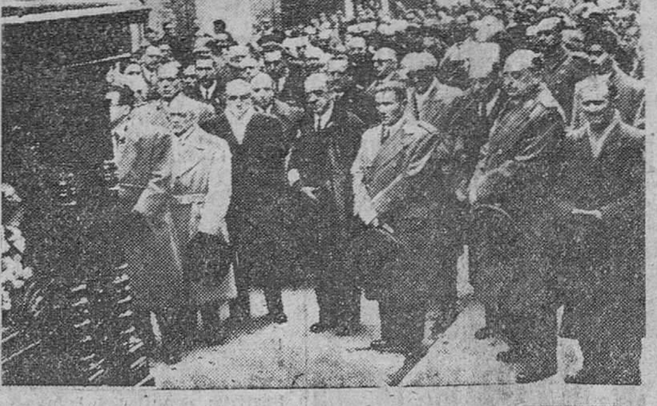
Madrid. — Los ministros del Aire y de la Marina, con otras numerosas personalidades, presiden el duelo en la conducción de los restos mortales de las víctimas del reciente accidente de avión sufrido por un "Junker".