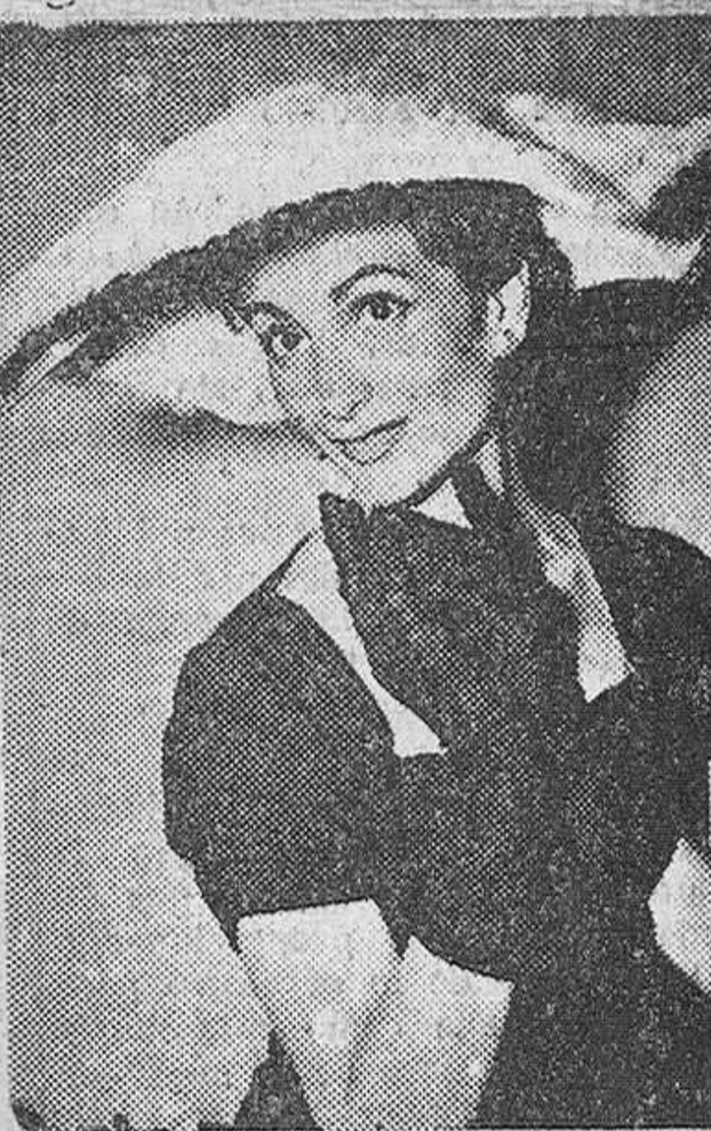
París. — El sombrero ancho siempre ha tenido éxito. He aquí uno de melusine, en tono blanco-azulado, de la firma Maud.