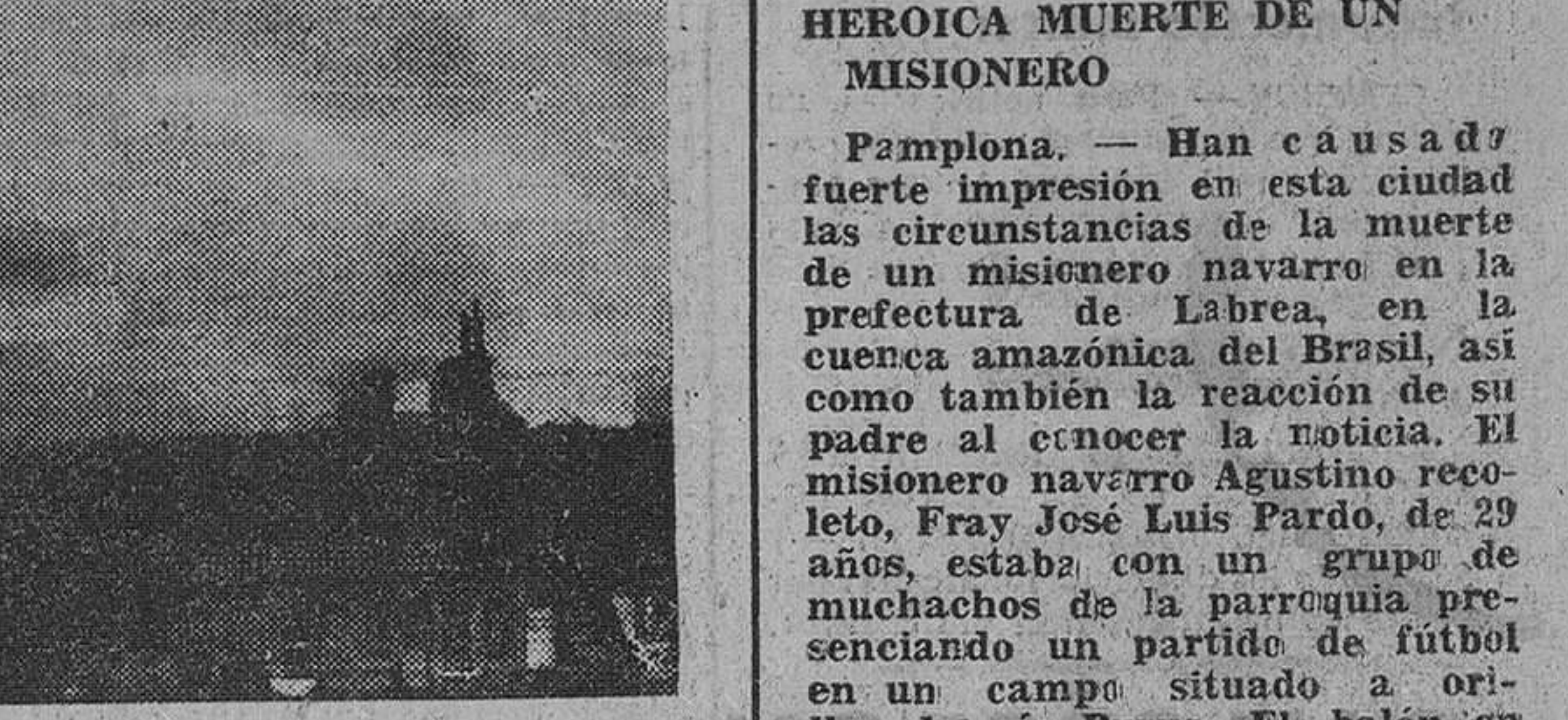
Valladolid. — Un aspecto del incendio producido en tres casas de la Avenida del Generalísimo de esta capital. Los vecinos hubieron de desalojarlas inmediatamente, llevándose a toda prisa los efectos de más valor.