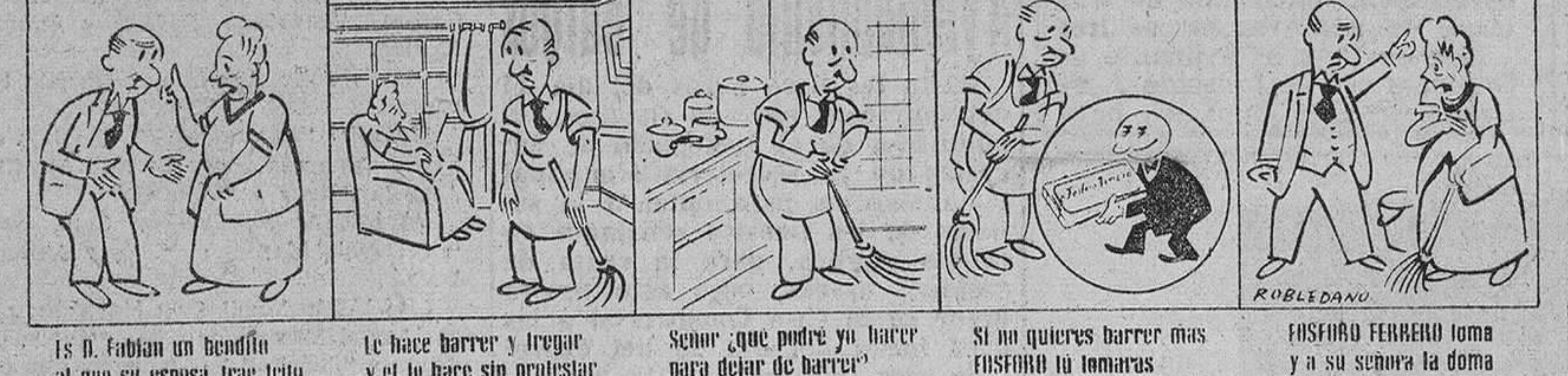
Is. si fibian un bendito al que su esposa trae trito. Le hace barrer y limpiar y el lo hace sin protestar. Soñar que padre y madre para dejar de barrer. Si no quieres barrer más FOSFORO le ilumina. FOSFORO FERRERO toma a su esposa la doma.