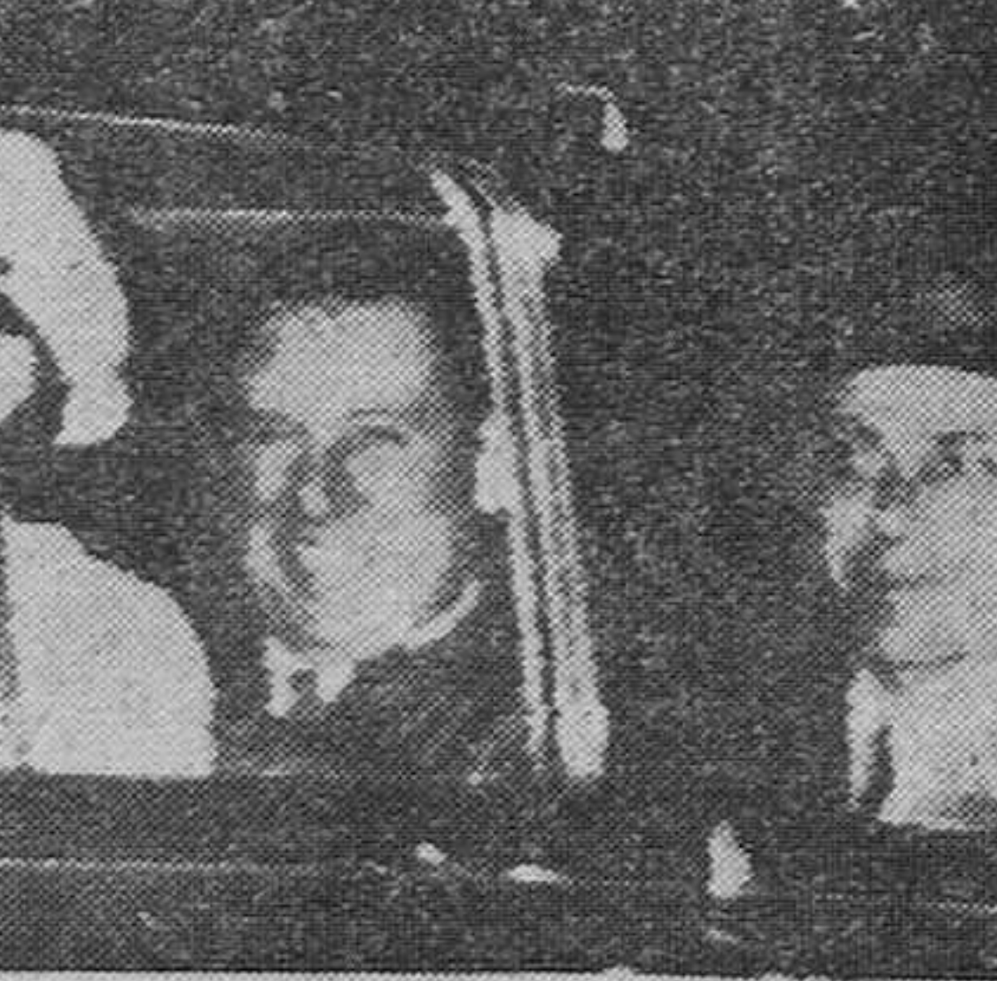
La Asunción (Paraguay). — El ex-presidente de la Argentina, Juan Domingo Perón, fotografiado en el automóvil que le trasladó desde el aeropuerto a la capital paraguaya. Le acompañan los miembros de su guardia personal.