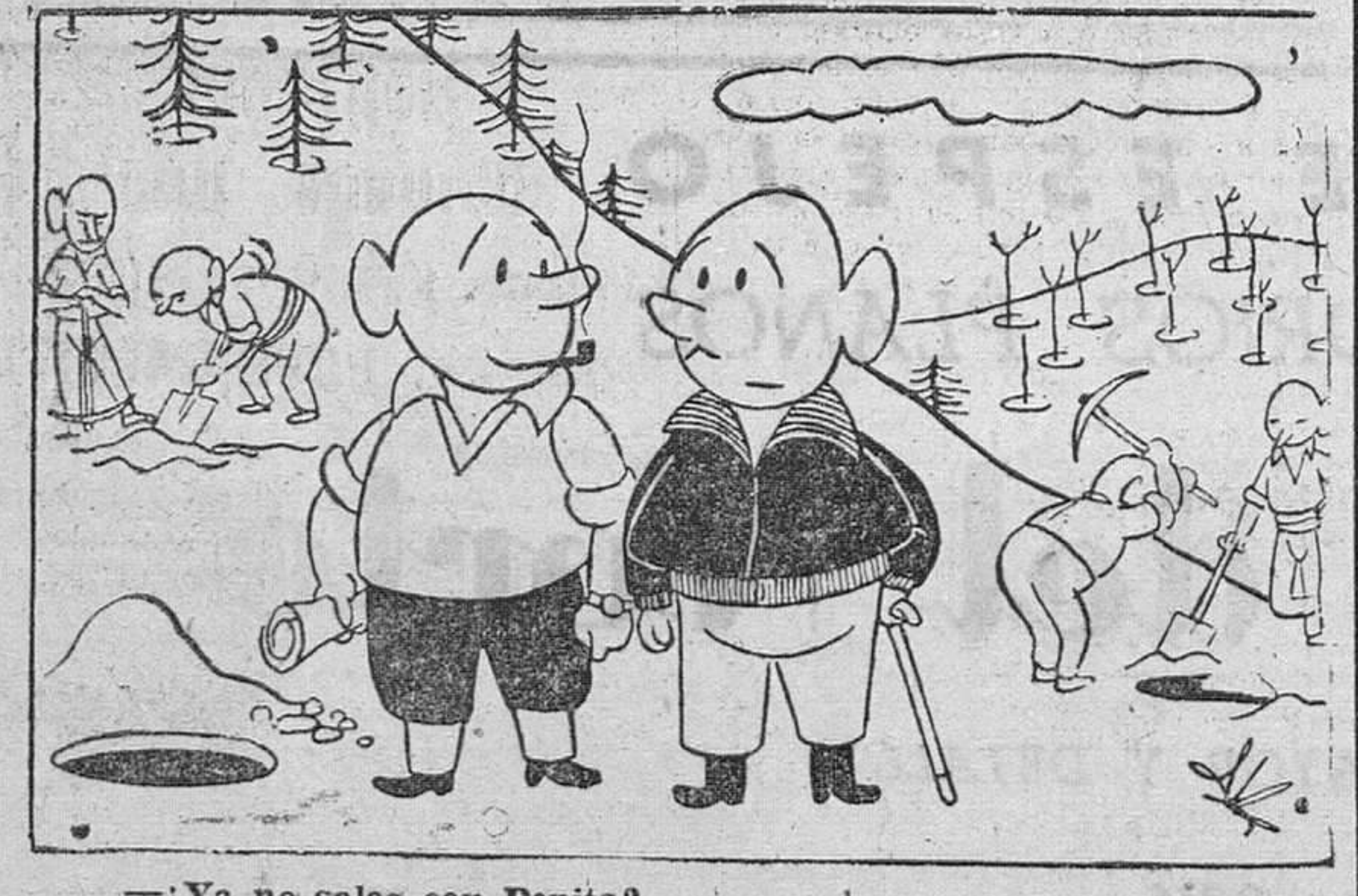
—Ya no sales con Pepita? —No; me ha plantado.