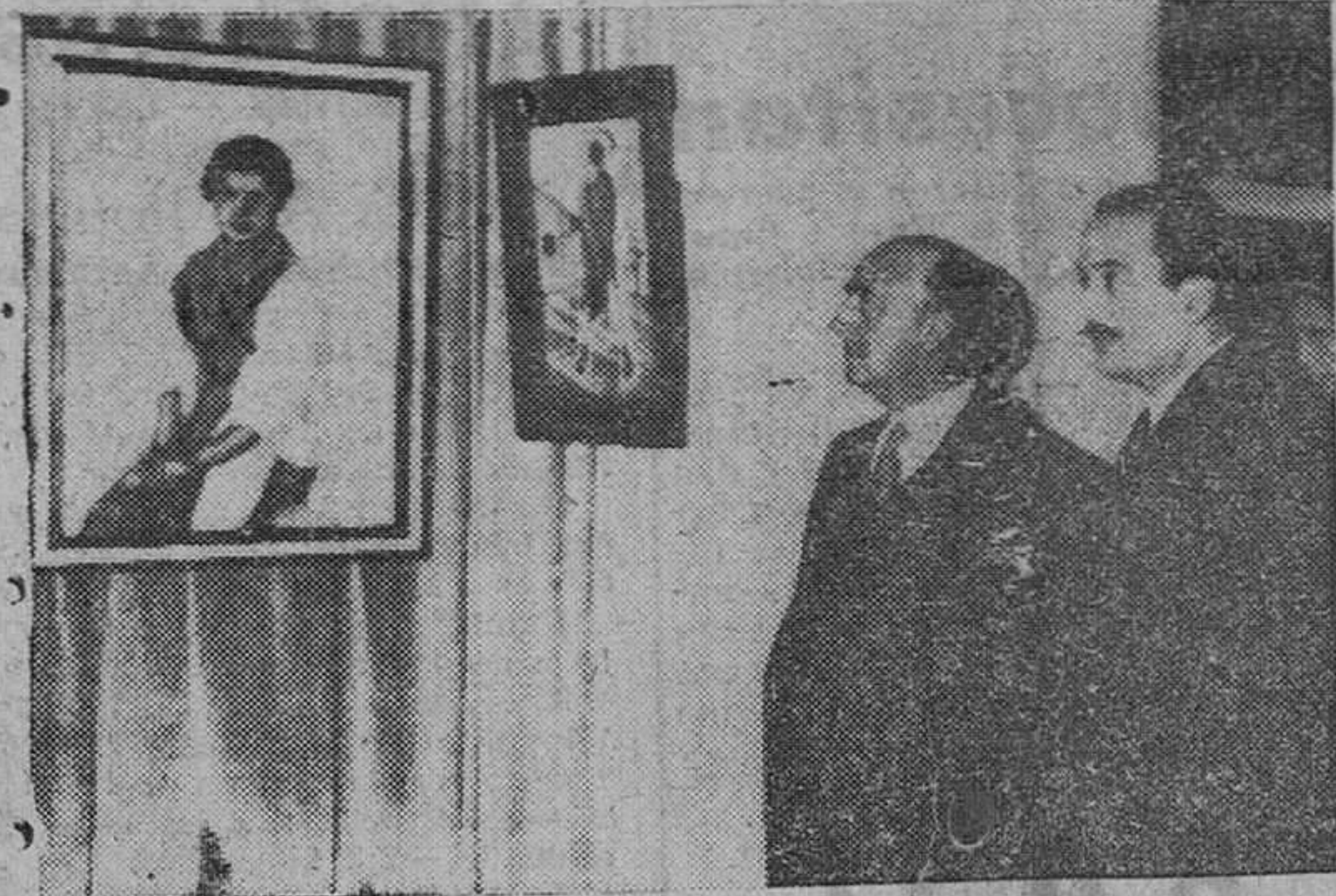
Barcelona. — S. E. el jefe del Estado y las personalidades de su séquito durante su visita a la III Biera de Arte Hispano-Americano, que se celebra en el Palacio de Exposiciones de Montjuich.