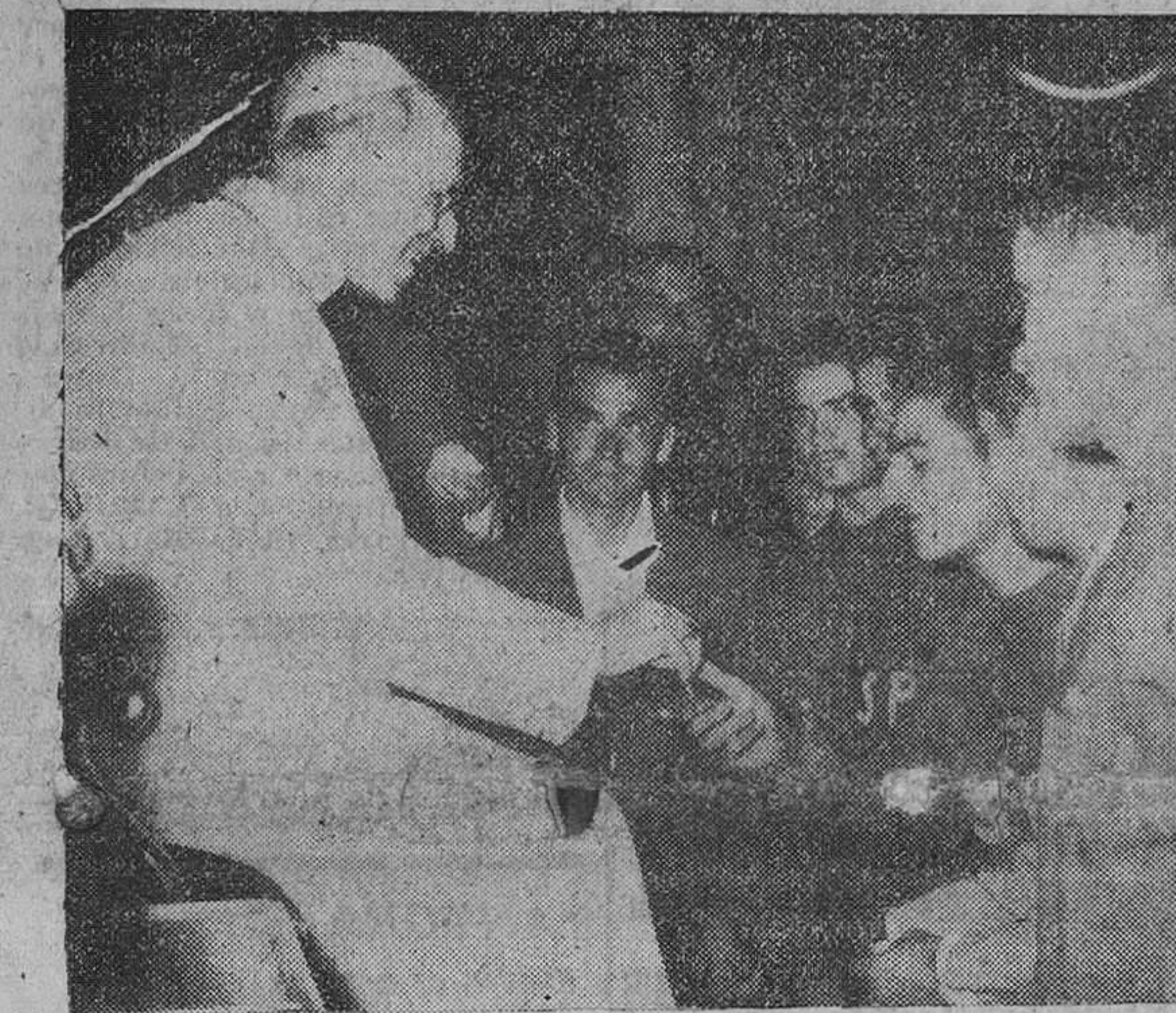
Roma.—Su Santidad el Papa, Pío XII, durante la audiencia concedida a los ciclistas españoles que han participado en el Campeonato del Mundo. En la foto, conversa con los componentes del equipo aficionado. Al fondo, el profesional Botella.