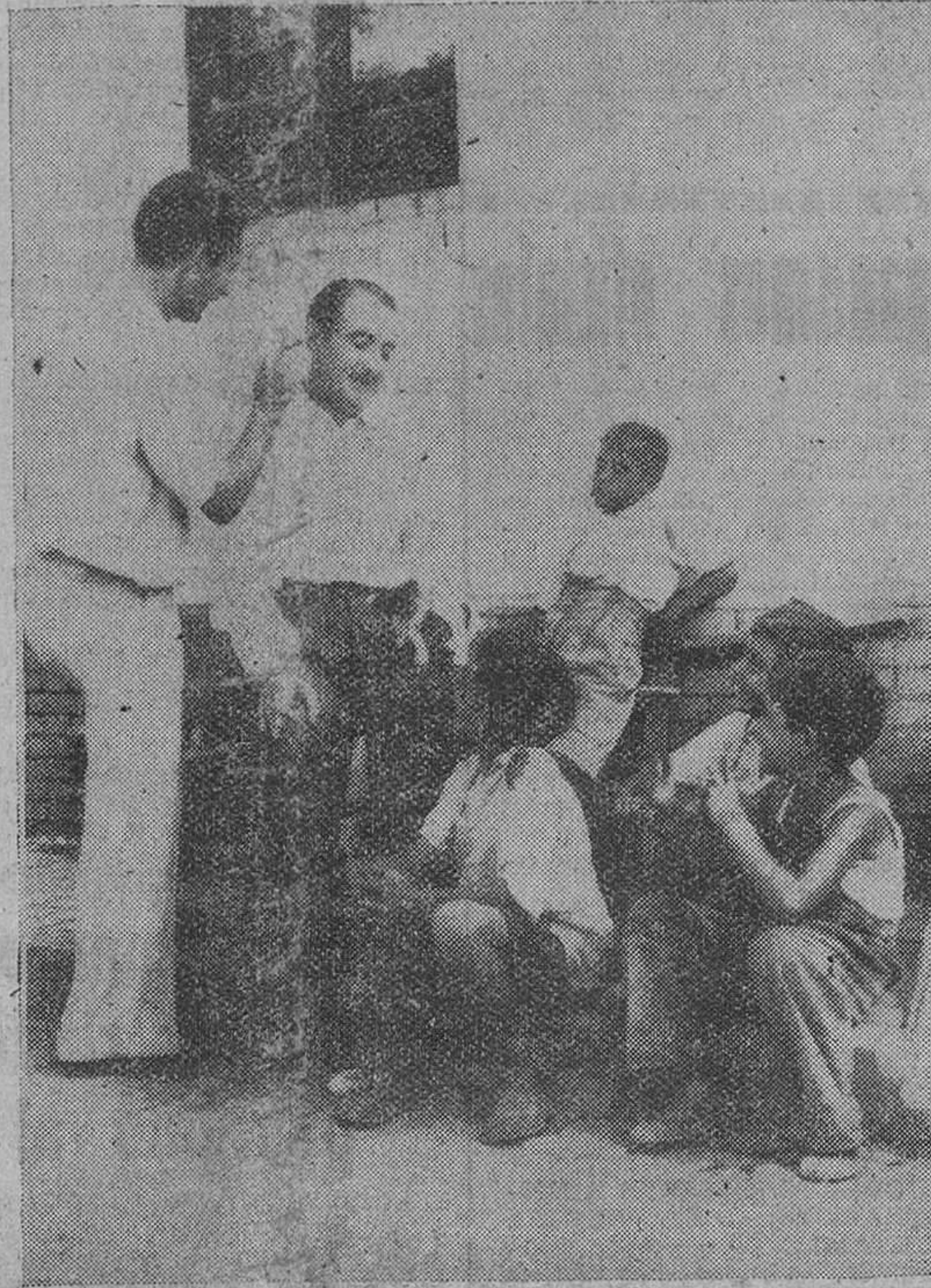
Nuevamente el actor cinematográfico Clifton Webb, que actualmente se halla rodando en esta capital la película "The Man Who Never Was", admirado por un grupo de niños onubenses mientras es maquillado.