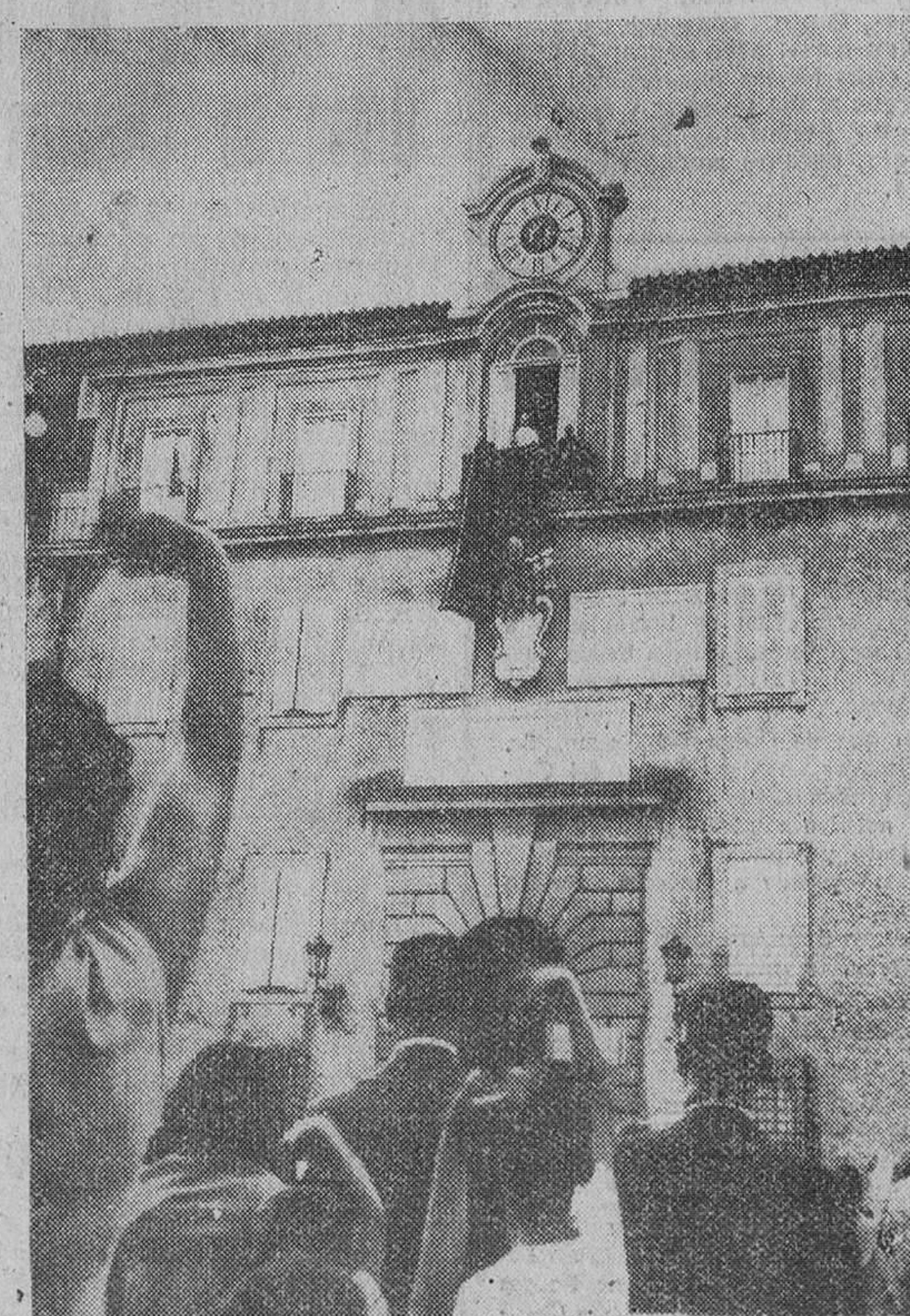
Castelgandolfo. Su Santidad el Papa recibe el homenaje de la muchedumbre que se congregó ante el Palacio Pontificio, su residencia de verano, a su llegada.