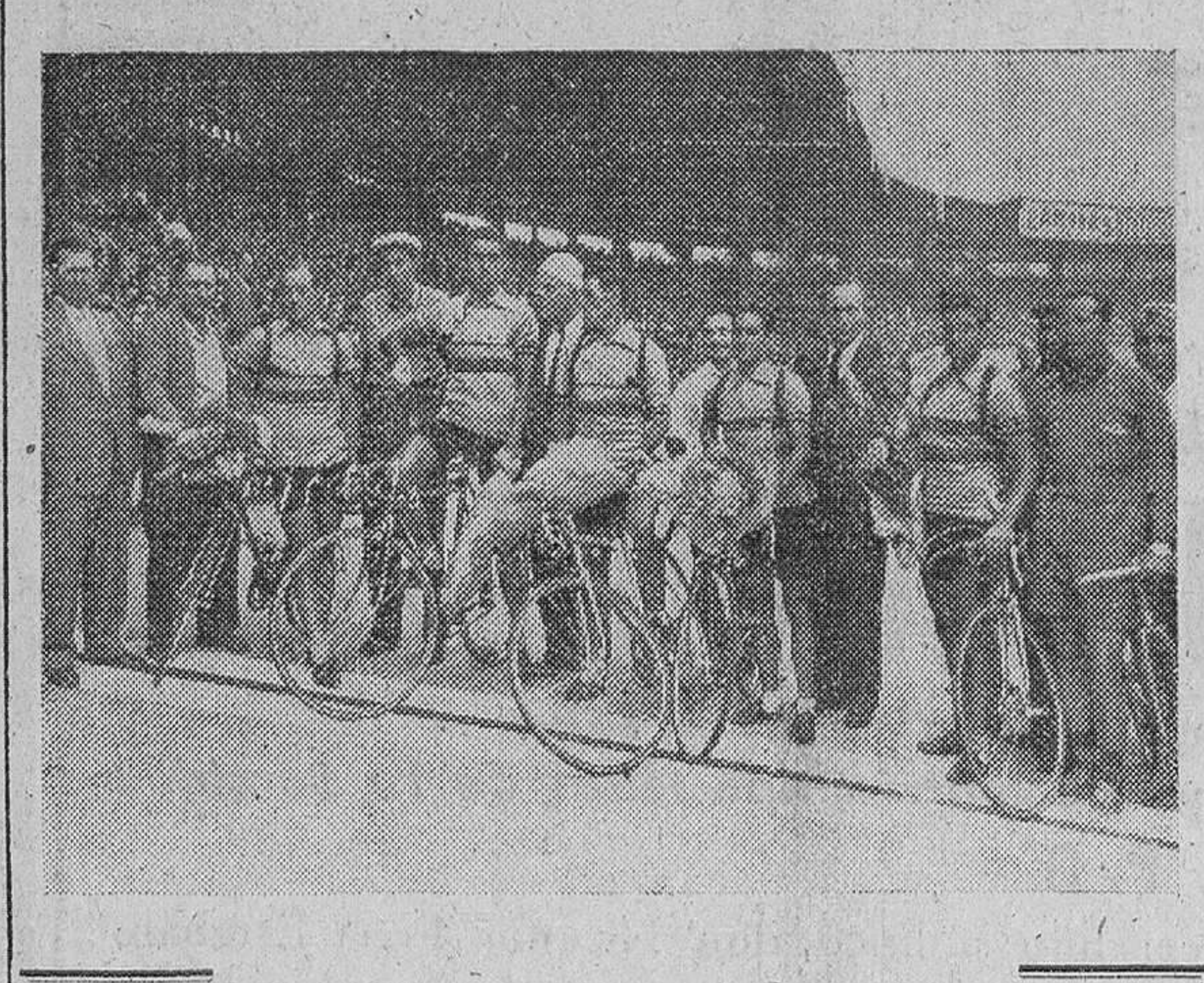
Paris. — Los "supervivientes" del equipo ciclista español que han terminado la Vuelta a Francia, fotografiados junto al embajador de España, Conde de Casas Rojas, en el velódromo del Parque de los Príncipes.