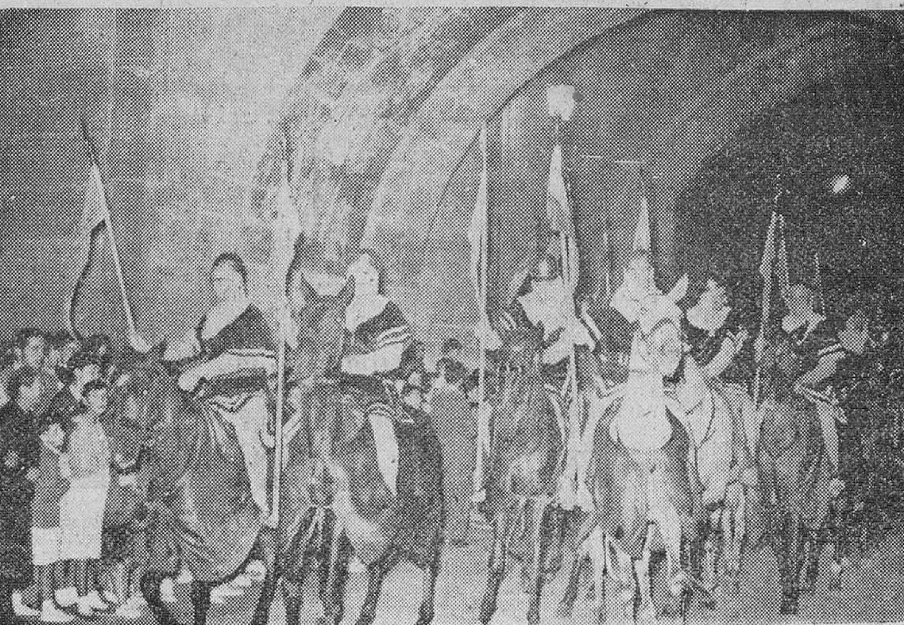
Se celebró ayer la ciudad la anunciada cabalgada cívica, de la cual "Fede" obtuvo las precedentes "fotos". En la primera aparece el pendón con las armas del Cid y en la segunda el paso del cortejo bajo el Arco de Santa María.