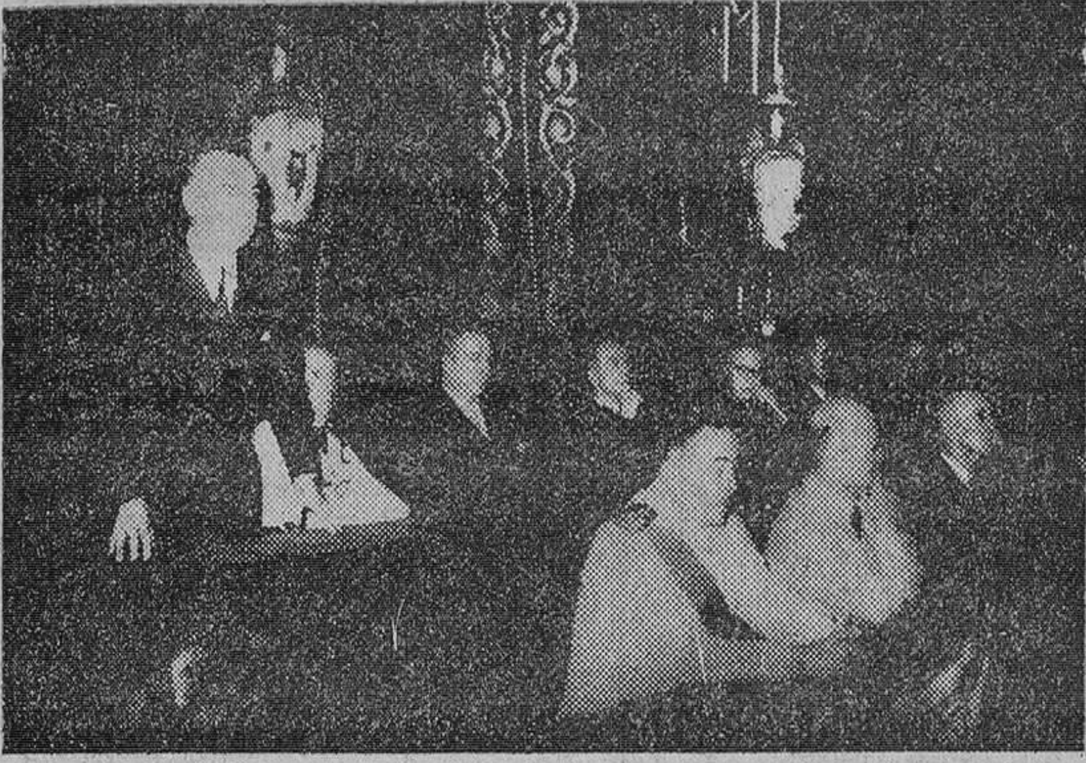
San Sebastián. — El presidente de la Diputación durante su discurso de apertura del ciclo de Conversaciones Católicas en el Palacio de la Corporación, bajo la presidencia del ministro de Asuntos Exteriores, Nuncio de S. S. Monseñor Antoniutti y otras autoridades.