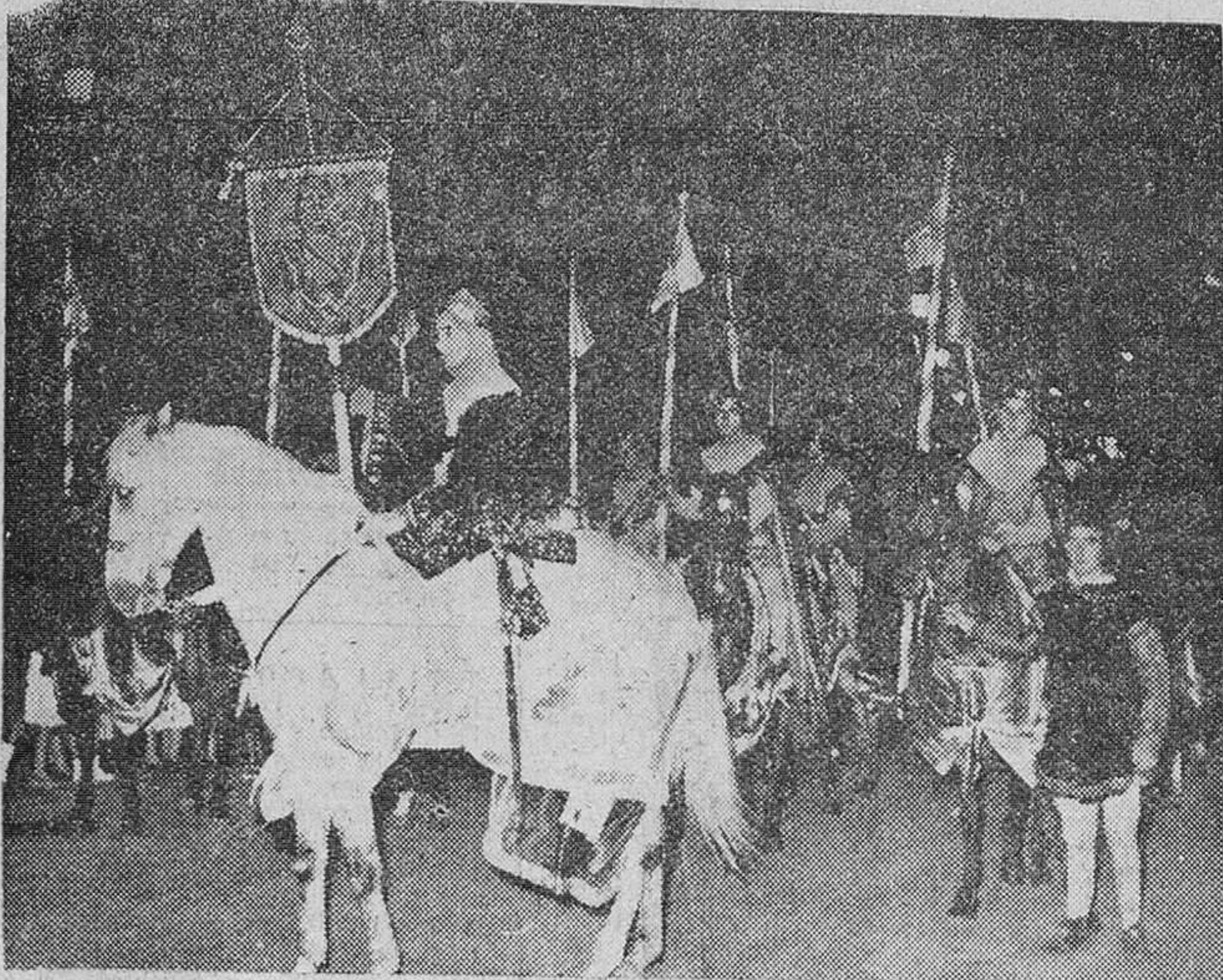
Se celebró ayer la ciudad la anunciada cabalgada cívica, de la cual "Fede" obtuvo las precedentes "fotos". En la primera aparece el pendón con las armas del Cid y en la segunda el paso del cortejo bajo el Arco de Santa María.