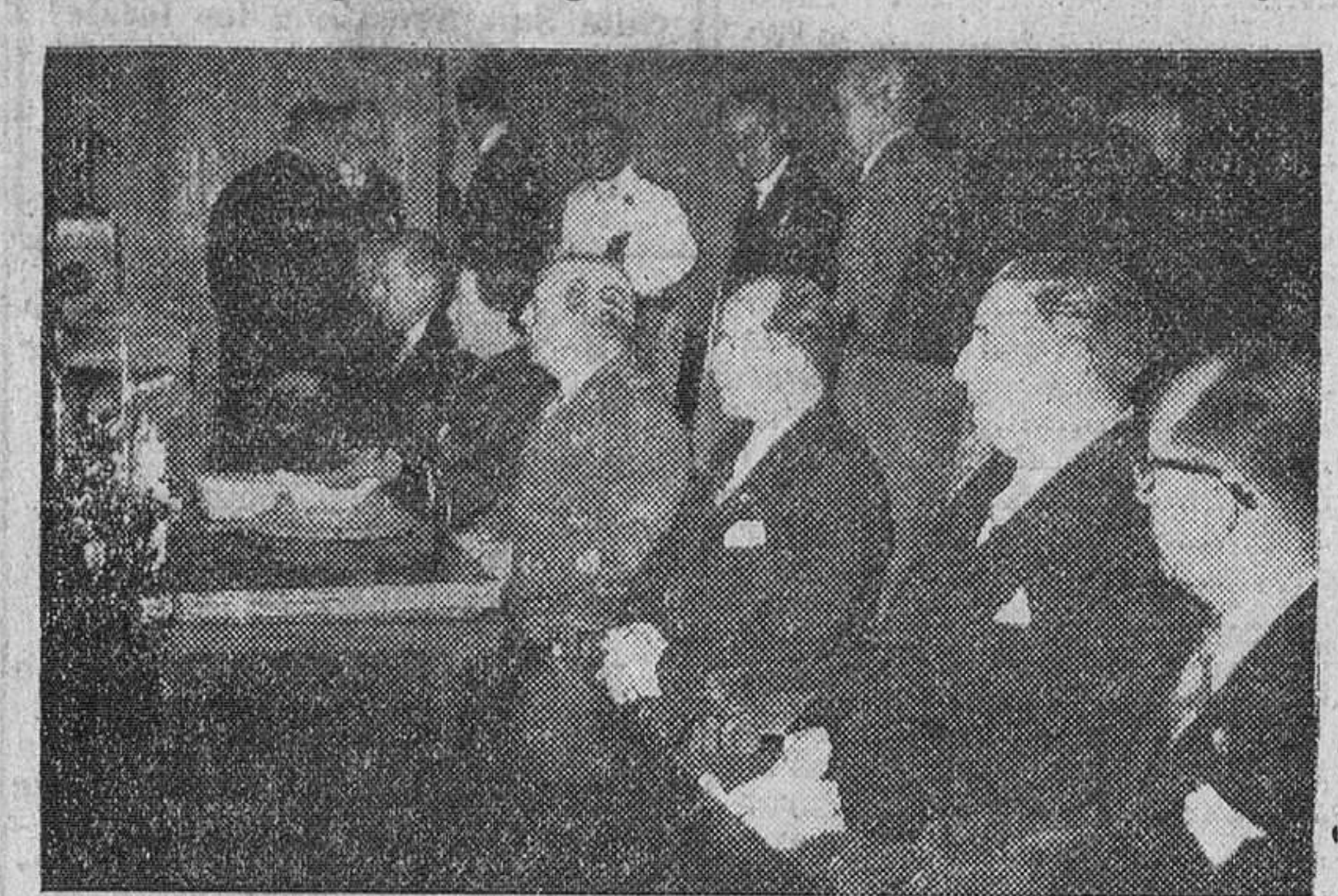
Madrid.—Un momento de la solemne sesión de clausura del I Congreso Iberoamericano de Municipios, presidida por Su Excelencia el Jefe del Estado español.—(Foto Cifra)