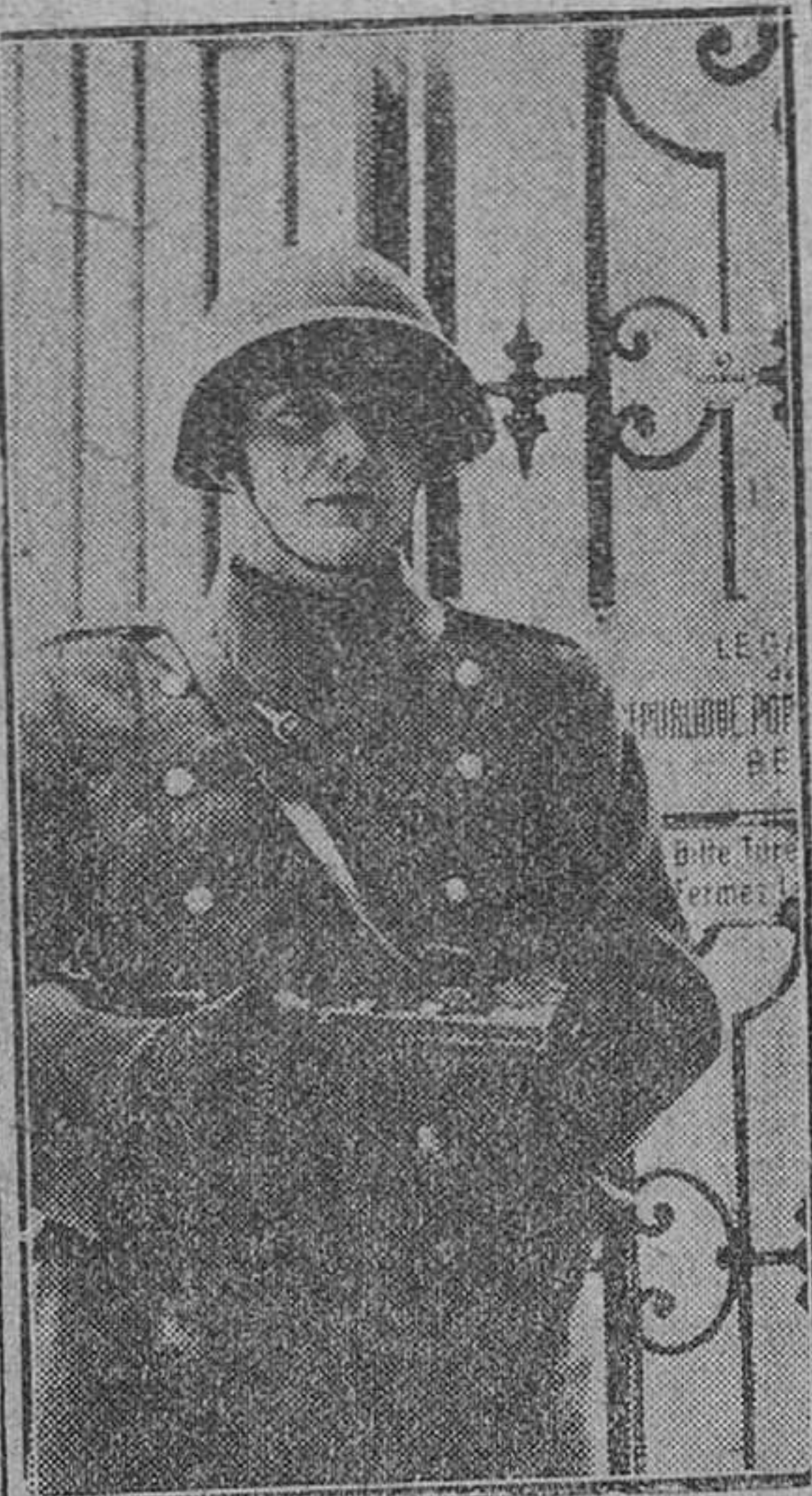
Berna. — Un miembro de la Policía suiza, presta servicio de vigilancia a la puerta de la Legación rumana en esta ciudad, que fue asaltada días pasados por tres rumanos anticomunistas.