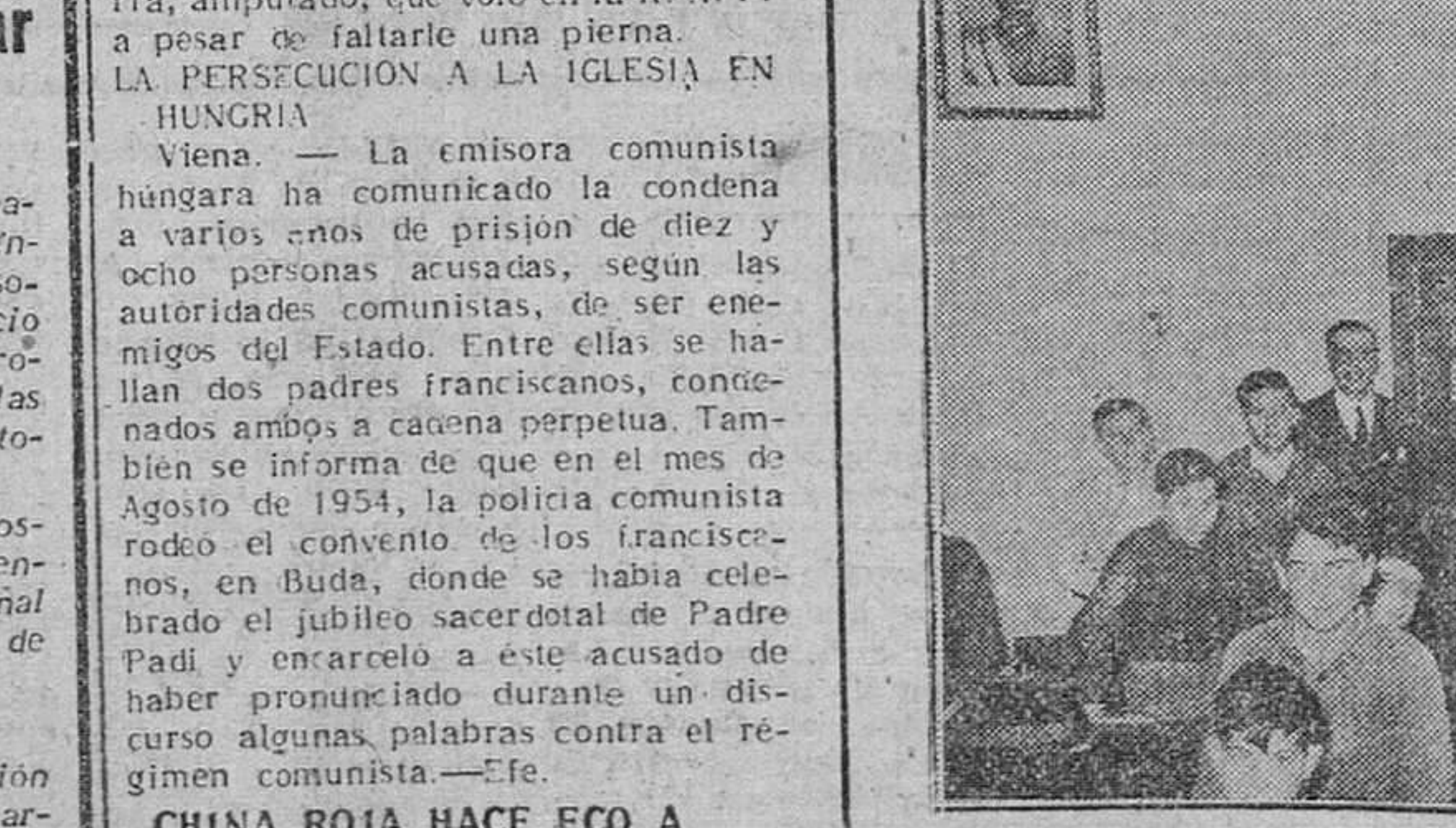
Antequera.—El ministro de Hacienda, Sr. Gómez de Llano, acompañado de su esposa, durante su visita a las escuelas de San Francisco Javier, fundadas por los hermanos Muñoz Rojas.