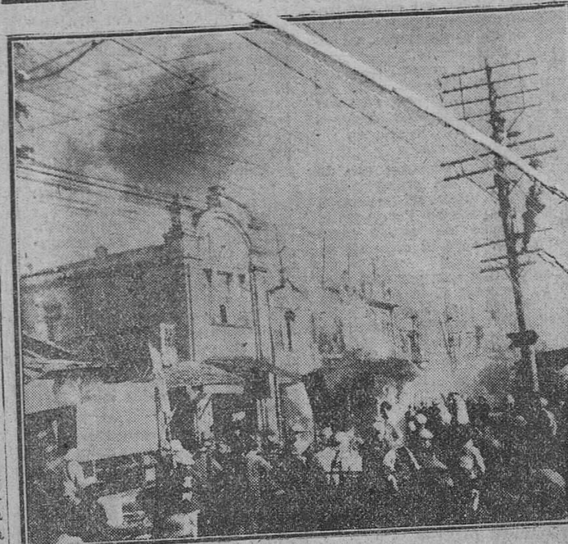
Fuchow (China comunista). — Una brigada de voluntarios se apresura a reparar los desperfectos y a sofocar los incendios ocasionados por el bombardeo llevado a cabo por aviones chinos nacionalistas. Esta es la primera fotografía (tal vez dada a nacionalistas. Esta es la primera fotografía que ha sido autorizada por las autoridades comunistas, y que nos llega vía Pekín-Londres.

París. — A pesar de la actitud abstencionista adoptada por el M. R. P., Pinay parece dispuesto a continuar sus gestiones para formar Gobierno. Después de visitar al presidente de la República anunció que esta tarde comenzará a buscar colaboradores y que el viernes por la mañana se presentará en la Asamblea Nacional para pedir su aprobación.—Efe.