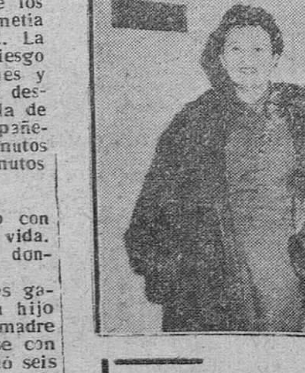
Nueva York. — El popular actor cinematográfico Fredric March, acompañado de su esposa, la actriz Florence Eldridge, a bordo del transatlántico «Cristóforo Colombo», rumbo a España, donde tomará parte en el rodaje de la película «Alejandro Magno».