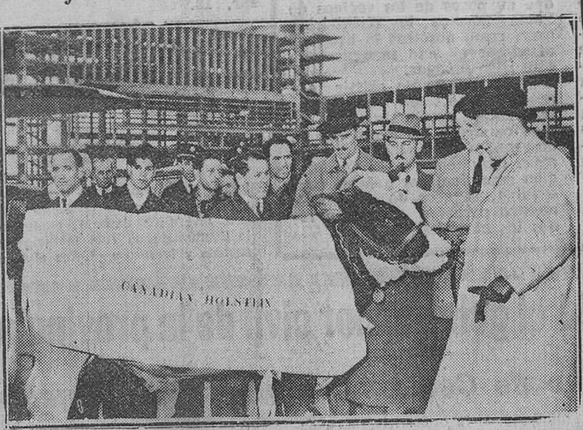
Madrid. — La fotografía recoge un momento del desembarque de ocho escogidos toros entre las reses más productoras de las vacadas holandesas Holstein-Friesian, del Canadá, llegados a Barajas por vía aérea, con el fin de mejorar las razas bovinas españolas. Estuvieron presentes en el acto, el director general de Ganadería, embajador del Canadá y otras personalidades.

La comisión investigadora panamericana confirma que la mayoría de las fuerzas invasoras de Costa Rica proceden de Nicaragua