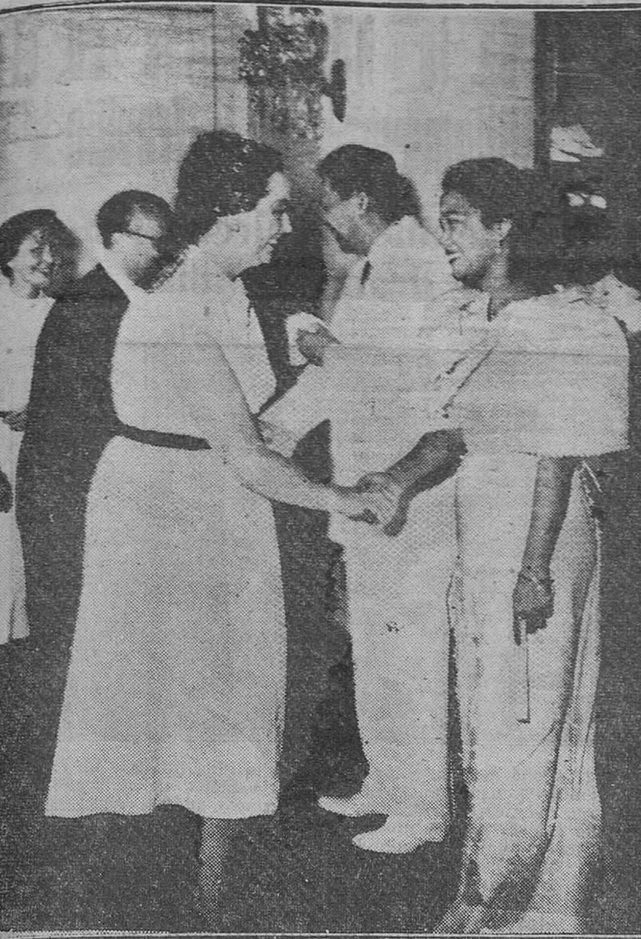
Manila. — Los embajadores de España en Manila felicitan a la señora de Magsaysay y a S. E. el presidente de la República, con ocasión del día 1.º de año. — (Foto Cifra)