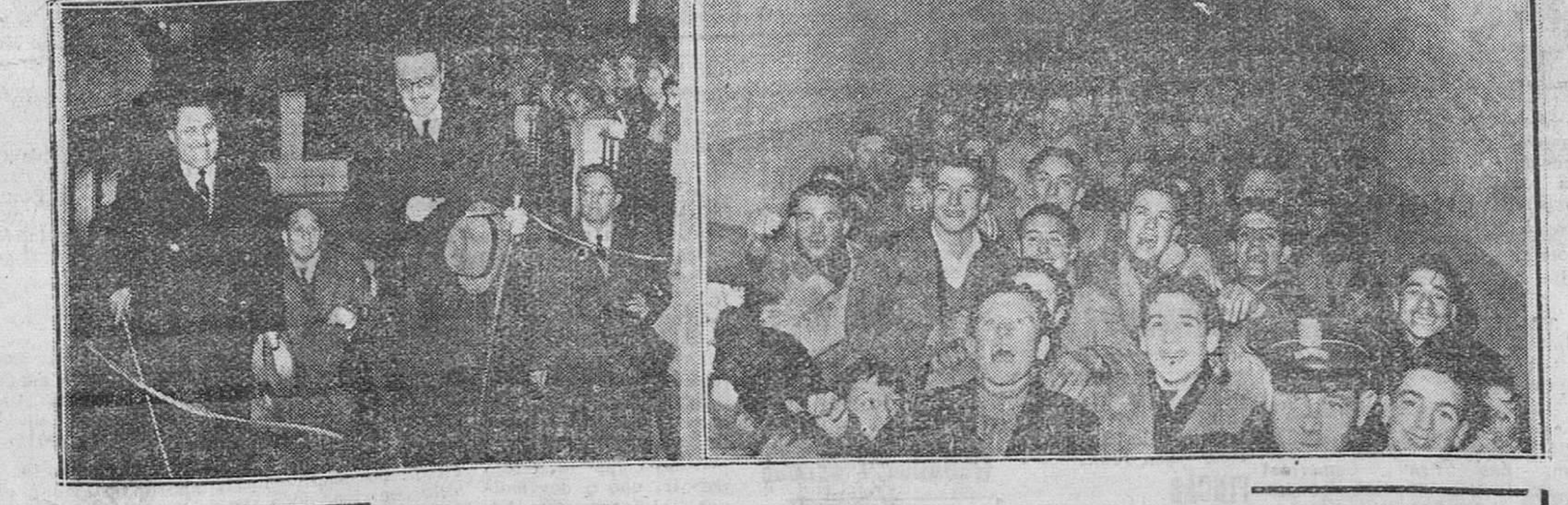
Por fin! He aquí el grito alborozado que lanzaron ayer los vecinos de la zona de Santa Dorotea, al ver inaugurado oficialmente, en acto solemne presidido por las autoridades, el paso subterráneo bajo las vías del ferrocarril, en el mismo lugar donde una larga lista de muertes, acaecidas en el transcurso de decenas de años, había hecho archifamoso el fatídico "paso a nivel". En las fotos de "Fede" que reproducimos, aparece el alcalde cortando la cinta simbólica acompañada del gobernador civil y otras personalidades y a la derecha, el jubilo de la juventud del barrio, al atravesar por vez primera el túnel que comunica ambos lados de la calle. — (Información en cuarta página)