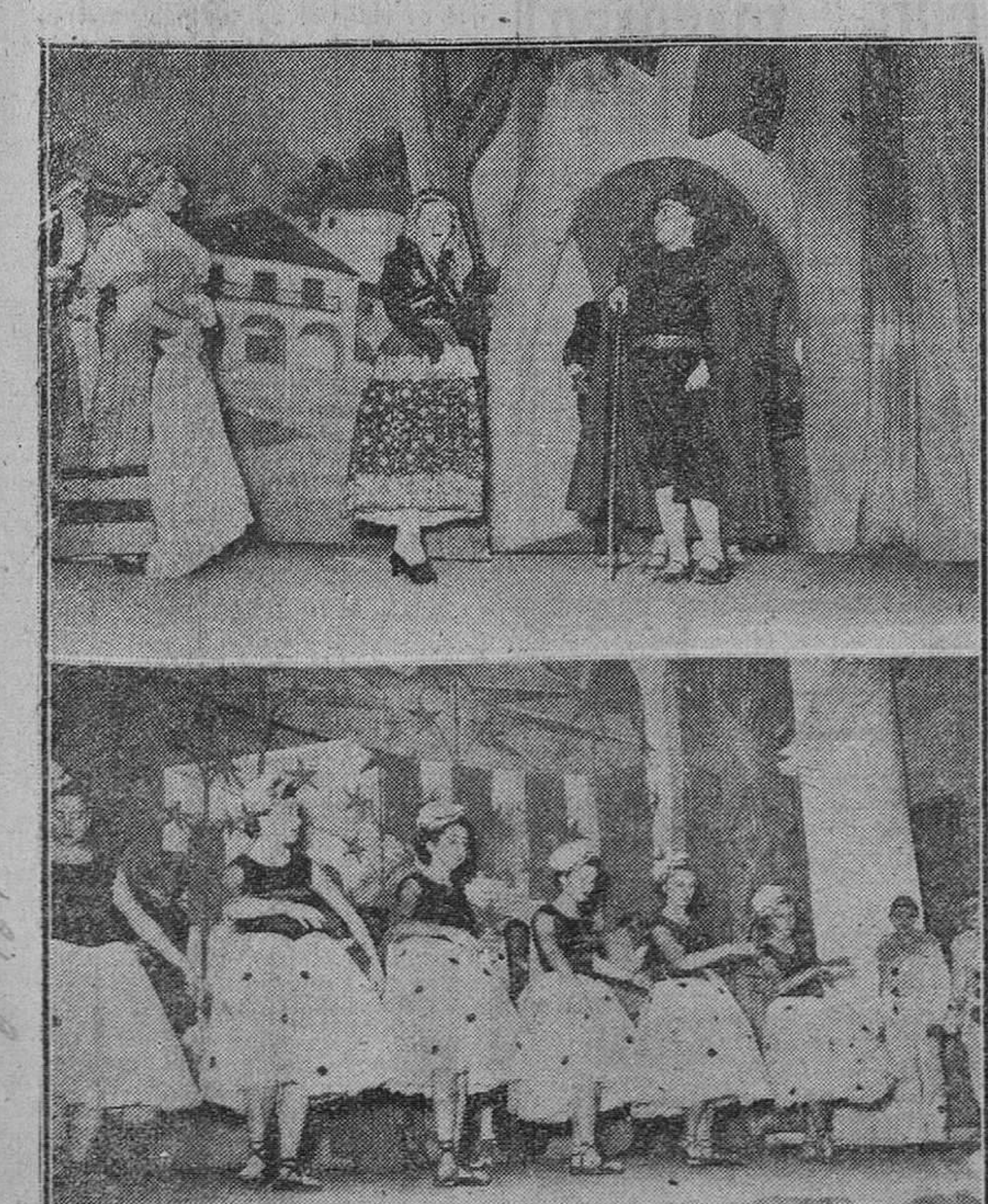
Los momentos de la representación teatral que tuvo lugar el pasado lunes en nuestra ciudad, a beneficio del Sanatorio Antituberculoso de "Fuentes Blancas" y en la que fue puesta en escena la obra de don Jacinto Benavente "...Y va de cuento".

Velada teatral a beneficio del Sanatorio de "Fuentes Blancas"