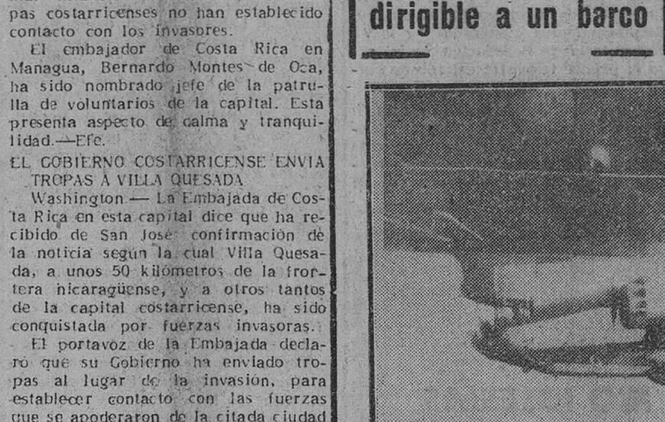
Costa de Virginia (EE. UU.). — Las fuerzas navales han efectuado una demostración de transbordo de personal, desde un dirigible a un barco. En la foto superior, el dirigible en pleno vuelo llevando en la parte derecha una barquilla con dos tripulantes que es bajada por medio de un cable hasta la cubierta del barco...