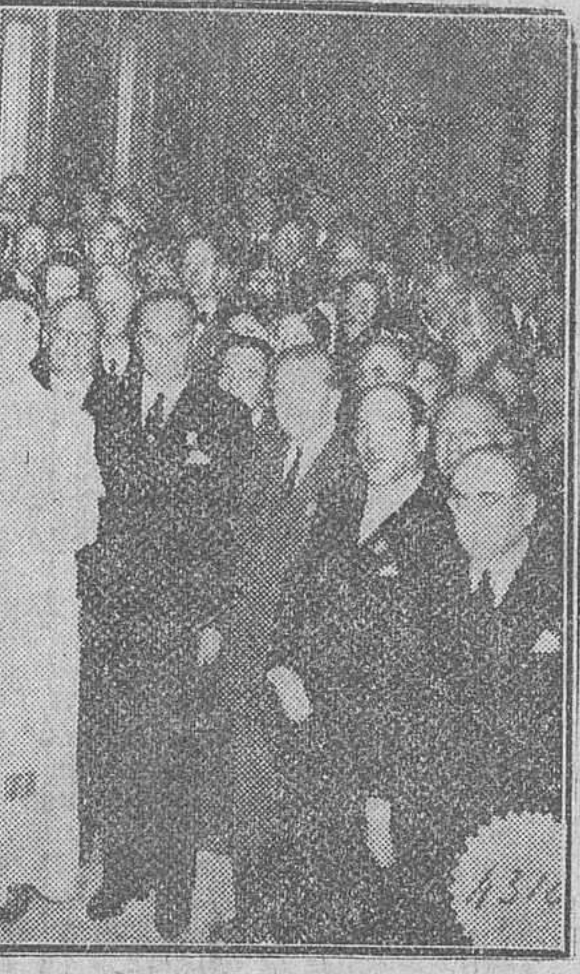
Castelgandolfo.—Su Santidad el Papa con los miembros del Congreso del Interpol, a los que recibió en audiencia en el palacio de Castelgandolfo.