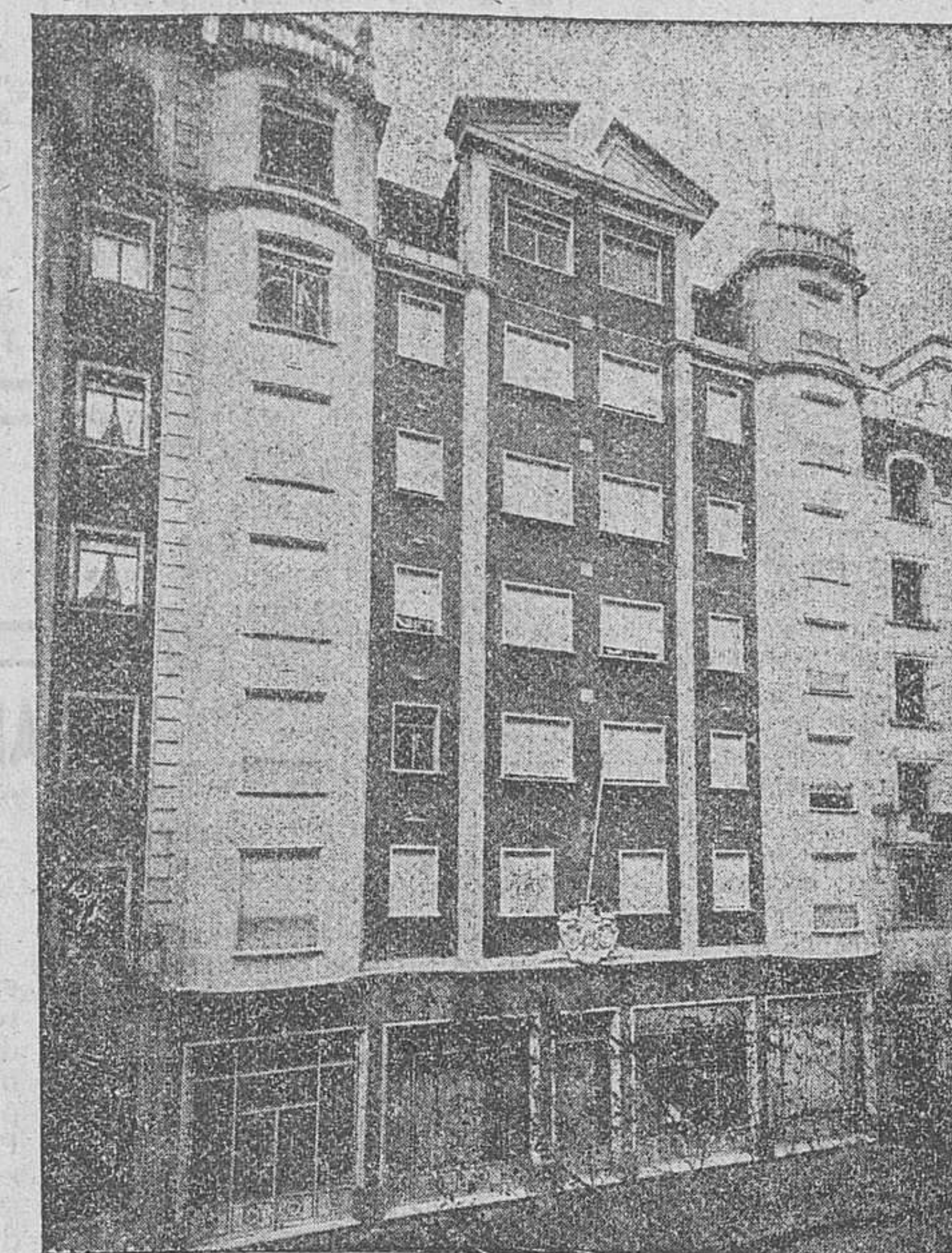
Edificio de la calle Miranda núm. 5, donde están instaladas las Oficinas Centrales de la Caja de Ahorros y Monte de Piedad del Círculo Católico de Obreros.

Esta es, a grandes rasgos, la labor meritoria y grandiosa realizada en Burgos y su provincia, por la CAJA DE AHORROS Y MONTE DE PIEDAD DEL CIRCULO CATOLICO DE OBREROS, entidad benemérita, que cuenta y ha contado siempre con la simpatía y favor general del público y que hoy, como lo hizo siempre, continúa su marcha ascendente, bajo la inteligente guía de su Consejo de Gobierno.