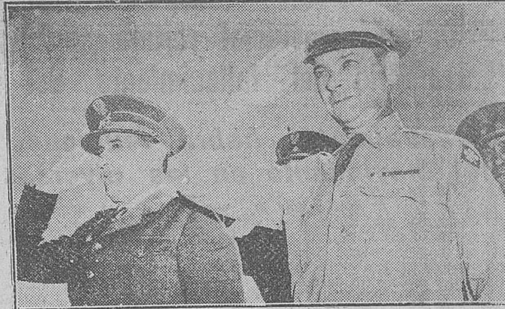
Fort Sill (Oklahoma). — El teniente general Muñoz Grandes durante su visita al centro de Artillería del Ejército en esta localidad, acompañado de uno de los jefes del mismo. Se le recibió con una salva de ordenanza de diecinueve cañonazos.

Ruiz Giménez se entrevista con el presidente ecuatoriano