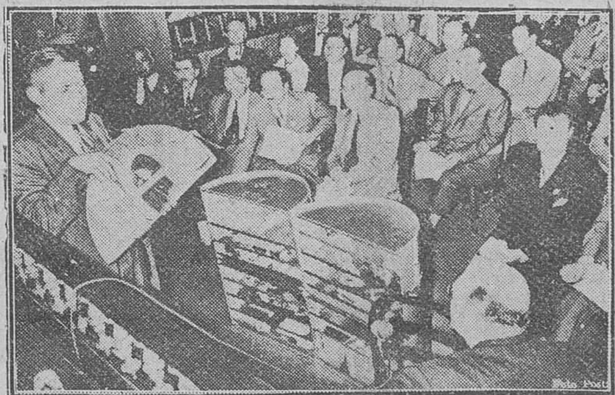
Barcelona. — Un grupo de hombres norteamericanos pertenecientes a la "Asociación nacional de directores de ventas" han estado en Barcelona, donde han explicado los procedimientos de venta empleados en los Estados Unidos. Esta fotografía muestra al orador explicando lo que ellos llaman "el barril mágico". Es un muestrario que contiene todos los productos que se obtienen mediante procesos químicos del petróleo y sus derivados. En este barril caben más de un centenar de muestras.