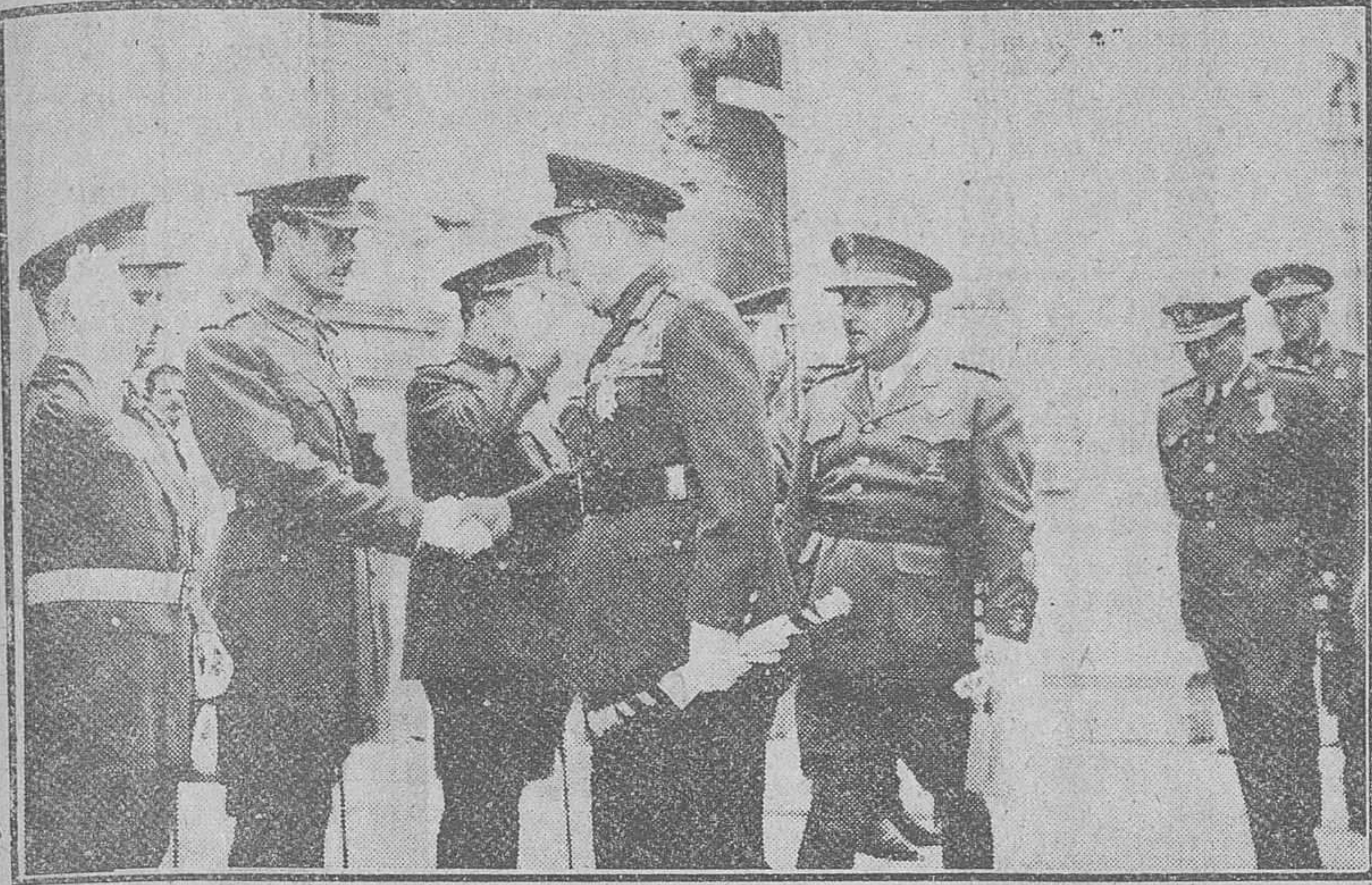
Toledo. — El mariscal Papagos, acompañado de S. E. el jefe del Estado, estrecha la mano de los jefes y oficiales de guarnición en esta plaza que acudieron a recibir a las citadas personalidades con motivo de su visita al Alcázar toledano.