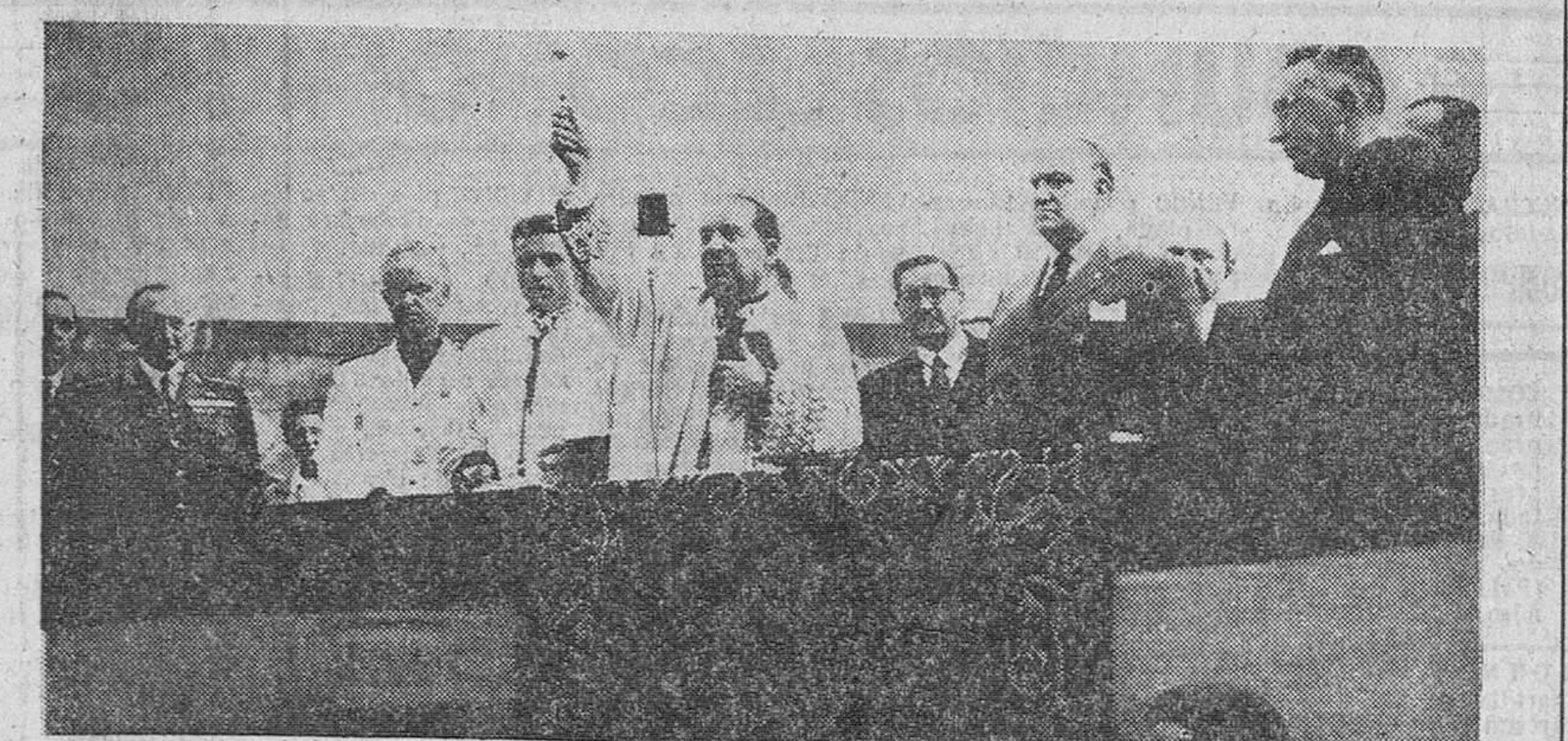
Portugal. — El ministro de Obras Públicas en la inauguración y bendición de los depósitos de agua para sesenta mil metros cúbicos, con los que se solucionará el grave problema que tenía dicha zona.