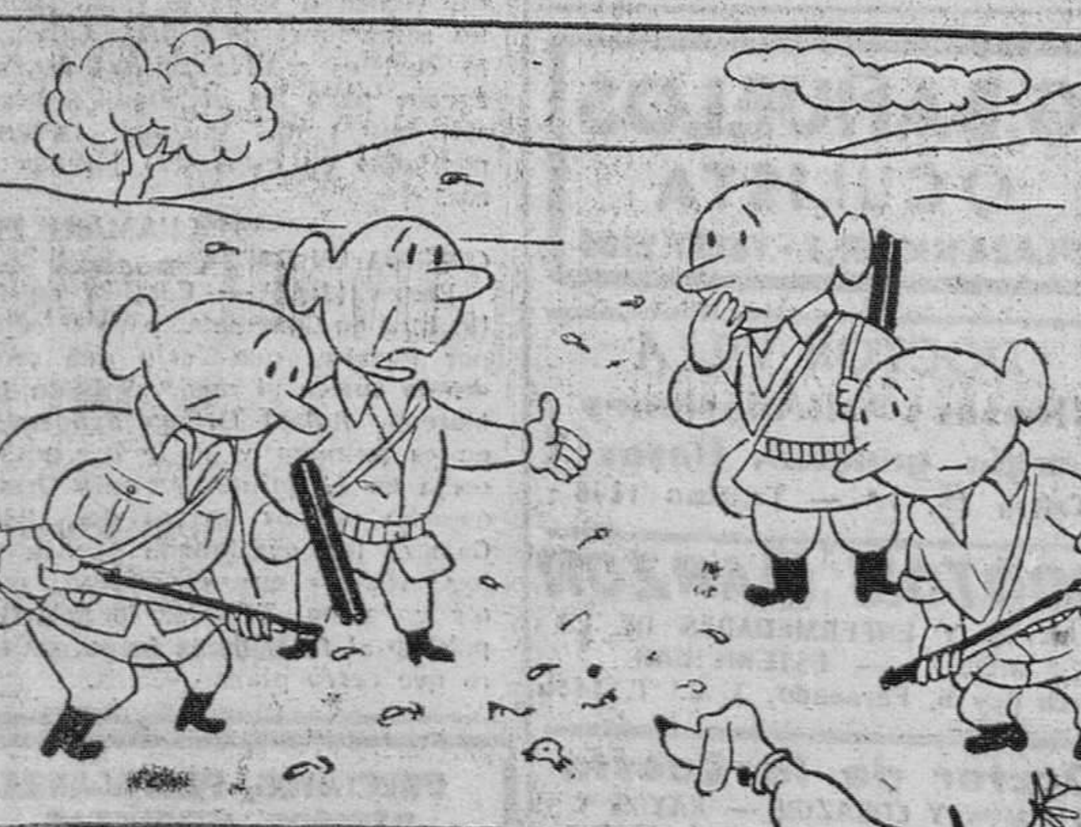
Bueno, señores; a ver si no disparamos todos sobre la misma pieza!