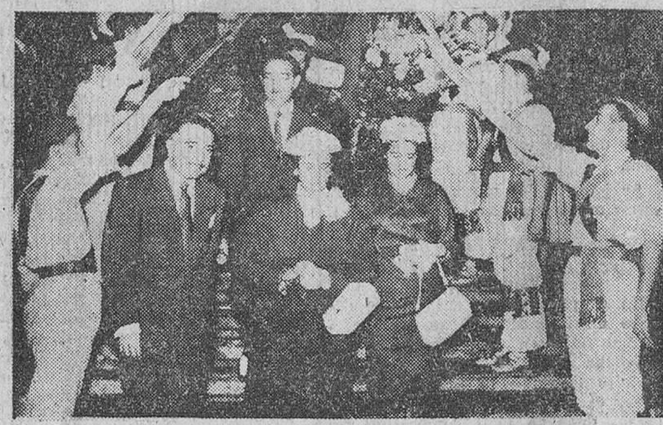
San Sebastián. — La esposa de S. E. el Jefe del Estado, doña Carmen Polo de Franco, acompañada del gobernador civil, alcalde y otras personalidades, a su llegada a la exposición de pinturas organizada por Educación y Descenso.