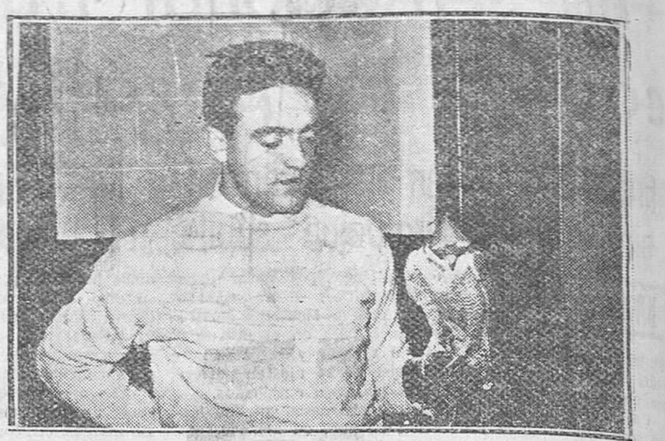
El médico burgalés, don Félix Rodríguez de la Fuente, con un halcón peregrino, en sus manos.