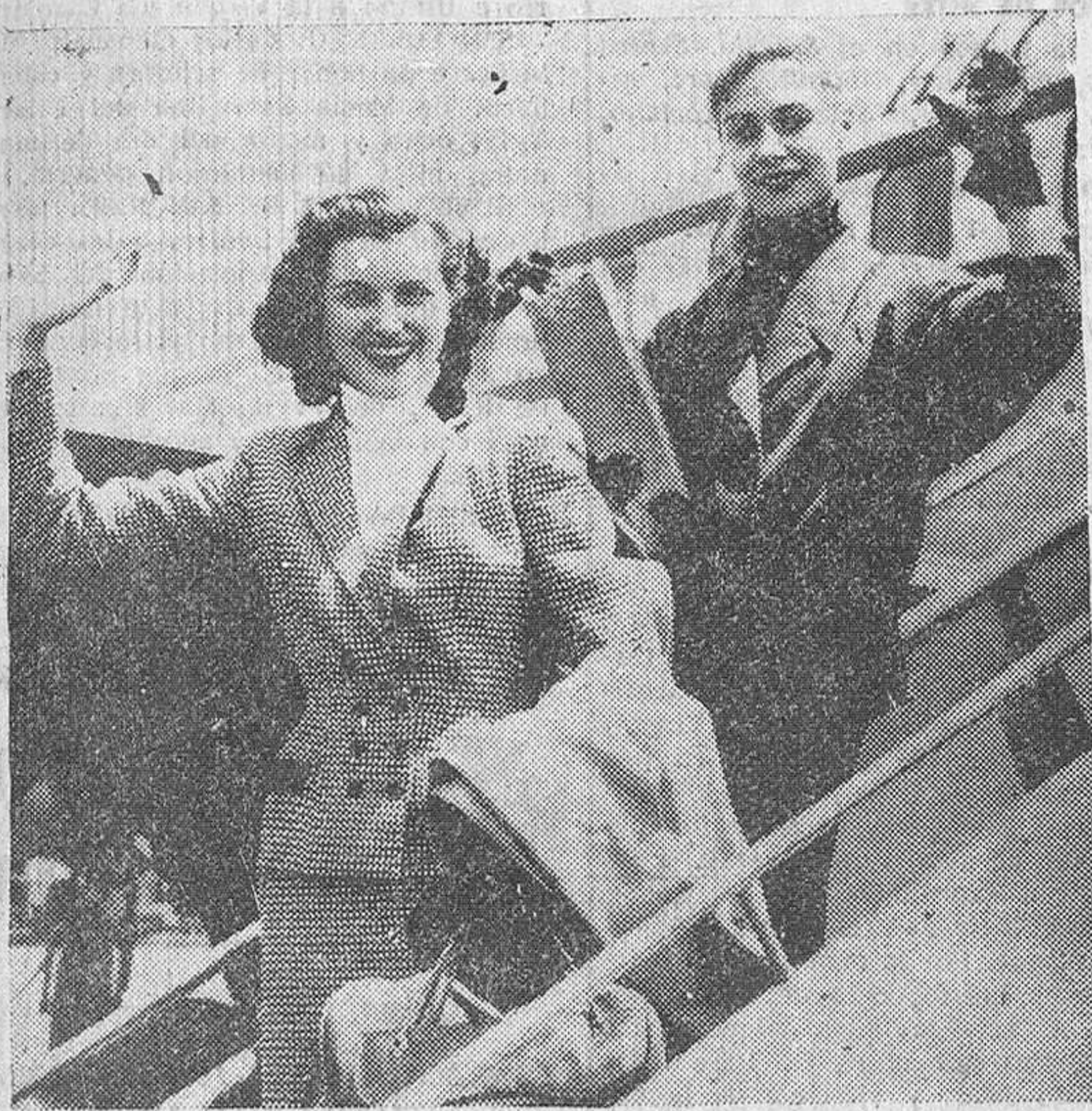
Nueva York. - Dentro de muy poco se celebrará en California la elección de "Miss Universo" y las bellezas representantes de los diversos países van llegando a los Estados Unidos para participar en el concurso. Presentamos en nuestra fotografía a dos de las competidoras: Miss Francia (en primer término) y Miss Suiza, dos esculturales bellezas de 20 y 19 años, que aspiran al título universal.

Londres.—Radio Moscú informa esta noche que Laurenti Beria ha sido expulsado del partido comunista.—Efe