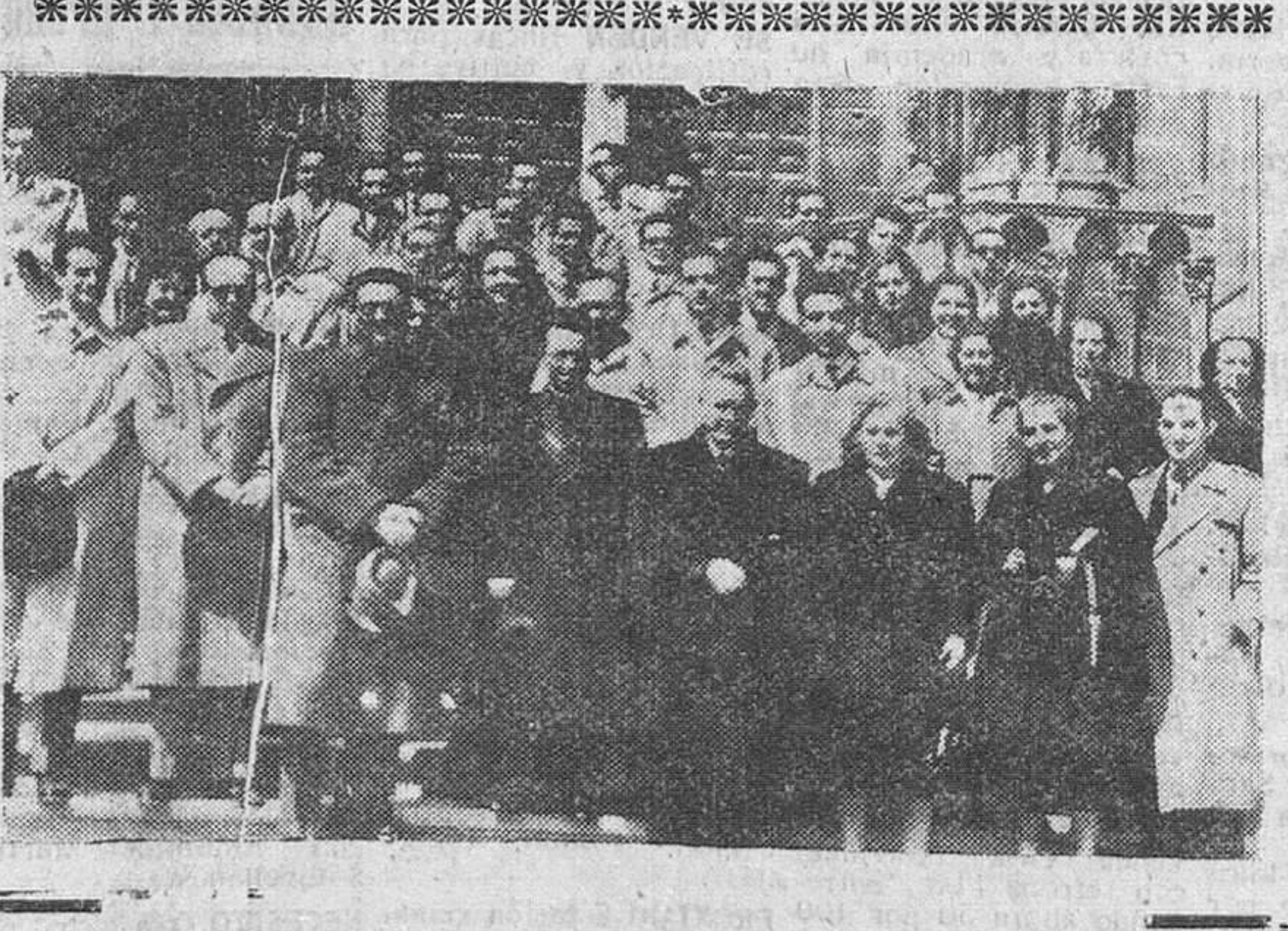
La fiesta de San Isidoro. Los funcionarios de los Institutos Nacional de Estadística y Geográfico y Catastral, celebraron ayer la fiesta de su Patrono, San Isidoro, Obispo de Sevilla.