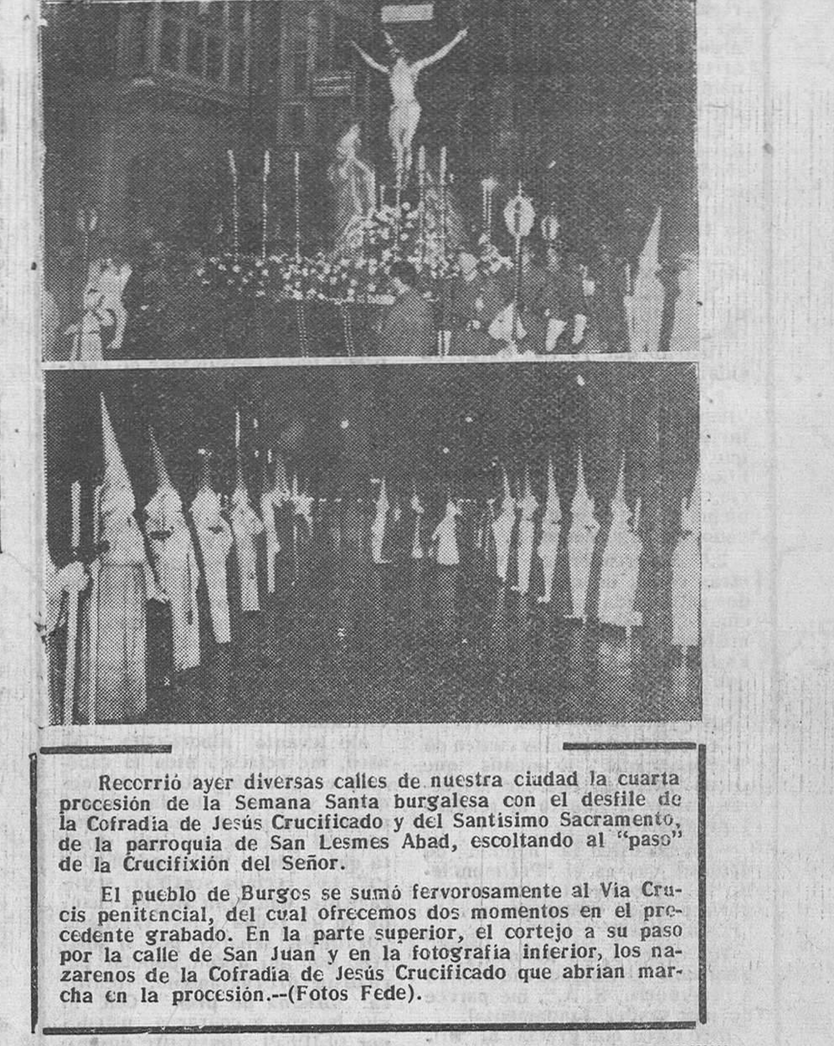
Recorrió ayer diversas calles de nuestra ciudad la cuarta procesión de la Semana Santa burgalesa con el desfile de la Cofradía de Jesús Crucificado y del Santísimo Sacramento, de la parroquia de San Lesmes Abad, escoltando al "paso" de la Crucifixión del Señor.