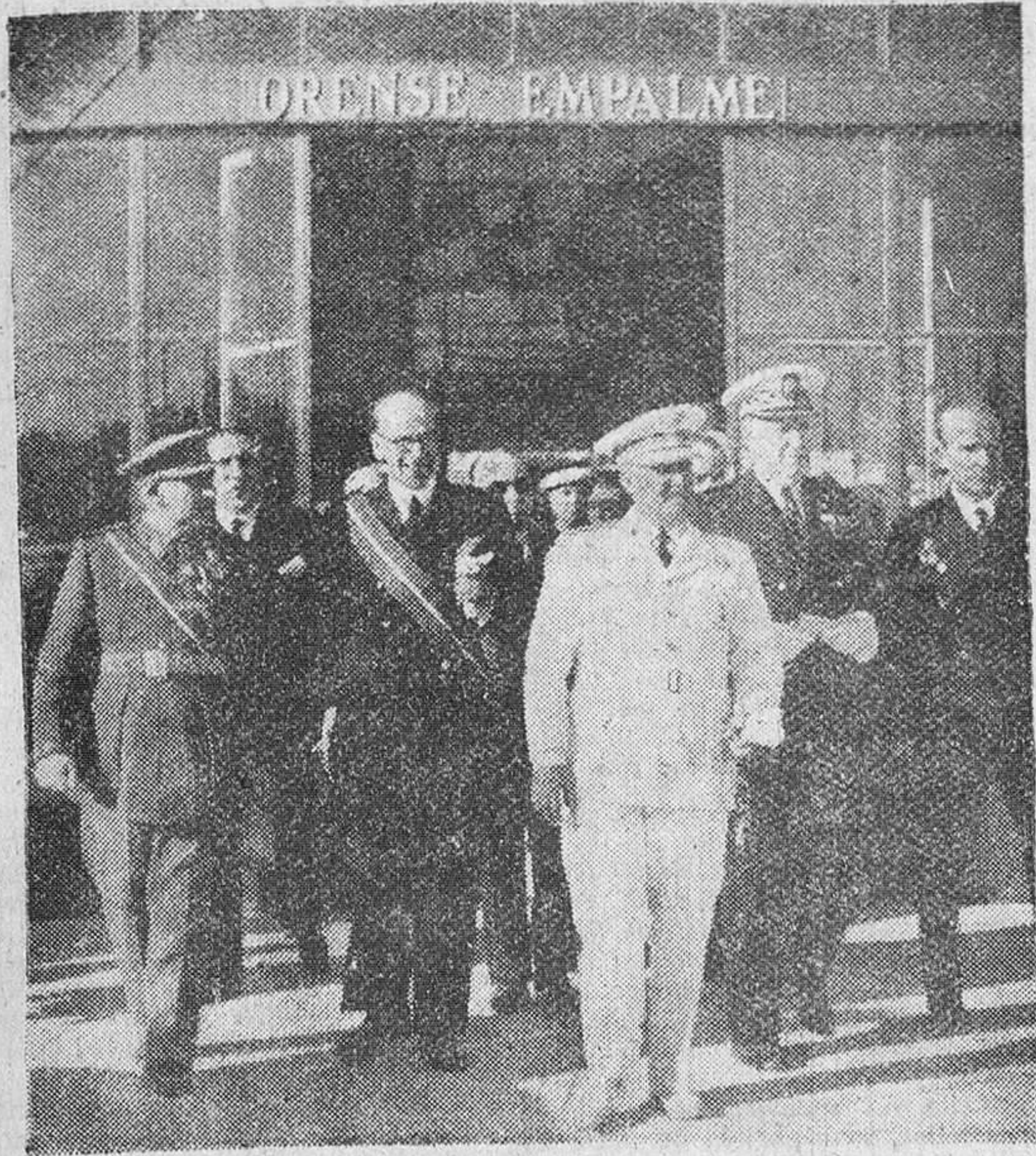
Orense. — S. E. el jefe del Estado acompañado del ministro de Obras Públicas y otras personalidades durante el acto inaugural de la nueva estación de ferrocarril Zamora-Coruña, que fue bendecido por el obispo de Santiago, revestido de pontifical