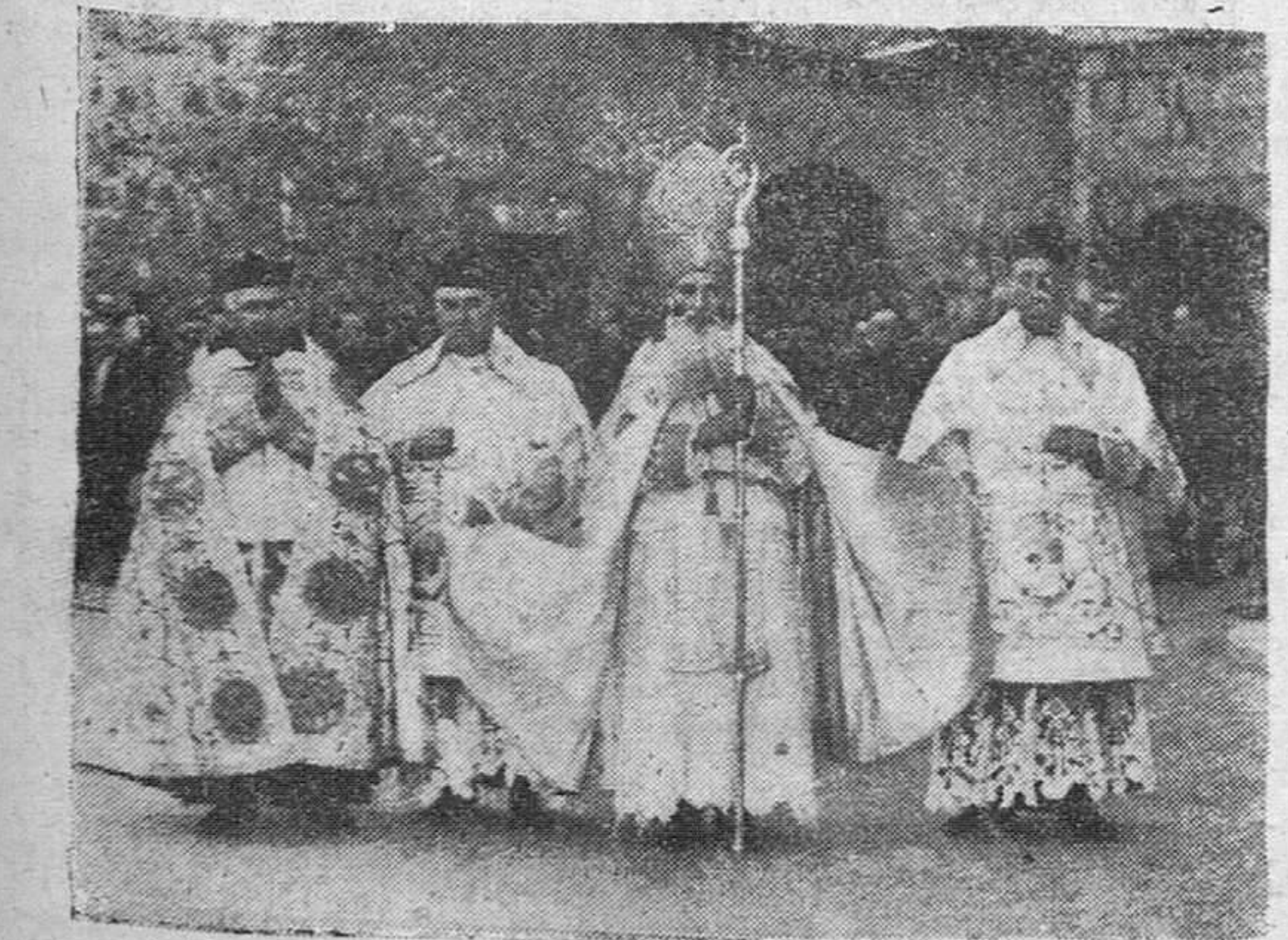
Monseñor Labrador, Obispo dominico, presidiendo de pontifical la solemne procesion del Carmen, que ayer tarde recorrió las calles de la ciudad.