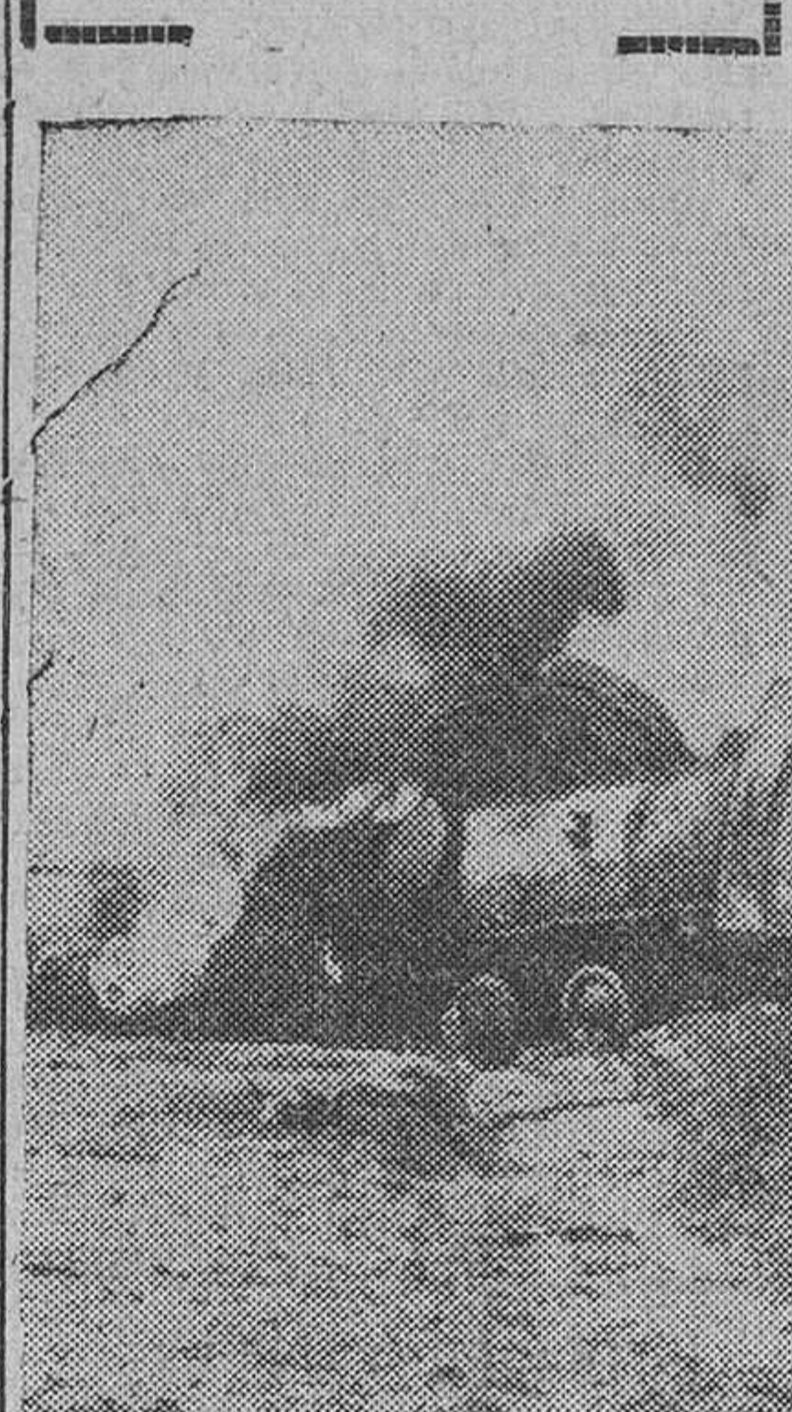
Santiago de Compostela. — Impresionante aspecto que presentaba la locomotora del expreso Vigo-Coruña, a consecuencia del accidente ferroviario, ocurrido en el inmediato lugar de Pazos.

Santiago de Compostela. — Impresionante aspecto que presentaba la locomotora del expreso Vigo-Coruña, a consecuencia del accidente ferroviario, ocurrido en el inmediato lugar de Pazos.