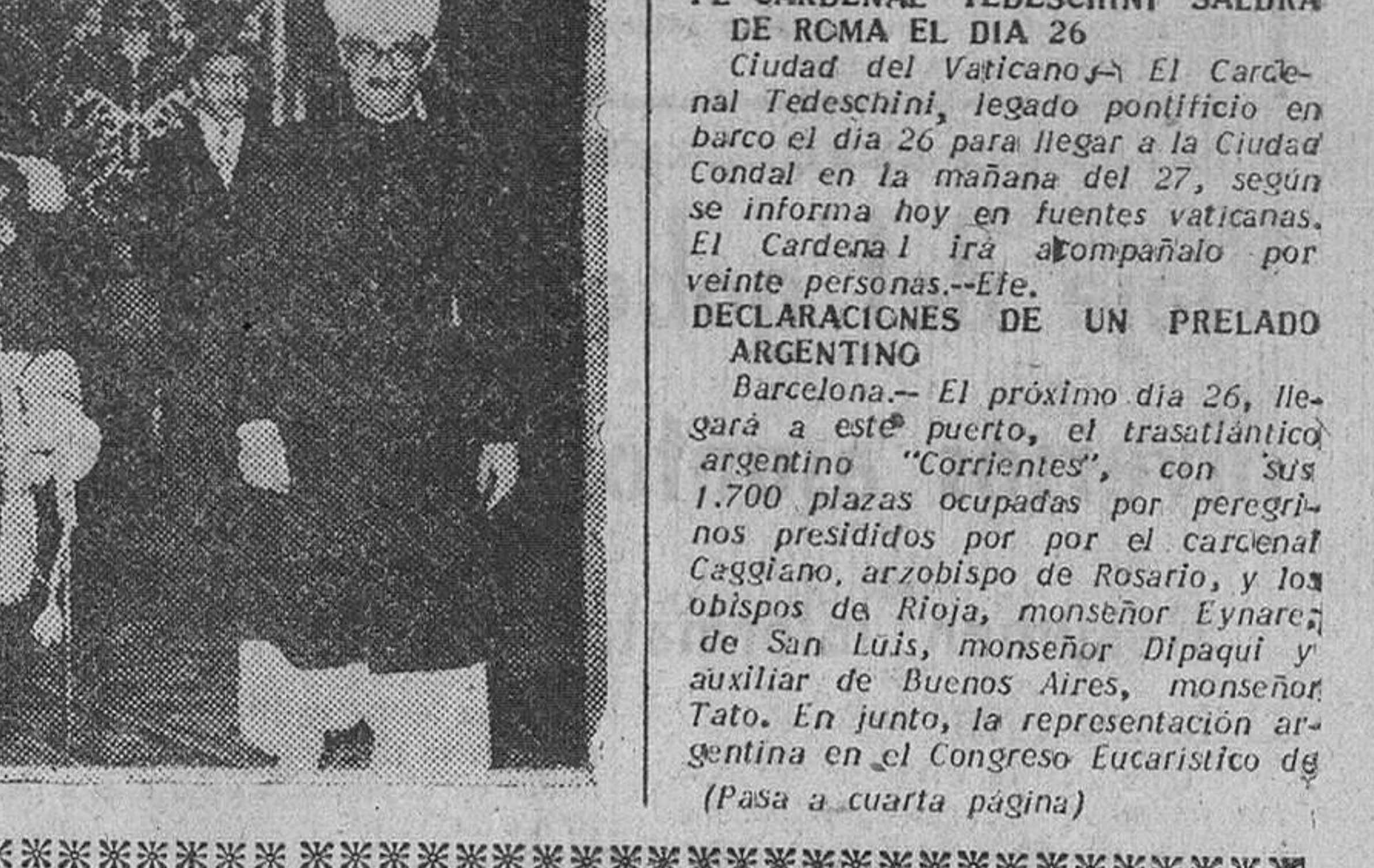
Barcelona.—El próximo día 26, llegará a este puerto, el trasatlántico argentino "Corrientes", con sus 1.700 plazas ocupadas por peregrinos presidiados por el Cardenal Caggiano, arzobispo de Rosario, y los obispos de Ríoja, monseñor Eynarey de San Luis, monseñor Dipaqui y auxiliar de Buenos Aires, monseñor Tato. En junto, la representación argentina en el Congreso Eucarístico de

legajo a los sacerdotes peregrinos que asistan al Congreso Eucarístico y tengan licencia de su ordinario de confesar durante el viaje a los componentes de la peregrinación, con las debidas cautelas que establece el Código Canónico. La emisora agregó que el obispo de Barcelona, usando sus propias facultades, ha concedido a todos los sacerdotes peregrinos al Congreso Eucarístico, que puedan usar en la diócesis de Barcelona y durante el tiempo de la peregrinación, las mismas licencias que gozan en su propia diócesis o en las diócesis de su residencia habitual.—Efe. EL CARDENAL TEDESCHINI SALDRA DE ROMA EL DIA 26 Ciudad del Vaticano.—El Cardenal Tedeschini, legado pontificio en barco el día 26 para llegar a la Ciudad Condal en la mañana del 27, según se informa hoy en fuentes vaticanas. El Cardenal irá acompañado por veinte personas.—Efe. DECLARACIONES DE UN PREGADO ARGENTINO Barcelona.—El próximo día 26, llegará a este puerto, el trasatlántico argentino "Corrientes", con sus 1.700 plazas ocupadas por peregrinos presidiados por el Cardenal Caggiano, arzobispo de Rosario, y los obispos de Ríoja, monseñor Eynarey de San Luis, monseñor Dipaqui y auxiliar de Buenos Aires, monseñor Tato. En junto, la representación argentina en el Congreso Eucarístico de