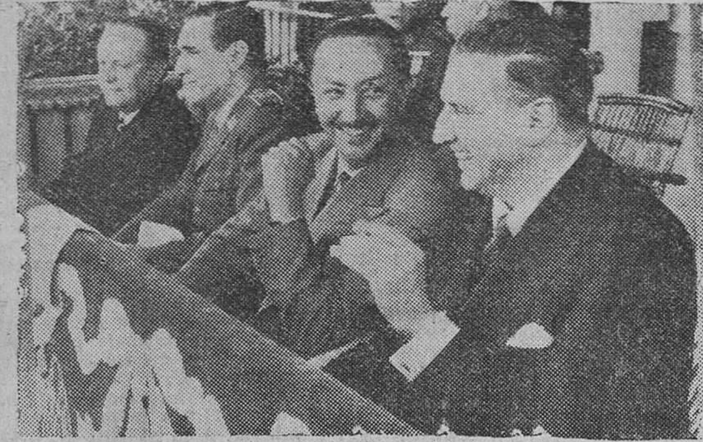
Madrid. — El Príncipe Regente del Iraq, Abdul Ilah, con los ministros de Asuntos Exteriores, Ejército y secretario general del Movimiento, presenciando las pruebas del Concurso Hípico Internacional celebrado en el Hipódromo de la Zarzuela.

En unión del ministro del Aire español, el Príncipe Abdul Ilah llegó a Granada, donde ha visitado detenidamente la Alhambra y el Generalife