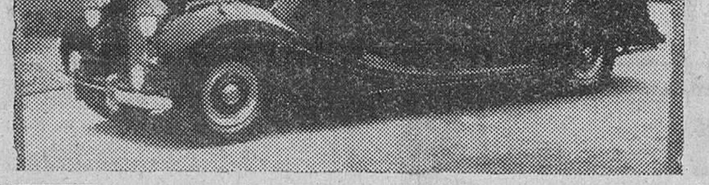
UN «ROLLS ROYCE» PARA EL CAUDILLO Ha sido entregado el coche «Rolls Royce» que reproducimos, encargado a la famosa firma inglesa y destinado a S. E. el Jefe del Estado español. Se trata de un cabriolet de cuatro puertas, con capota accionada mecánicamente, pintado de negro y tapizado en cuero. Consta de ocho cilindros y su potencia es de 175 caballos.

presidentes de las mismas. Jurarán el cargo los que no lo hayan hecho en anteriores etapas y pronunciará el señor Bilbao un discurso, señalándose a continuación la fecha y hora de la sesión inaugural.—Cifra DIPLOMATICO SURAFRICANO, EN BARCELONA Barcelona.—En viaje de turismo (Pasa a tercera página)