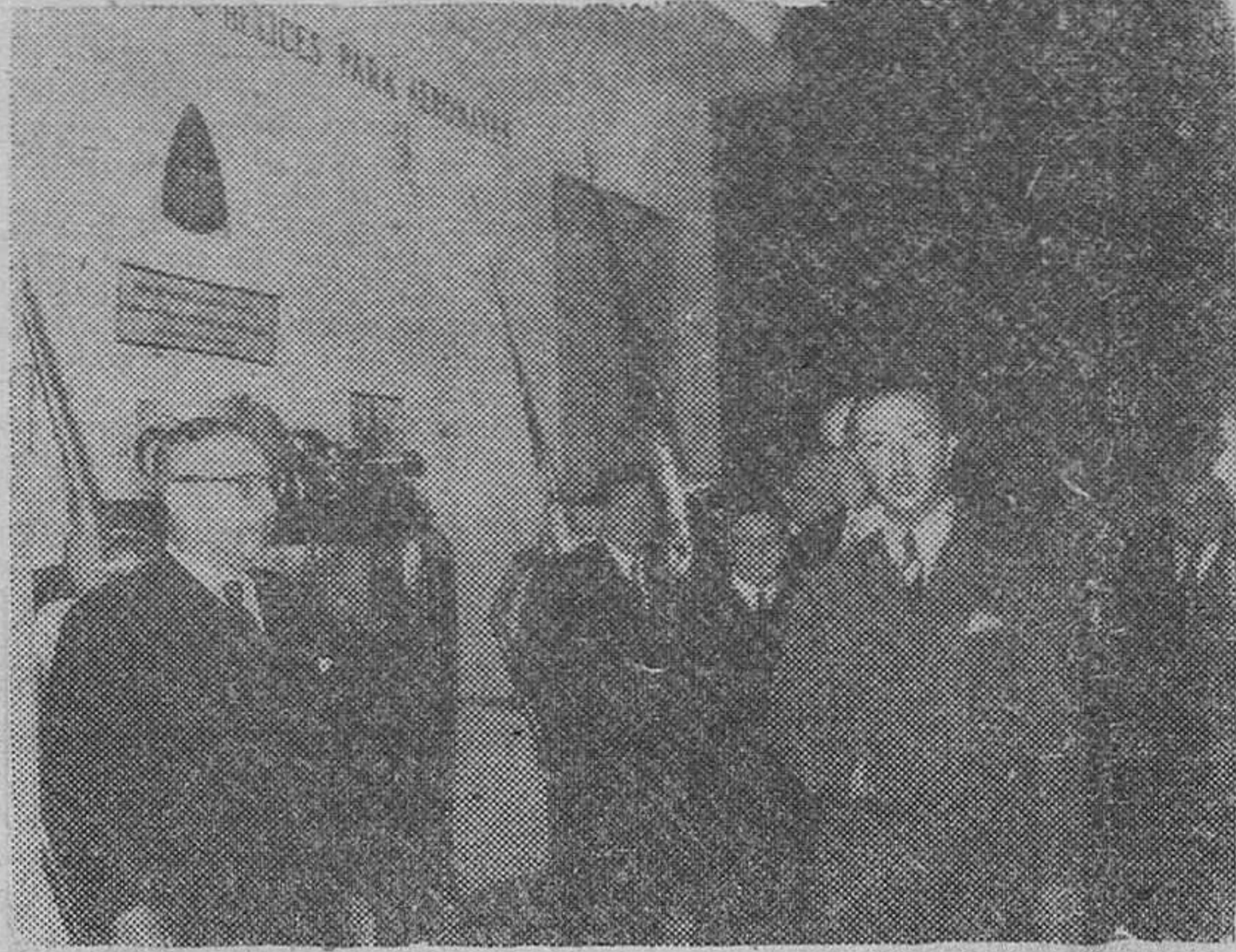
Madrid.—S. A. R. el Príncipe Regente del Iraq, Abdul Ilah, durante su visita a la Exposición Permanente de la Industria Española, escucha las explicaciones técnicas del presidente del Instituto de Industria, señor Suanzes. Acompañó también al ilustre huésped el ministro del Departamento señor Planell.

A TOLEDO Aranjuez.—Terminado el almuerzo en la Casita del Labrador, Su Excelencia el Jefe del Estado (Pasa a quinta página)