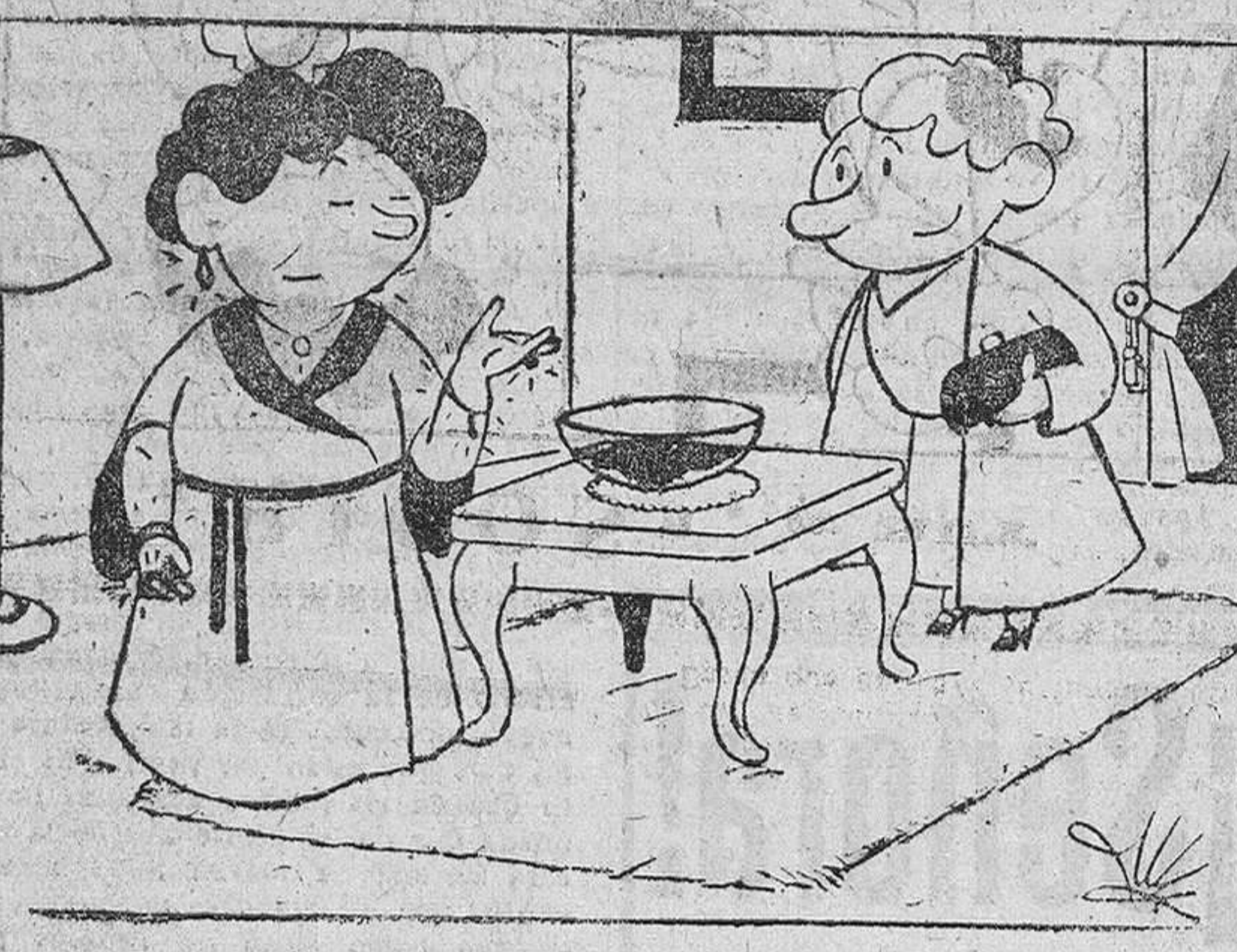
—Con el té, nosotros ponemos a «hongo» pastas variadas y una copa de jerez.