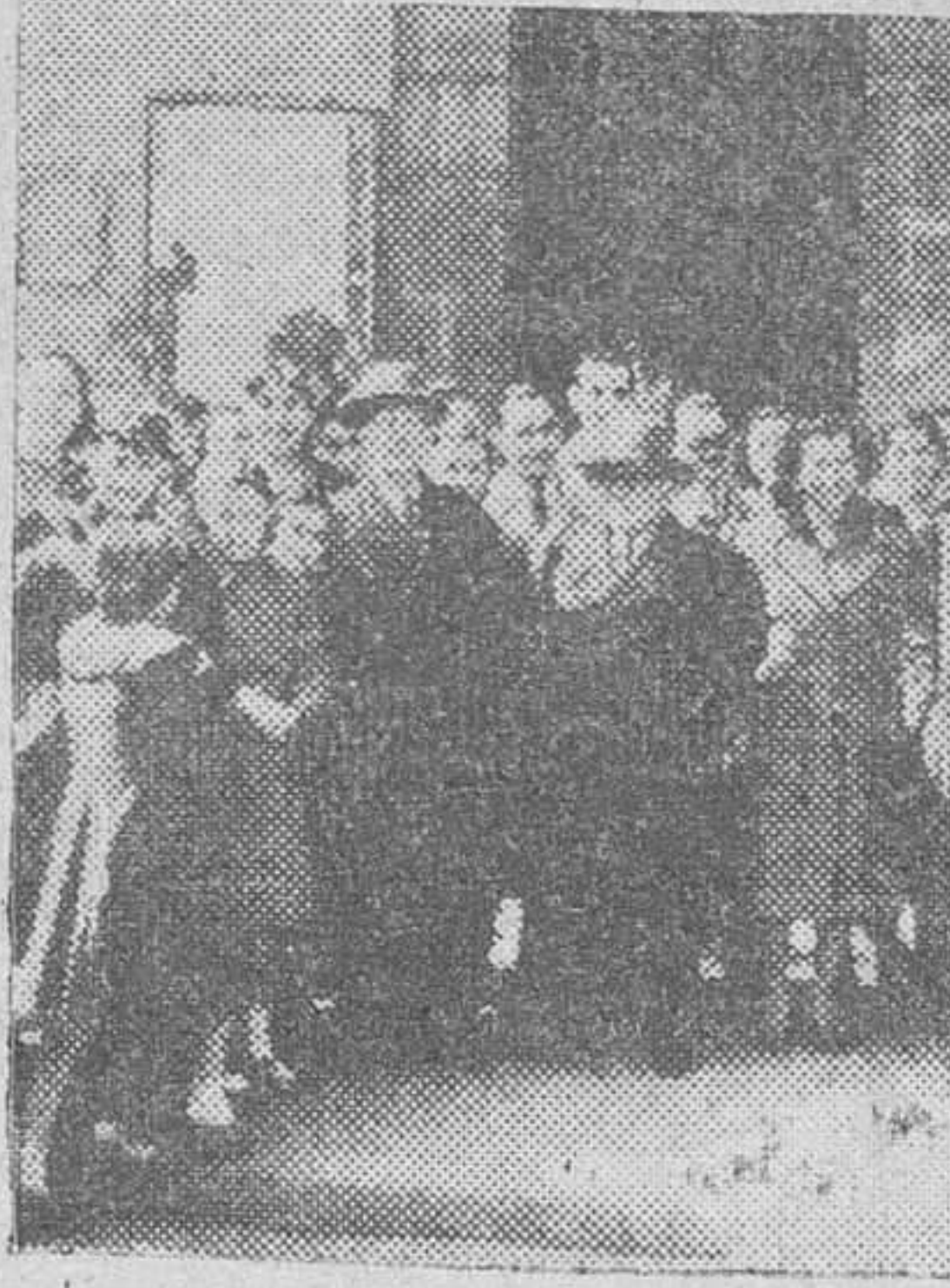
Autoridades académicas burgalesas rodeadas de un grupo de alumnos, después de asistir a la misa celebrada ayer mañana en la Iglesia del Carmen, con motivo de la "Fiesta del Libro".