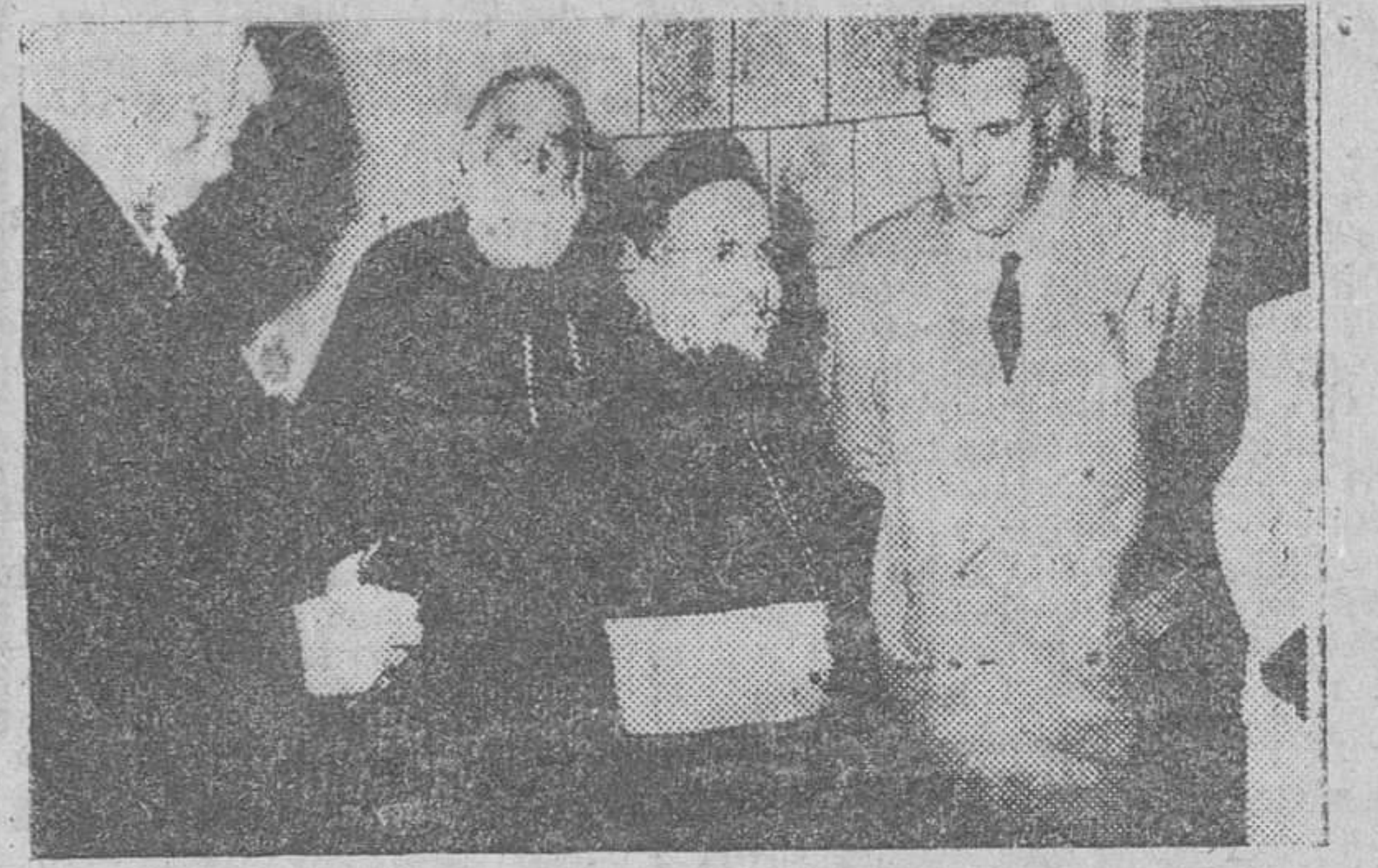
Beirut. — El ministro de Asuntos Exteriores español señor Martín Artajo, a su llegada al Santuario de Nuestra Señora del Líbano, en Harissa, donde fué recibido por el Padre Antonio, Superior de la Congregación de Misioneros del Líbano, cuyo convento y capilla fueron construidos en 1787, con un donativo del Rey Carlos IV de España y su esposa.