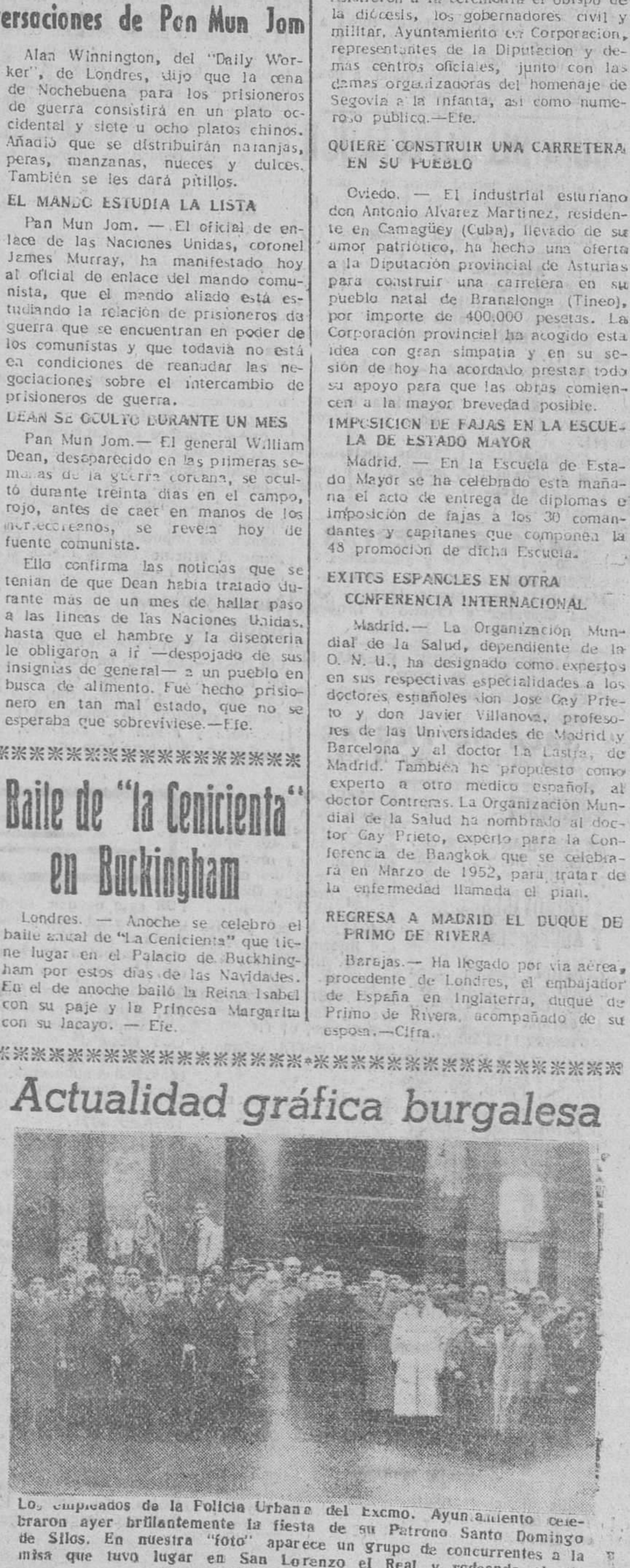
Lo, empadonados de la Policía Urbana del Excmo. Ayuntamiento celebraron ayer brillantemente la fiesta de su Patrono Santo Domingo de Silos. En nuestra "foto" aparece un grupo de concurrentes a la misa que tuvo lugar en San Lorenzo el Real y rodeando al parroco de dicha feligresía.