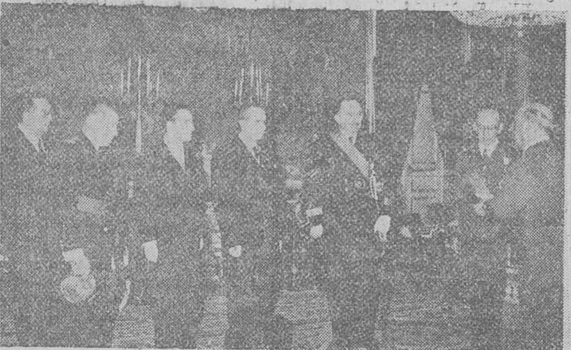
Madrid. — S. E. el jefe del Estado, durante la audiencia concedida a la Junta de Energía Nuclear, presidida por el teniente general jefe del Alto Estado Mayor, don Juan Vigón.