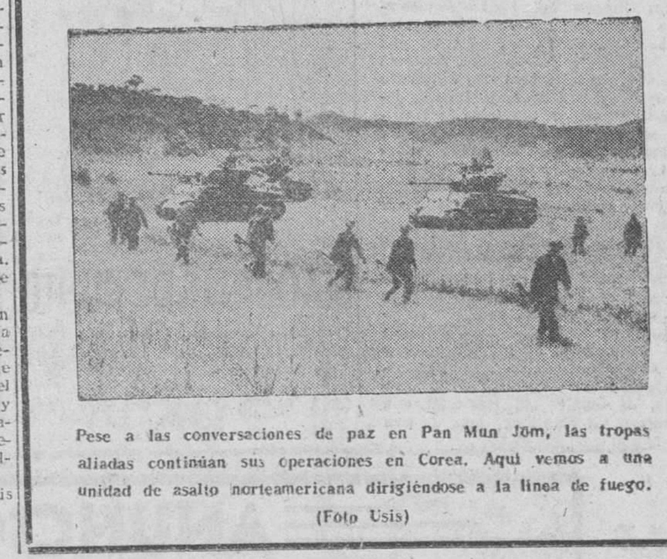
Pese a las conversaciones de paz en Pan Mun Jón, las tropas aliadas continúan sus operaciones en Corea. Aquí vemos a una unidad de asalto norteamericana dirigiéndose a la línea de fuego.