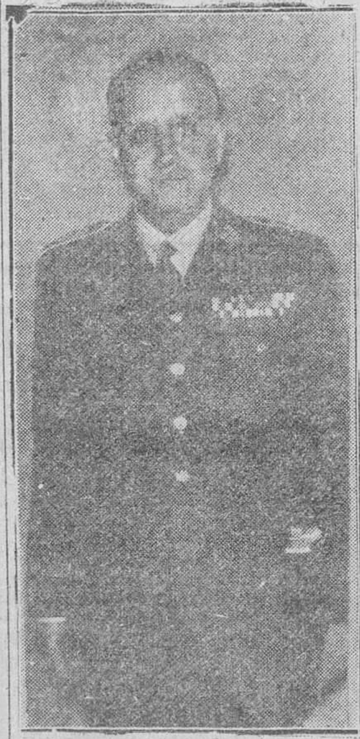
El general de Estado Mayor don Francisco Montojo Torrondegui, en el día de ayer llegó a nuestra ciudad haciendo cargo de su nuevo destino de jefe de Estado Mayor del Cuadro de Ejército VI y de la Capitanía General de esta Región.