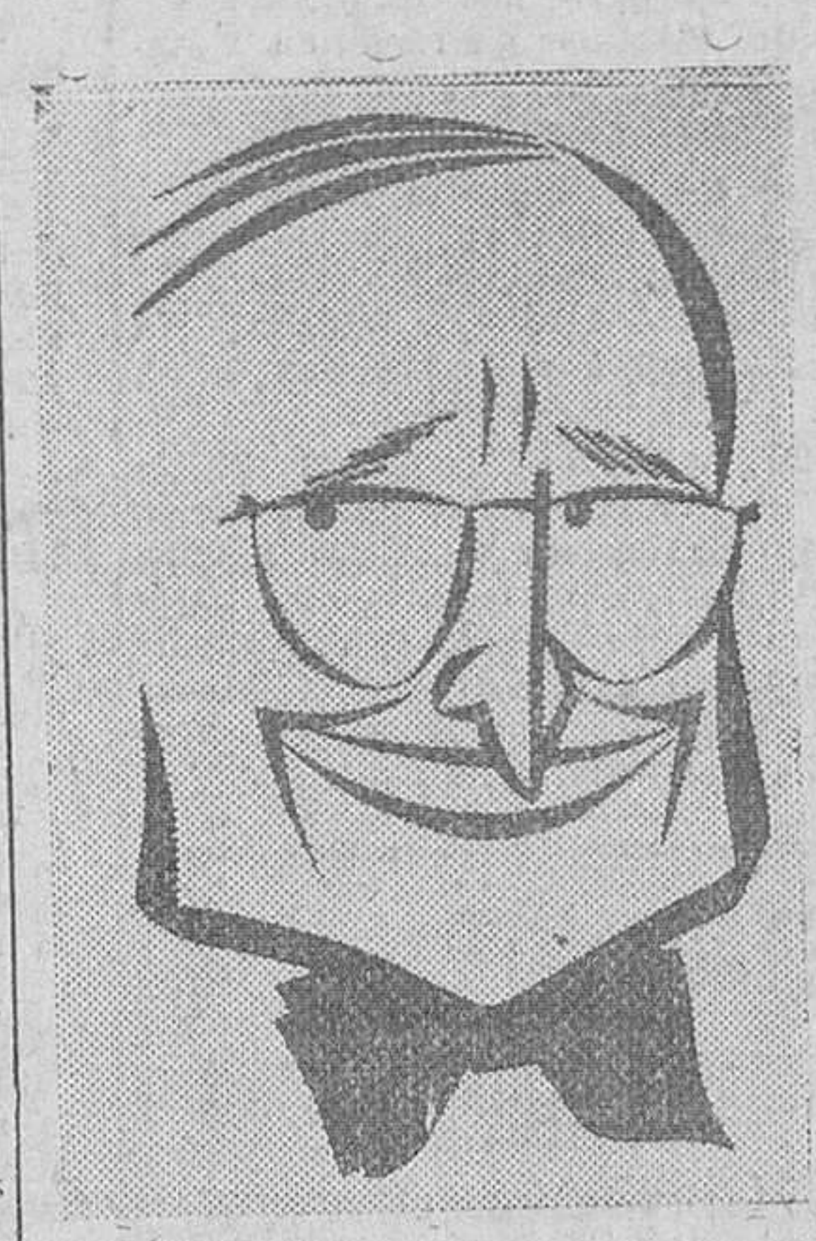
Washington.—El presidente Truman ha dicho hoy que la guerra de Corea ha demostrado al Mundo que la "Carta de las Naciones Unidas no es un papel mojado".

En un discurso con motivo de la conmemoración del 175 aniversario de la declaración de independencia de los Estados Unidos, el presidente dijo que las fuerzas de la ONU en Corea pueden tener en sus manos la historia, pero también que Norteamérica y el resto del Mundo deben estar vigilantes, pues hay peligro de estallidos militares en otras regiones del Globo y la amenaza soviética pesa todavía sobre muchas naciones, entre ellas los propios Estados Unidos.