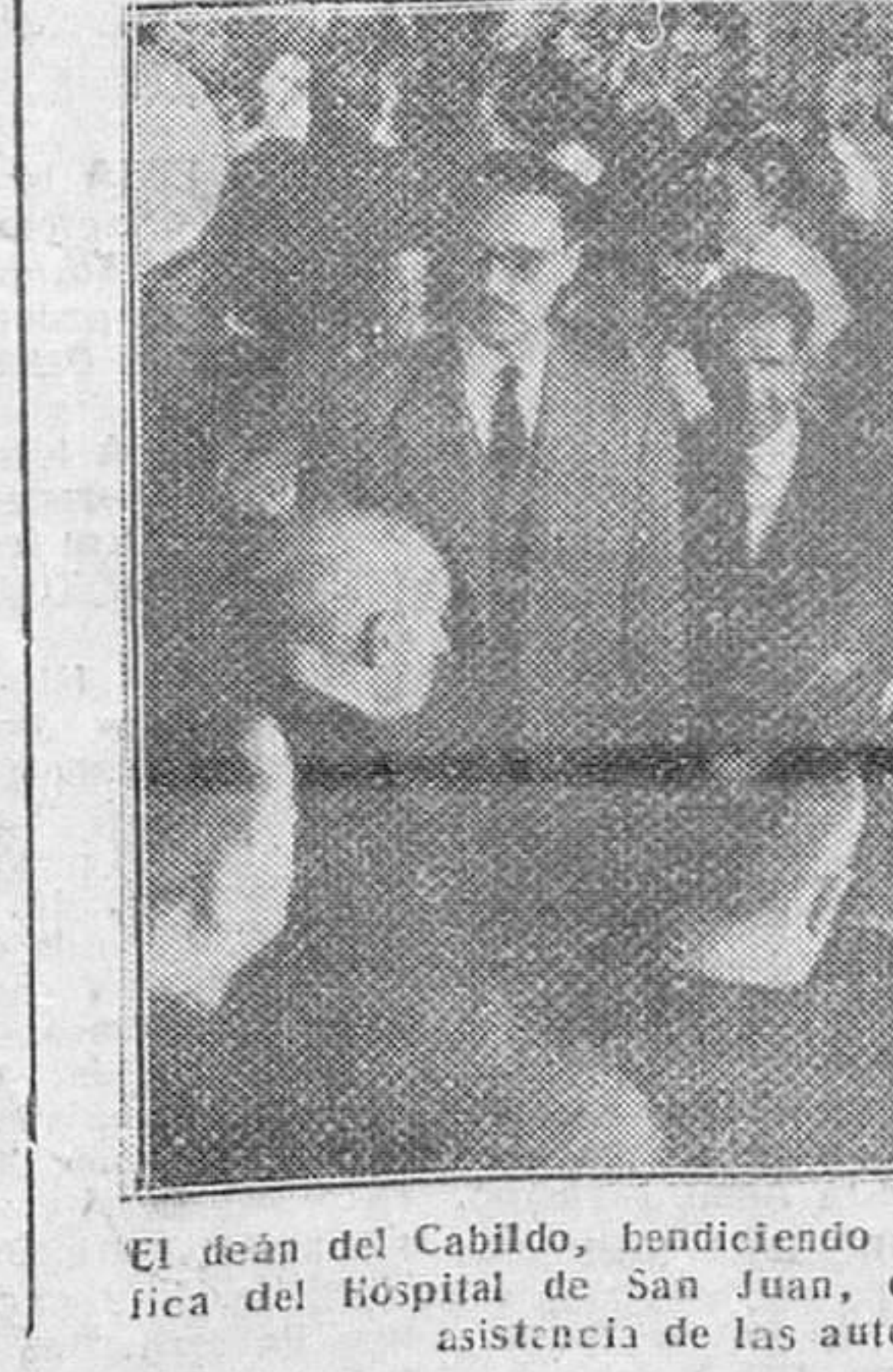
El deán del Cabildo, bendiciendo las instalaciones de la tómbola benéfica del Hospital de San Juan, que fue inaugurada ayer tarde, con asistencia de las autoridades.