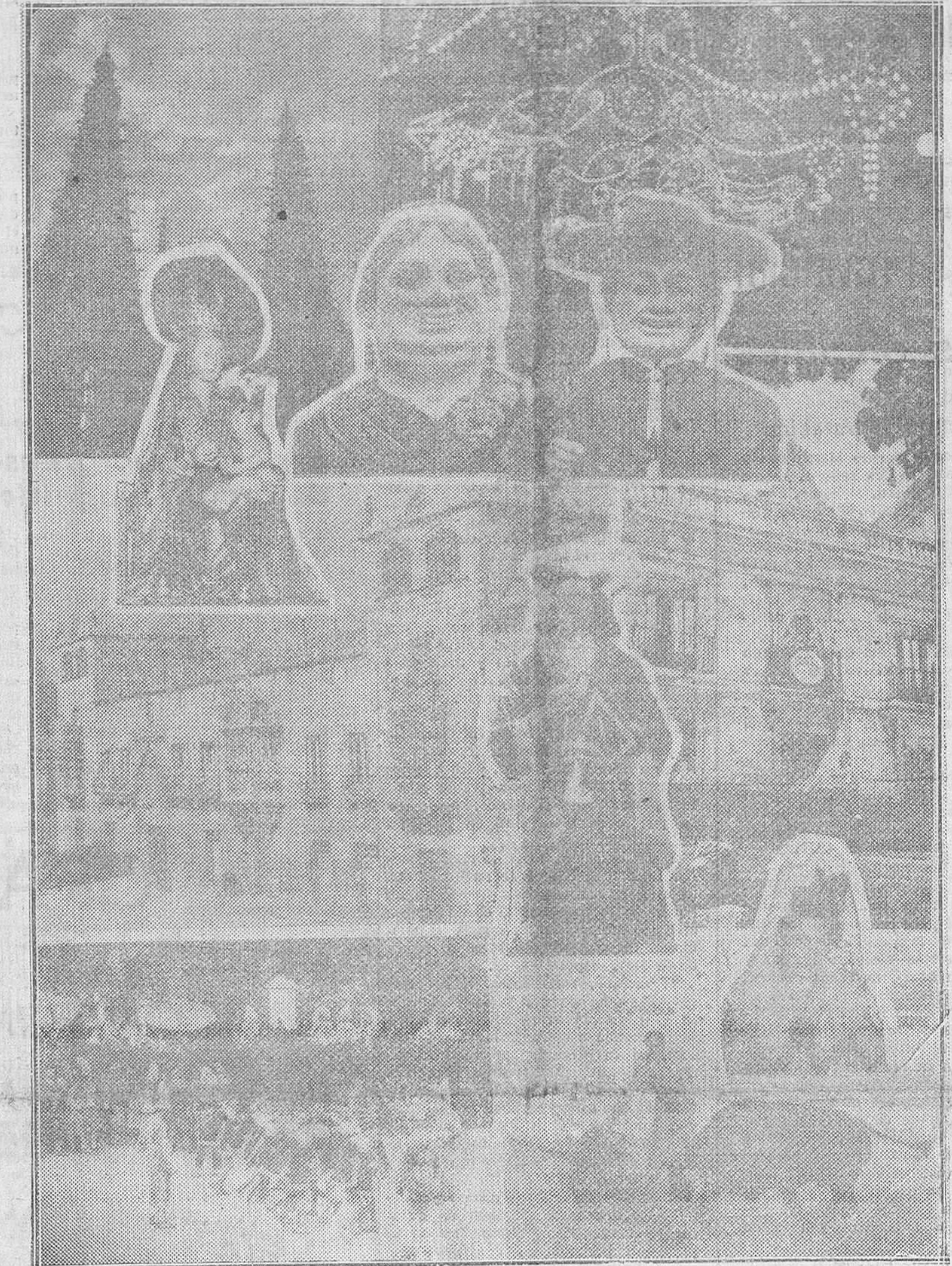
COMPOSICION FOTOGRAFICA DE LAS FIESTAS (DE FEDE)