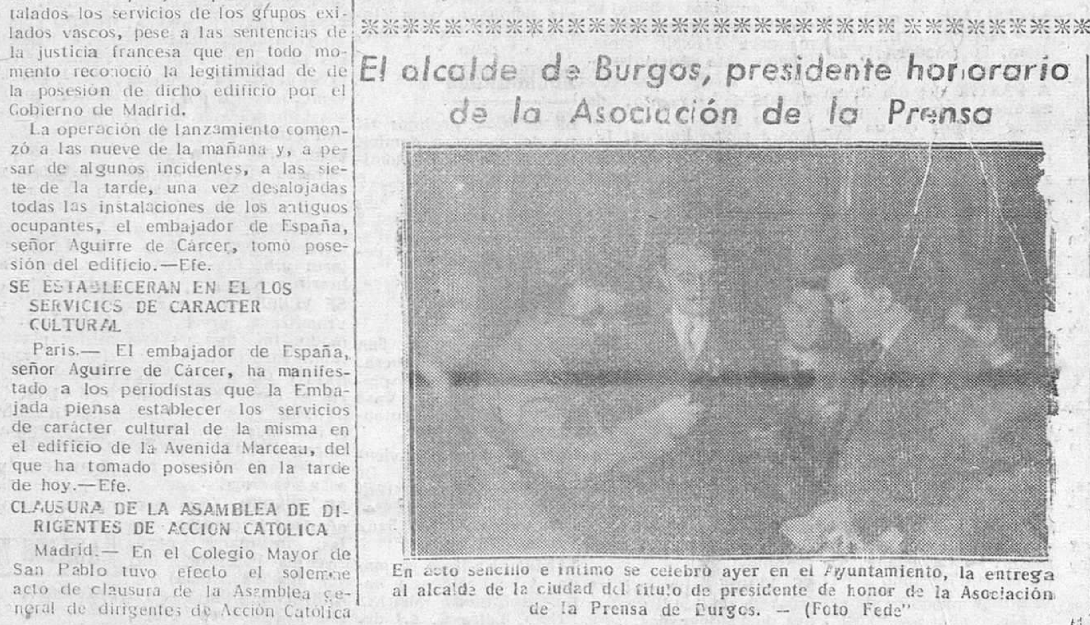
En acto solemne e íntimo se celebró ayer en el Ayuntamiento, la entrega al alcalde de la ciudad del título de presidente de honor de la Asociación de la Prensa de Burgos. — (Foto Fed.)

Roma. — Baham, el "Fakir del ayuno" afirma haber batido la marca mundial al permanecer sin comer durante sesenta días en un cofre de cristal sellado. La marca anterior la ostentaba el francés que estuvo sin comer cincuenta y siete días. — Etc. EL ALCALDE DE BURGOS, PRESIDENTE HONORARIO DE LA ASOCIACIÓN DE LA PRENSA. Madrid. — En el Ayuntamiento, la entrega al alcalde de la ciudad del título de presidente de honor de la Asociación de la Prensa de Burgos. — (Foto Fed.)