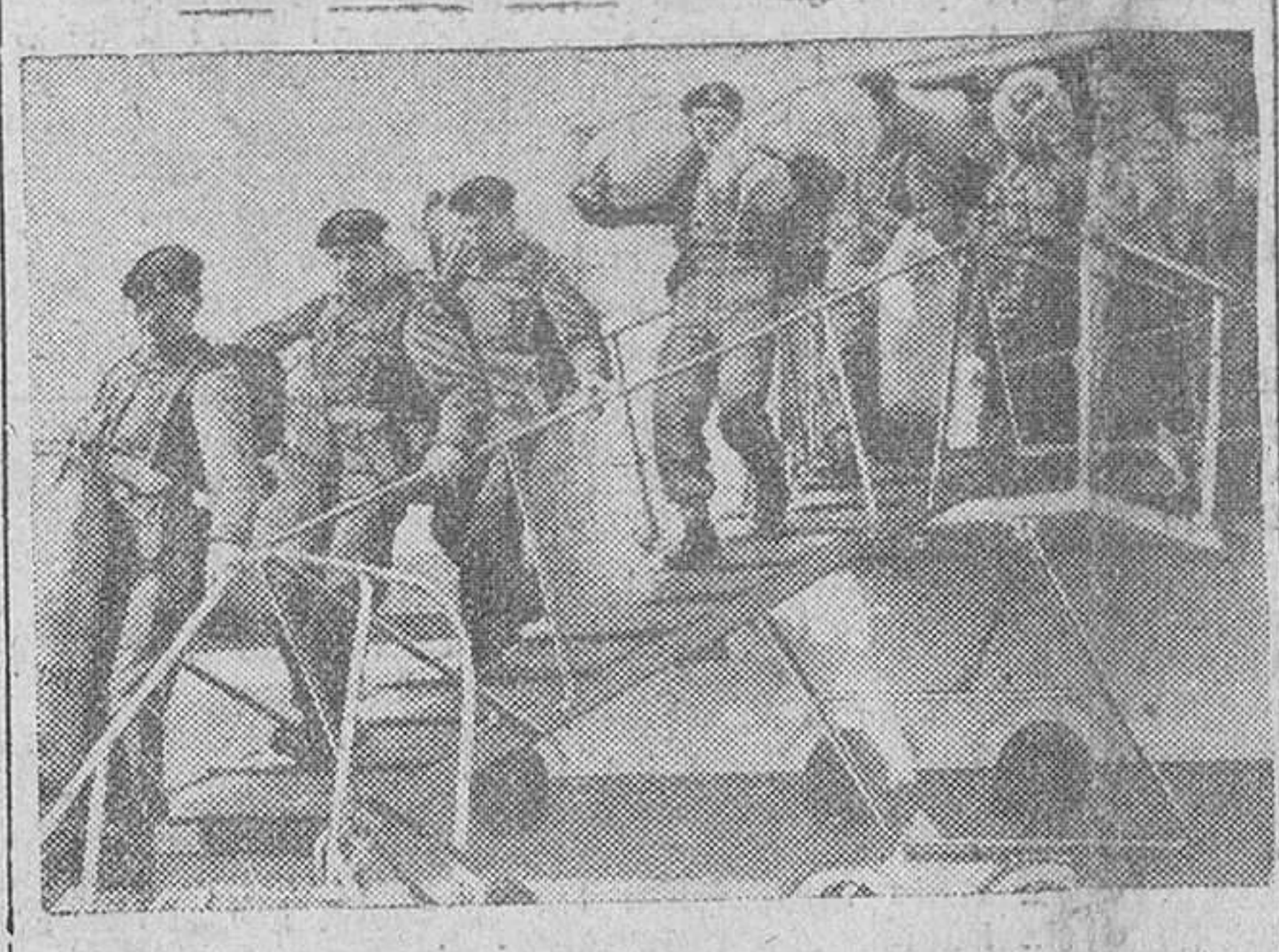
Creemos aquí dos documentos gráficos del movimiento de fuerzas combatientes de los países aliados que luchan en Corea. En la foto superior, fuerzas de los Estados Unidos, embarcando en un puerto del Pacífico, rumbo al teatro de guerra y en la foto inferior, soldados británicos, al desembarcar en el puerto de Southampton después de haber combatido en los frentes de Corea

Un millón de personas han muerto por accidente en carretera desde principio de siglo en Estados Unidos