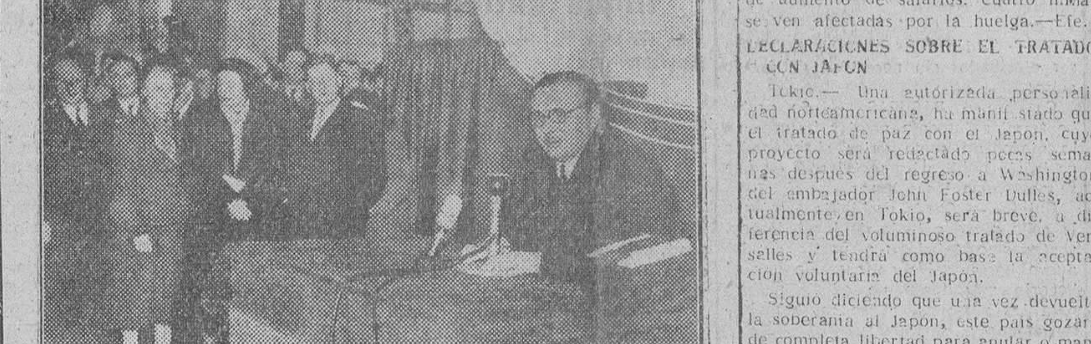
DESPUÉS DE SU VIAJE A ESTADOS UNIDOS Y CANADA, RENE PLEVEN, JEFE DEL GOBIERNO FRANCÉS, LLEGA AL AEROPUERTO DE ORLY DE REGRESO EN PARIS...