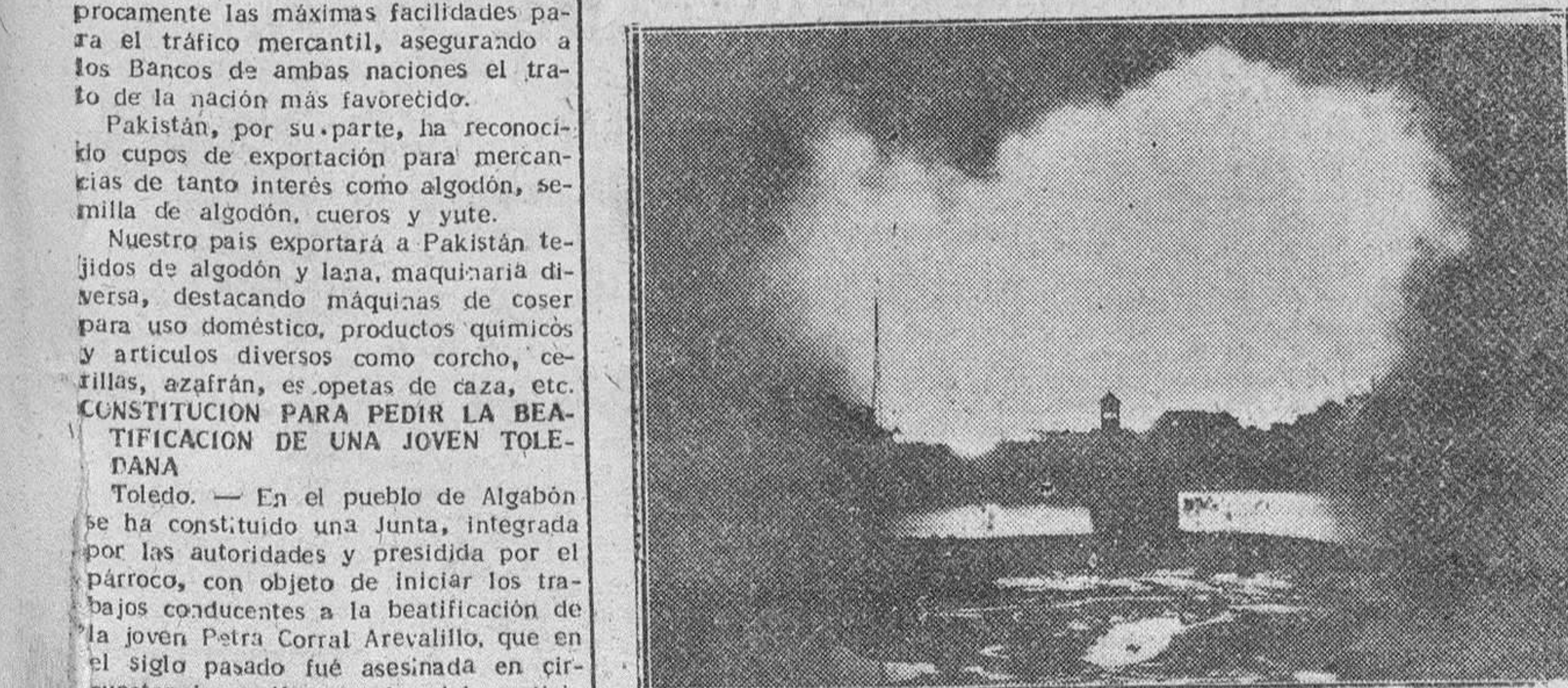
AL ABANDONAR INCHON LAS FUERZAS DE LAS NACIONES UNIDAS, TODAS LAS INSTALACIONES DEL PUERTO FUERON DESTRUIDAS. HE AQUI UNA VISTA IMPRESIONANTE DE INCHON ARDIENDO EN LA NOCHE.