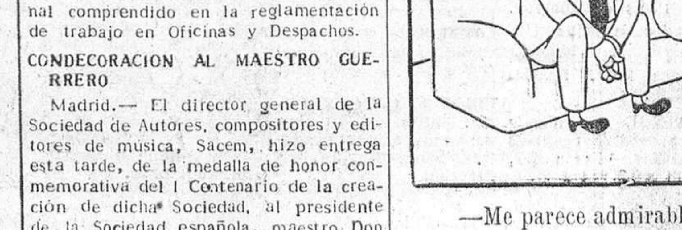
—Me parece admirable, joven, que se sienta con fuerzas para sostener una familia, pero ¿ha pensado Vd. en que somos nueve?