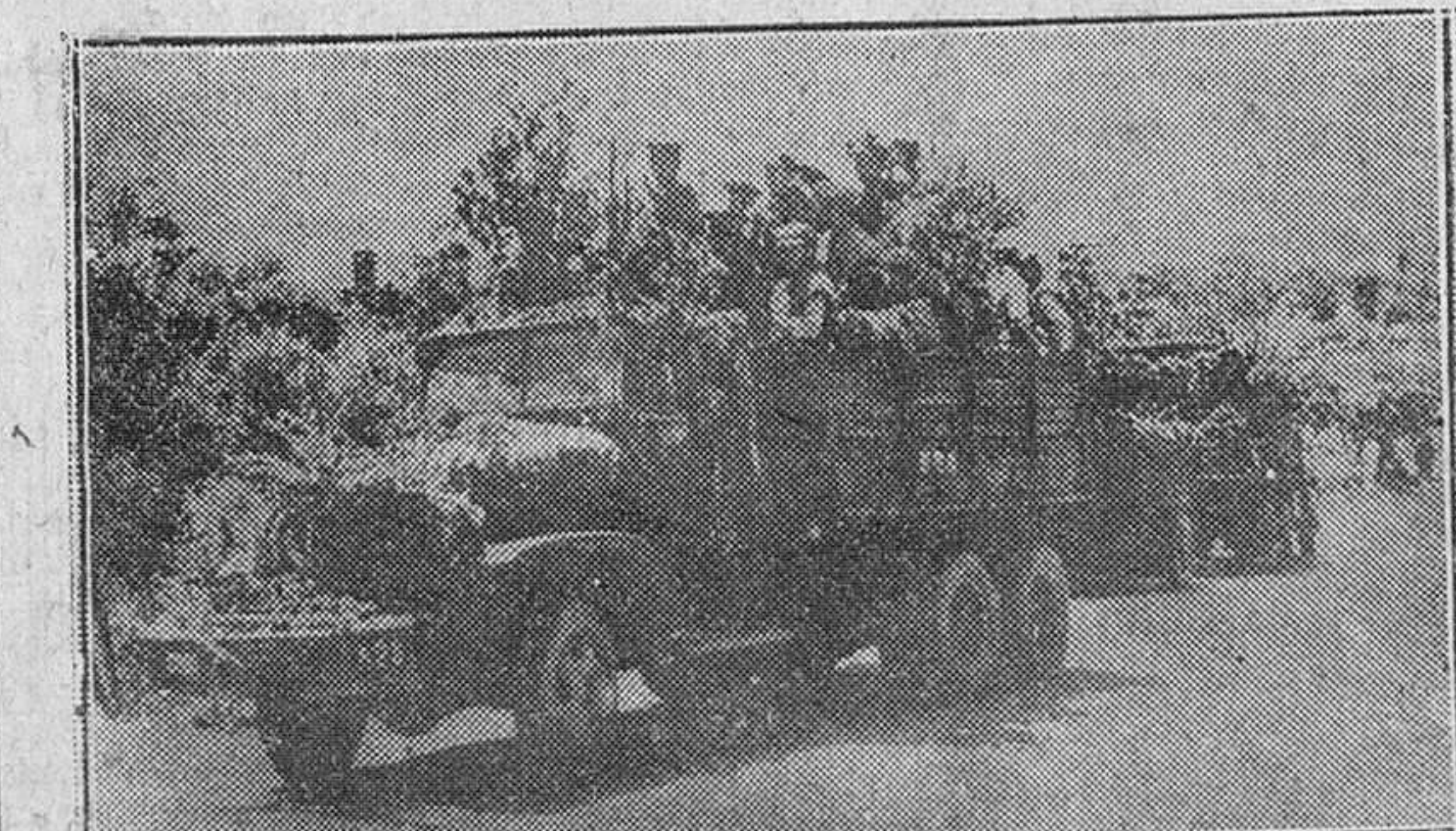
SUWON.—SOLDADOS DE COREA DEL SUR EN CAMIONES CAMUFLADOS PARA EVITAR SER VISTOS POR LA AVIACION ENEMIGA. CAMINO DEL FRENTE DE COMBATE.