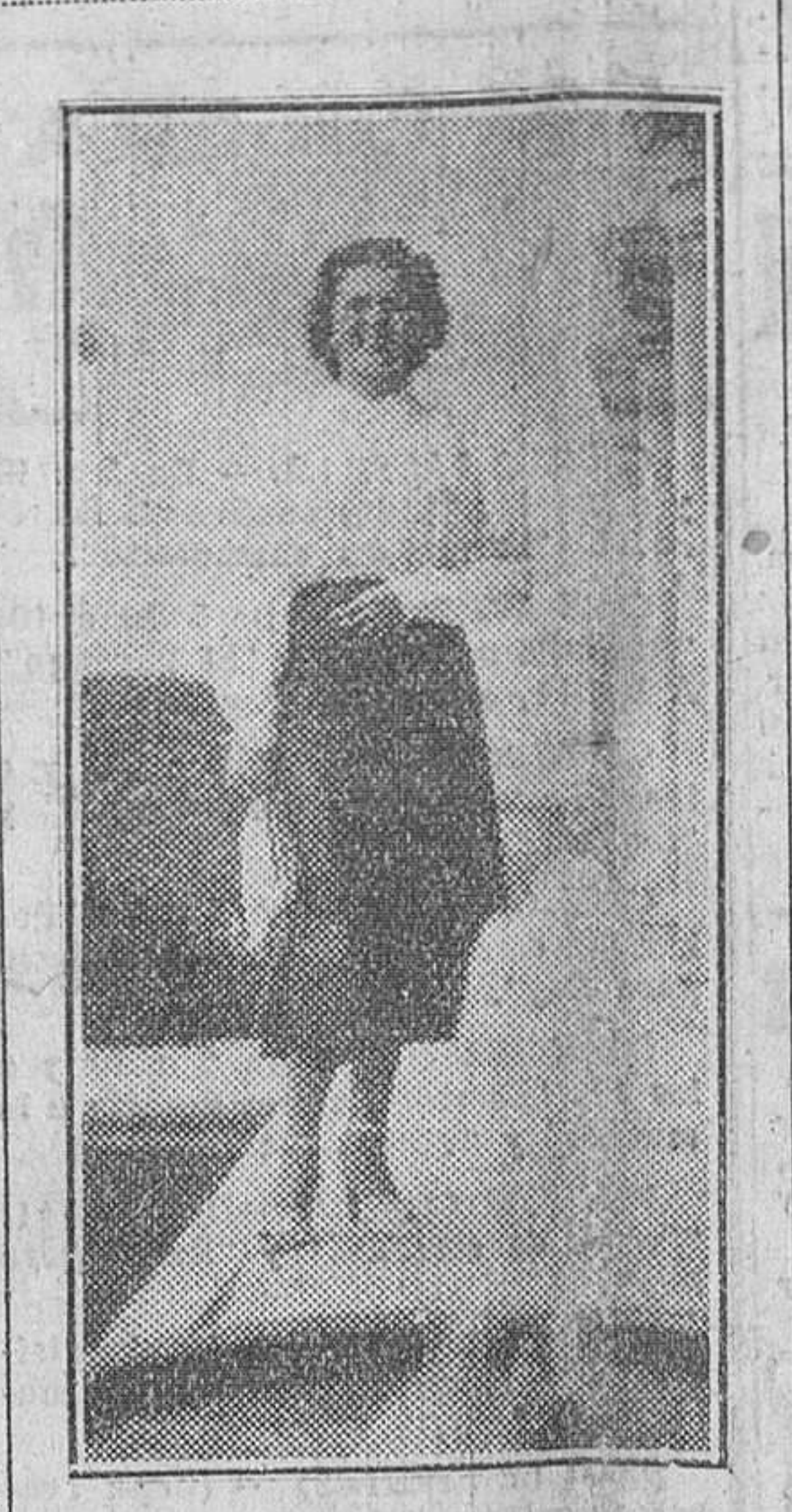
Granada.—Bebé Shopp, durante su estancia en esta capital, visitó la Alhambra. En la foto aparece en el Patio de los Leones de dicho palacio árabe.