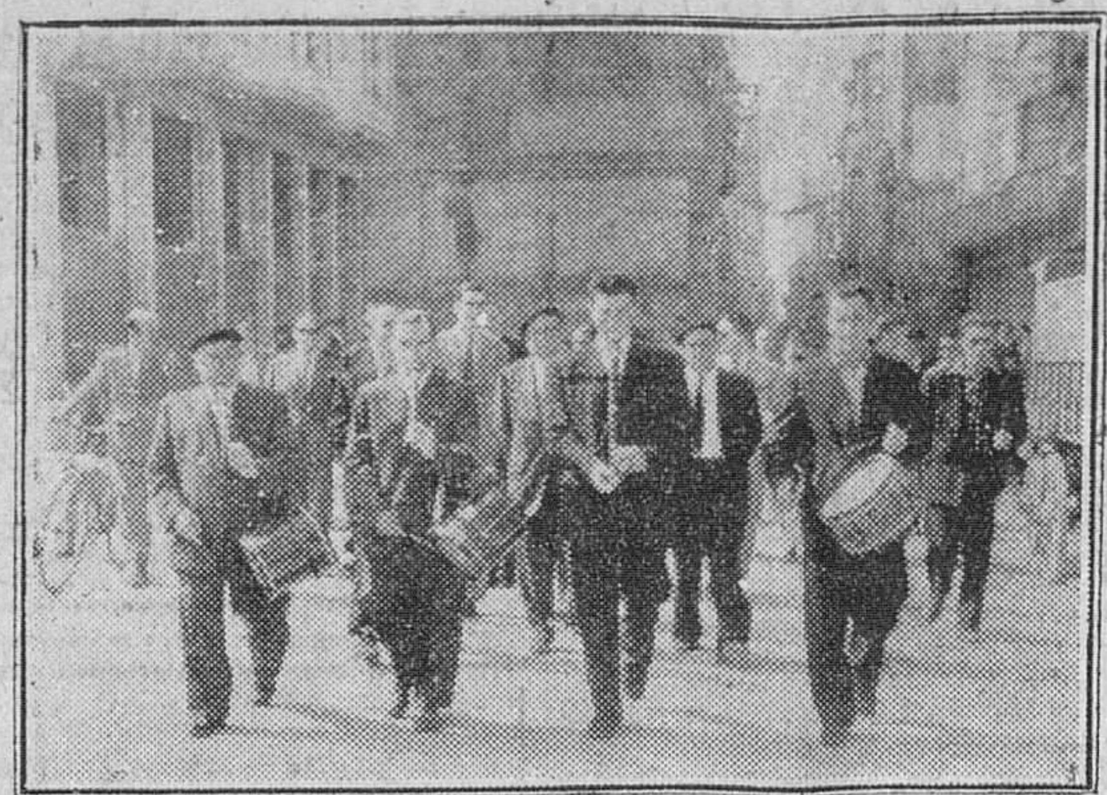
La "Casa Vasca", recientemente constituida en nuestra ciudad, celebró el domingo, por vez primera, la festividad de su Patrón, San Ignacio de Loyola. En nuestra foto, un grupo de vascos residentes en nuestra capital, se dirigen, después de celebrada solemne misa y precedidos de los típicos chistularis, al restaurante donde tuvo lugar la comida íntima conmemorativa.