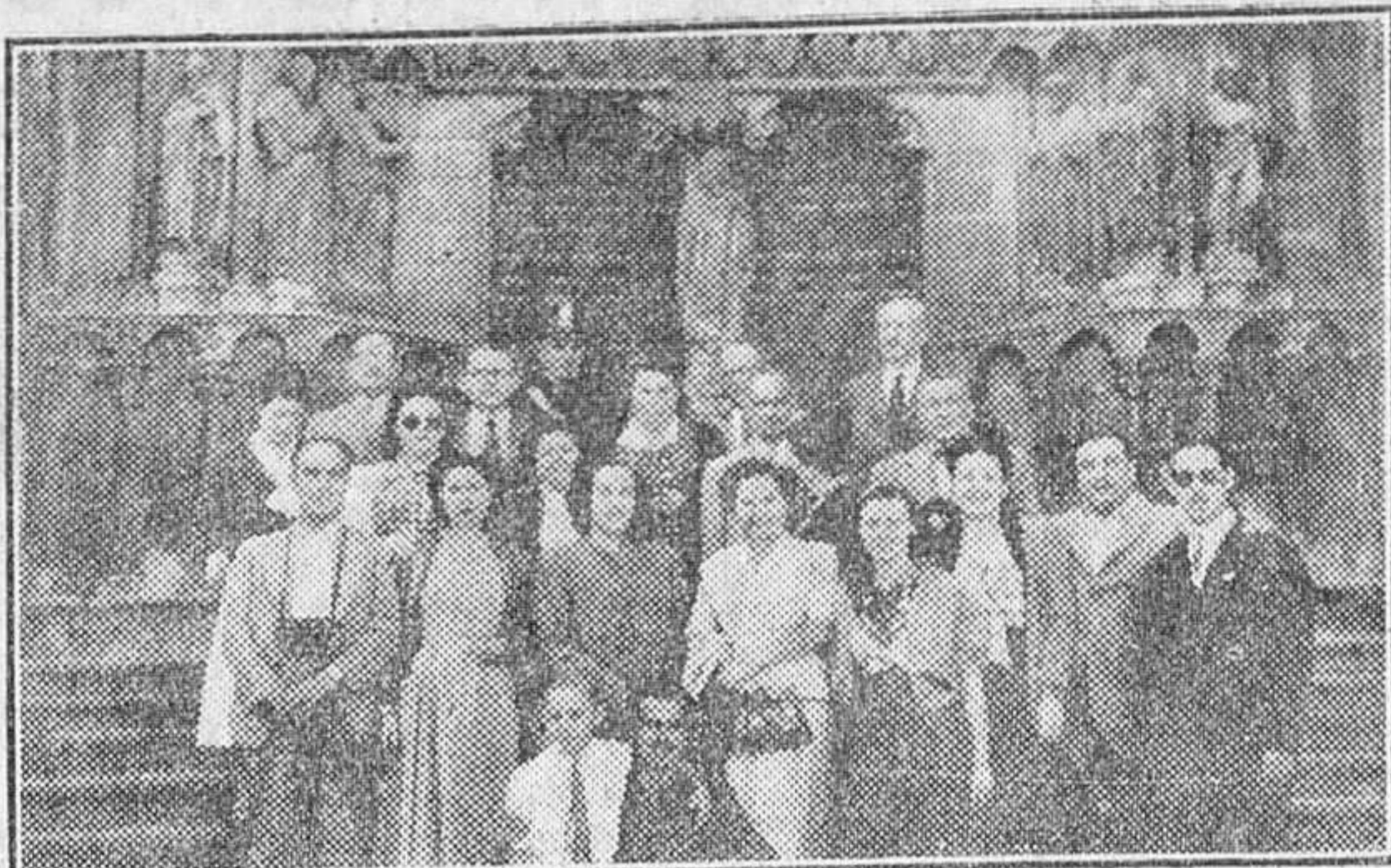
Grupo de excursionistas catalanes y argentinos, abandonando la Catedral, durante su visita a Burgos.