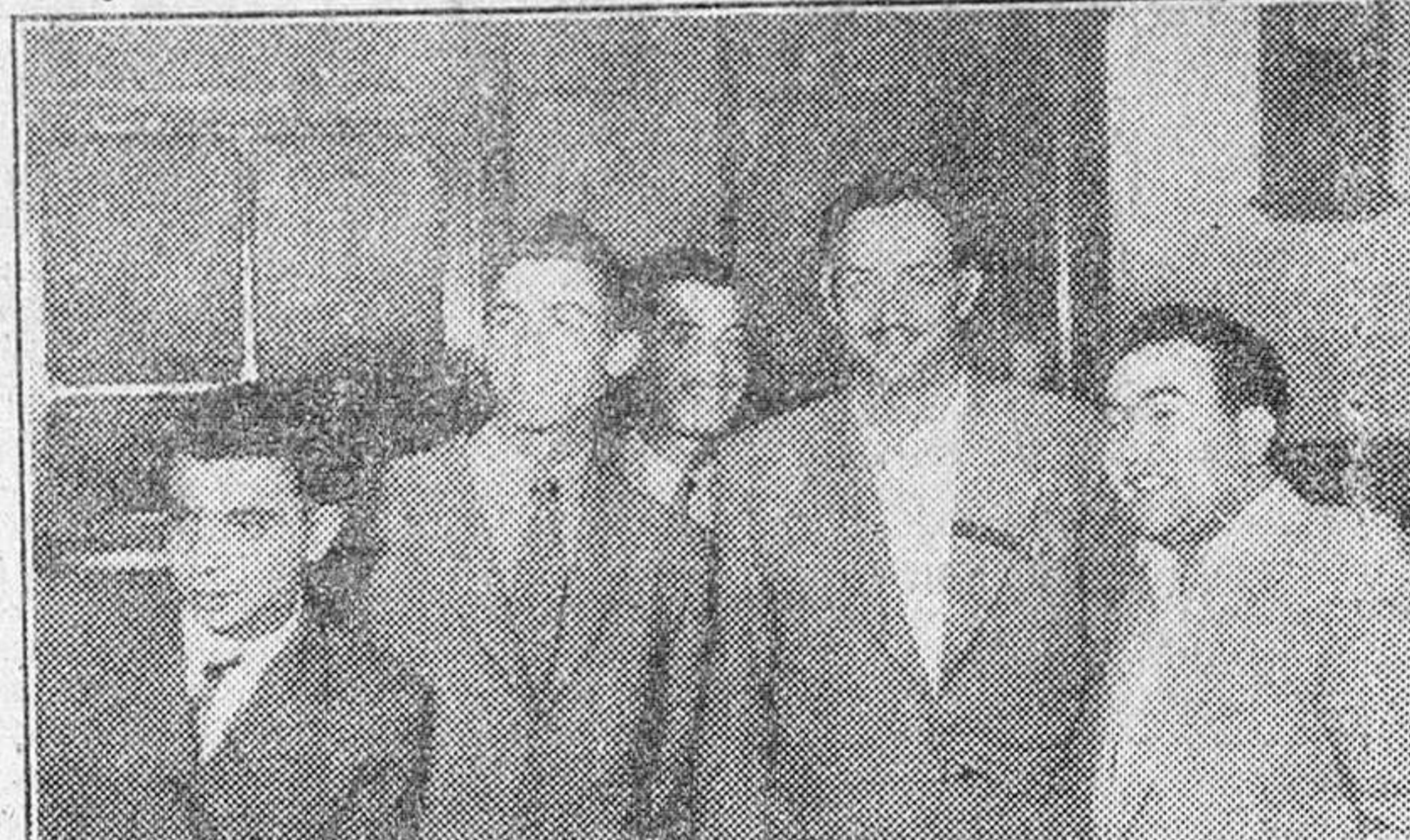
En la noche del domingo estuvo en Burgos, de paso para San Sebastián, Jorge Negrete. Nuestro fotógrafo obtuvo una placa del popular actor mejicano.