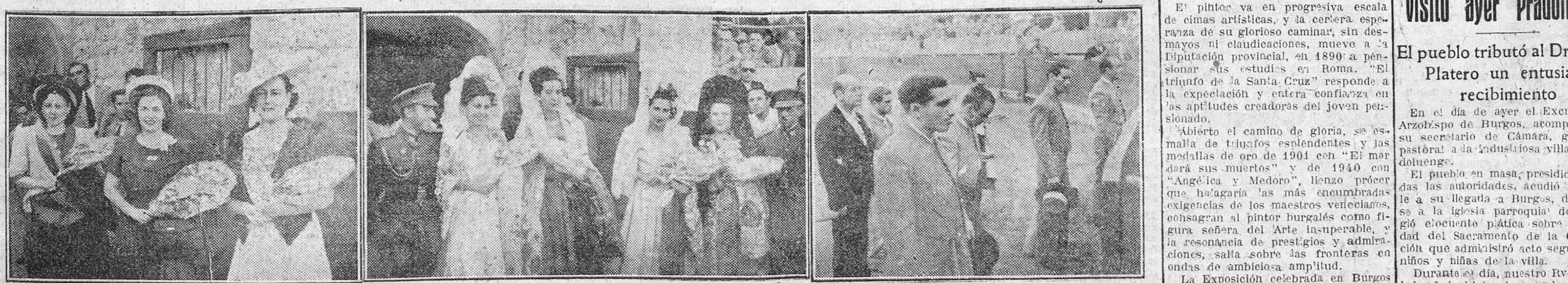
Reportaje gráfico de nuestro festival a beneficio del Asilo de Ancianos Desamparados. De izquierda a derecha, las distinguidas damas de honor. Las bellísimas madrinas. Finalmente, los diestros durante el minuto de silencio como homenaje a la memoria de Manote.