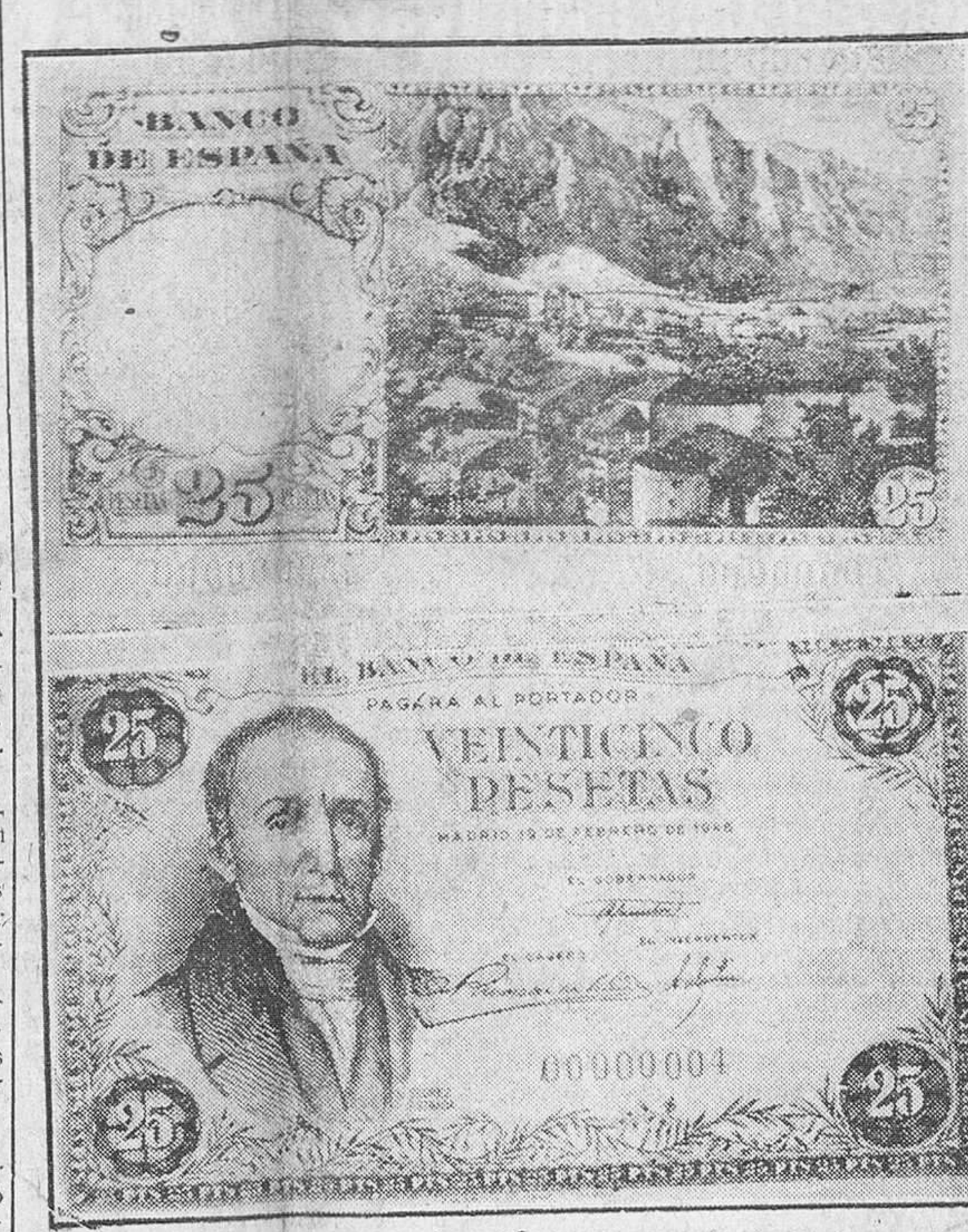
Madrid.— Anverso y reverso de los nuevos billetes de 25 pesetas que en breve serán puestos en circulación. El anverso muestra la efigie de don Alvaro Flórez Estrada, insigne economista español, el más notable de la primera mitad del siglo XIX, nacido en Pola de Somoiedo (Asturias); el reverso se reproduce en el reverso del billete.