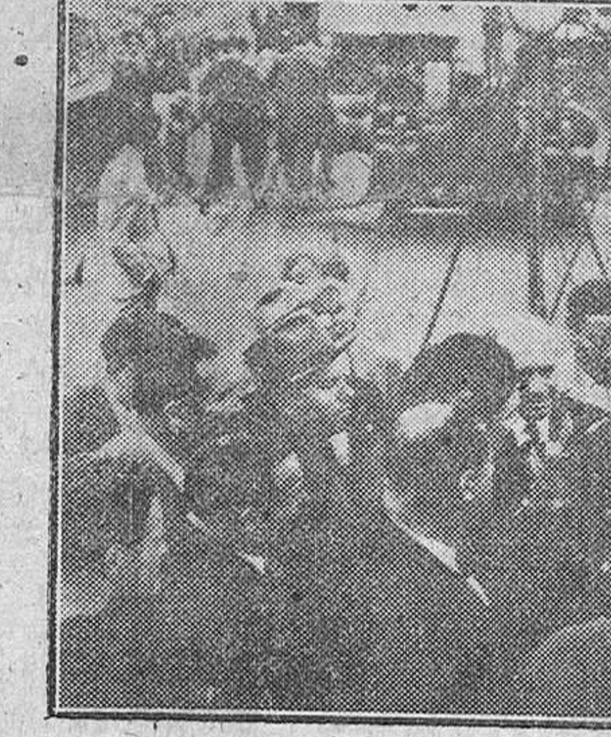
Veracruz (Méjico).— El capitán del trasatlántico español "Habana" saluda por radio a la nación mejicana, a su llegada al puerto de Veracruz.