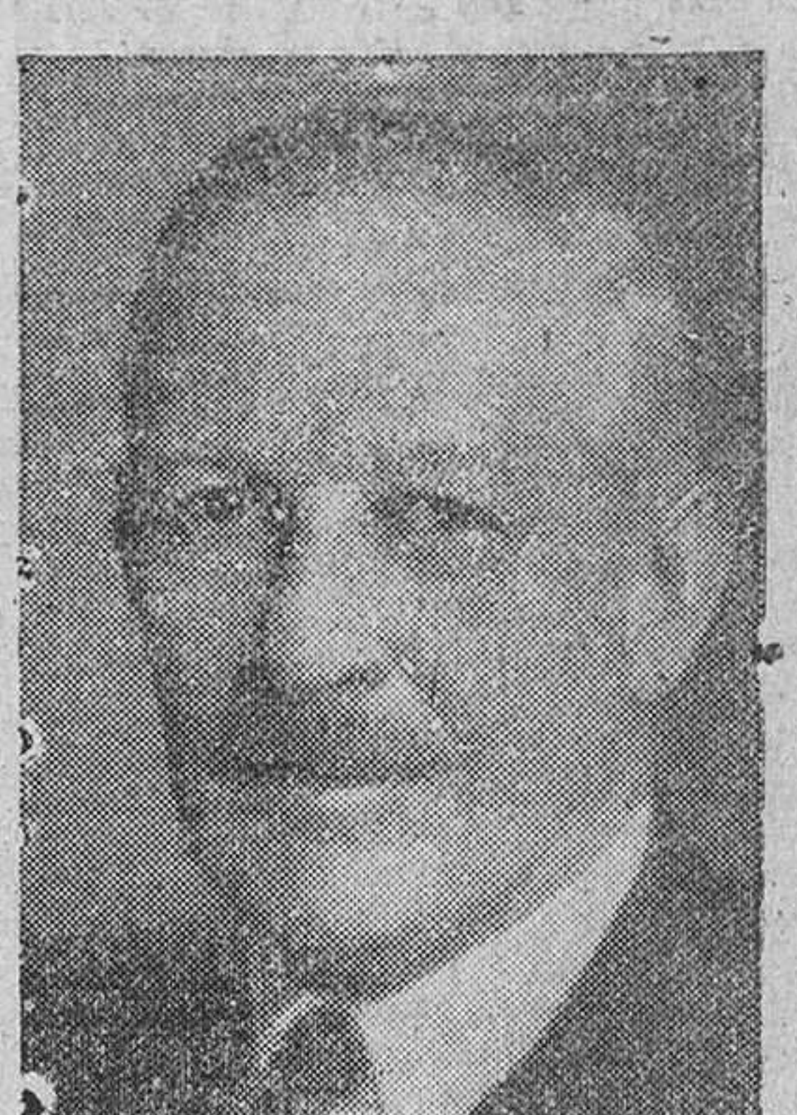
Recentemente ha sido nombrado embajador extraordinario y plenipotenciario de S. M. británica en Italia, Sir Victor Mallet, que anteriormente ocupó igual cargo en España.