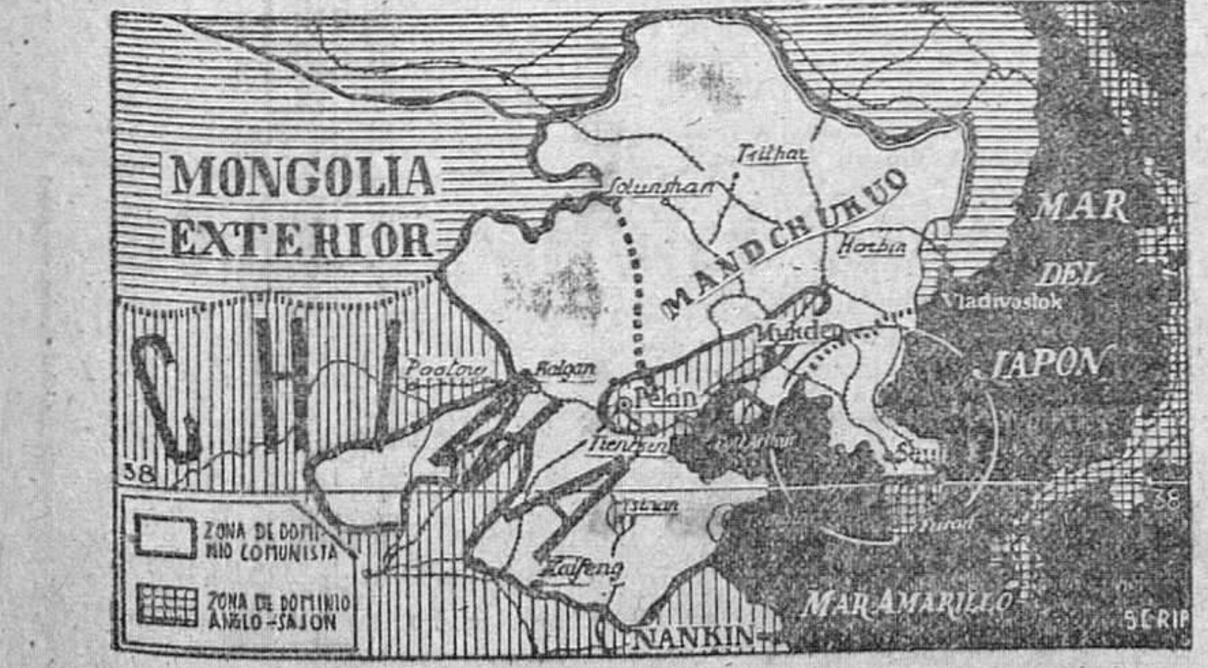
(Para la última página)