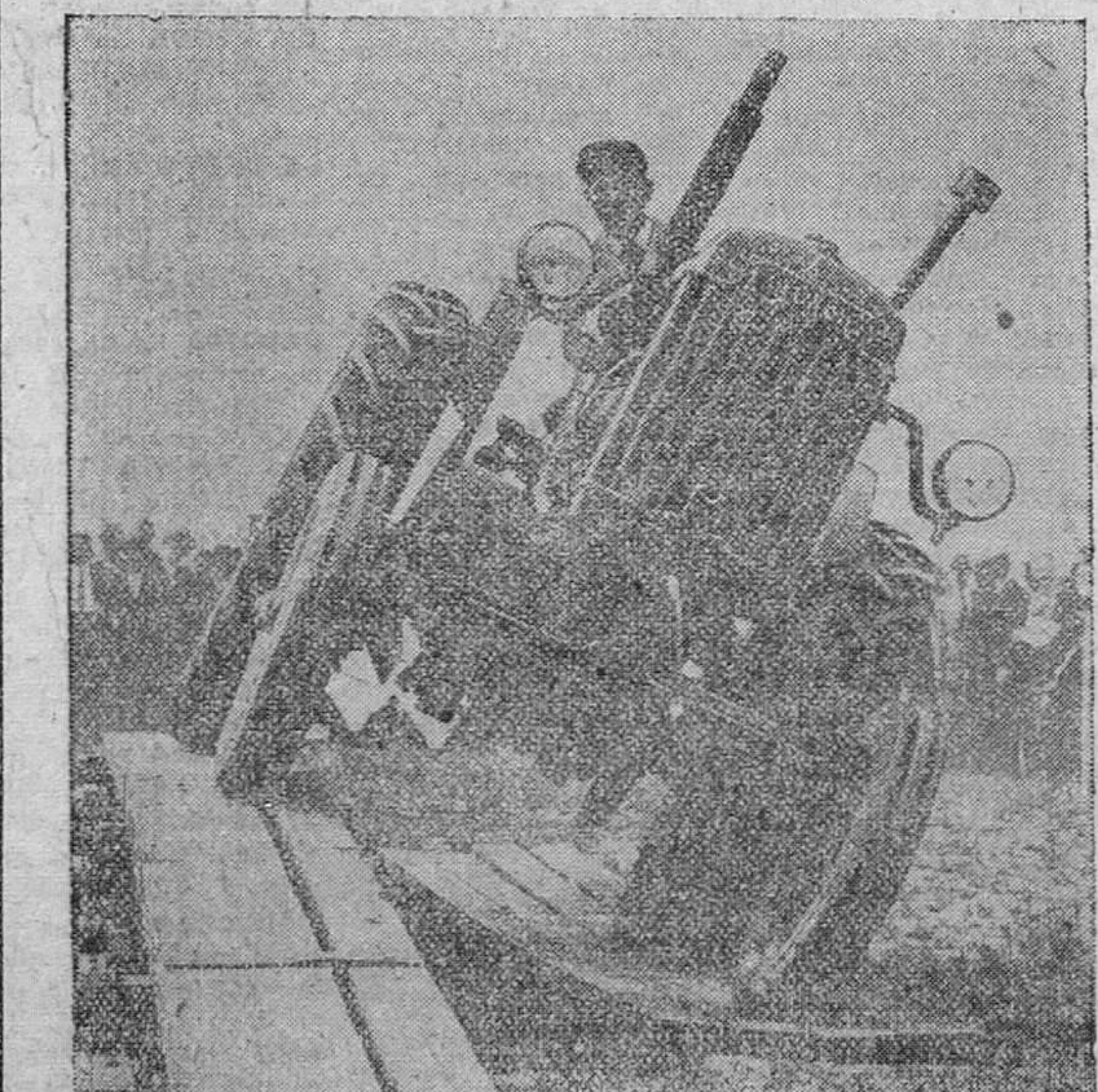
En una granja agrícola inglesa se realizan pruebas satisfactorias de este nuevo modelo de tractor, adaptable a todos los terrenos y de una gran capacidad de fuerza. Aquí vemos al vehículo salvando, sin el menor accidente, un declive artificial durante las pruebas.