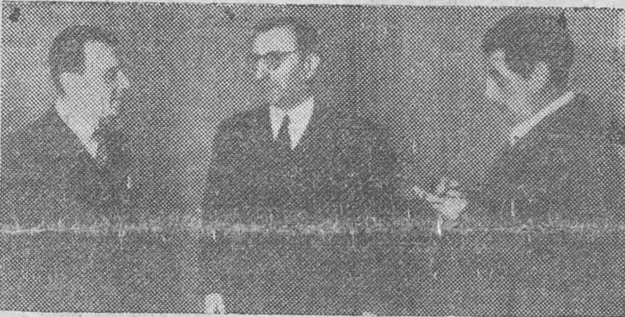
Barcelona.—El ministro del Interior de Bélgica, D. Eugenio Buisseret, que se encuentra en España en viaje particular, conversa con los periodistas barceloneses a su llegada a esta ciudad