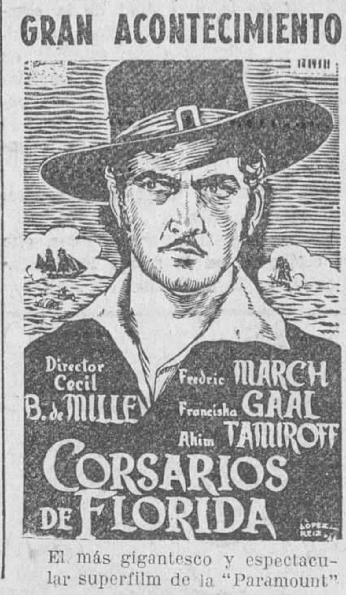
El más gigantesco y espectacular superfilm de la "Paramount"