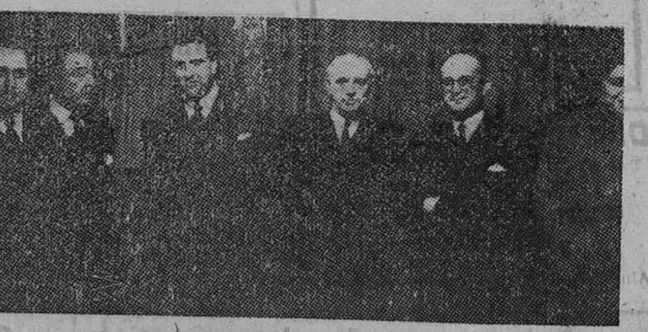
Madrid.— Los señores Martín Artaño e Ibañez Martín, con otras personalidades y el presidente de la Real Academia, señor Pemán, que pronunció un interesante discurso en la apertura del ciclo cervantino.