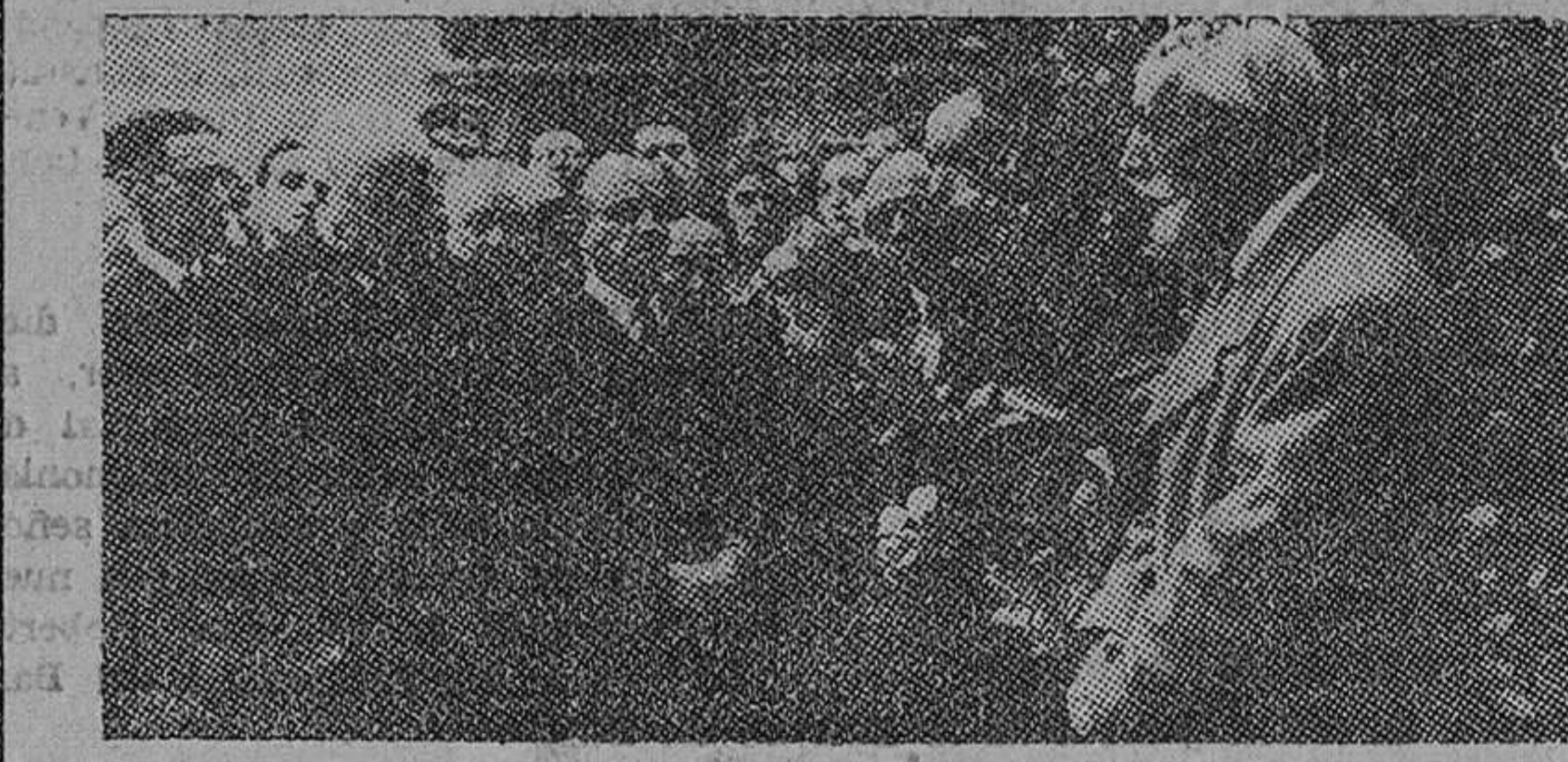
Madrid.— Un momento del descubrimiento de una lámpara de bronce, que los farmacéuticos españoles dedican a la memoria del Doctor Gómez Pamo, en la casa donde vivió el ilustre investigador.